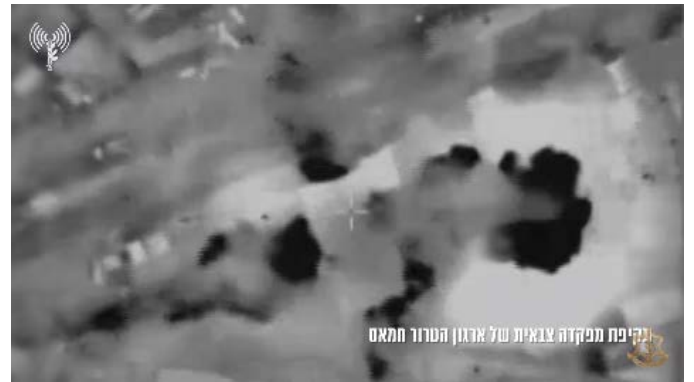
תקיפת מטרות ברצועת עזה (אתר דובר צה"ל, 20 בנובמבר 2023)