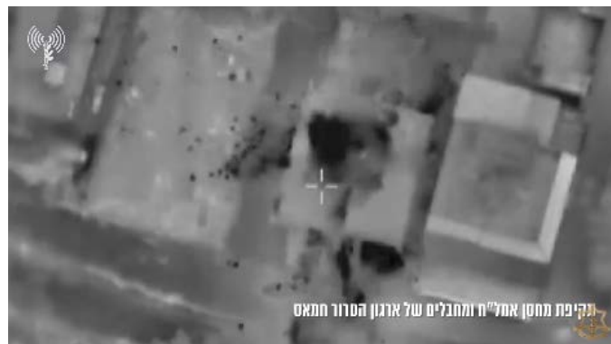
תקיפת מחסן אמצעי לחימה ומחבלי חמאס (אתר דובר צה"ל, 20 בנובמבר 2023)