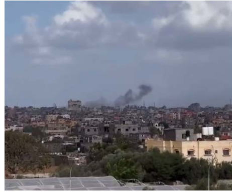
תקיפת חיל האוויר במערב העיר רפיח (20 בנובמבר 2023)