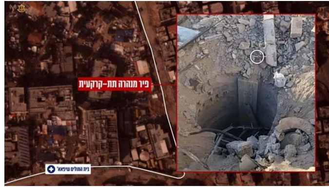
פיר המנהרה בשטח בית החולים

◆ מספר חטופים הובאו ב-7 באוקטובר לשטח בית החולים. כמו כן נמצא שאחת החיילות שנחטפו ואשר גופתה נמצאה ע"י כוחות צה"ל והוחזרה לישראל, הובאה לבית החולים כשהיא פצועה ונרצחה בשטחו. בתגובה, אמר עזת אלרשק, חבר הלשכה המדינית של חמאס , כי כמו שהם ציינו כבר בעבר, הם העבירו רבים מחטופים לבתי החולים לקבלת טיפול רפואי (ערוץ הטלגרם של חמאס, 19 בנובמבר 2023).