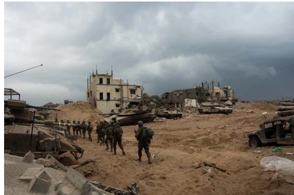
פעילות כוחות צה"ל ברצועת עזה (אתר צה"ל, 20 בנובמבר 2023)