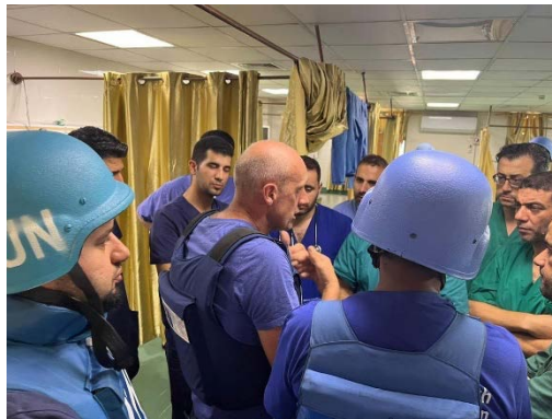
ביקור משלחת ארגון הבריאות העולמי (WHO) בבית החולים אלשפא' (חשבון X של QUDSN, 19 בנובמבר 2023)

◀ יצוין שב-19 בנובמבר 2023 בעת פעילות כוחות צה"ל במקום, ביקרה משלחת מטעם ארגון הבריאות העולמי (WHO) בבית החולים אלשפא'. לטענת המשלחת, המצב במקום קשה משום שהאספקה למקום נותקה ומספר מחלקות נהרסו (חשבון X של QUDSN, 19 בנובמבר 2023).