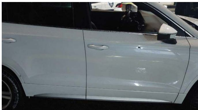
רכב ישראלי שנפגע מירי סמוך לאלזאויה (אתר royanews, 19 בנובמבר 2023)

◀ ב-19 בנובמבר 2023 בשעות הלילה בוצע ירי לעבר כלי רכב ישראלים סמוך לכפר אלזאויה (מערבית לסלפית). כמה כלי רכב נפגעו. לא דווח על נפגעים (חשבון X של דובר צה"ל, 20 בנובמבר 2023).