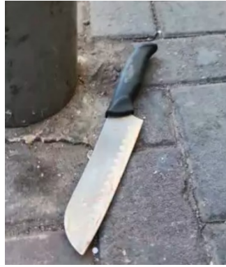
הסכין בה בוצע פיגוע הדקירה בירושלים