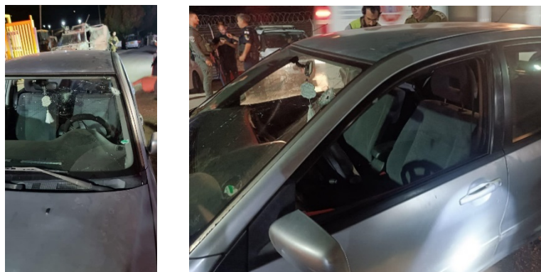
כלי הרכב שנפגע בפיגוע הירי (חשבון X של QUDSN, 9 בנובמבר 2023)

◆ ב-8 בנובמבר 2023 בשעות הערב בוצע ירי לעבר כלי רכב ישראלי סמוך לצומת גיתית שבין השומרון לבקעת הירדן. אזרח ישראלי נפצע באורח אנוש, אשתו באורח בינוני, ותינוקת בת חמישה חודשים שהייתה בכלי רכב לא נפגעה. על פי הערכה הראשונית, המחבל ארב לכלי רכב וירה לעברו באקדח. בסריקות בזירה נמצאו תרמילים. כוחות צה"ל הוזעקו למקום ומנהלים מצוד אחר המחבל (תקשורת ישראלית, 9 בנובמבר 2023).