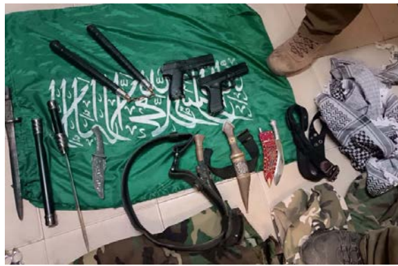
אמצעי לחימה ודגל חמאס שהוחרמו במהלך פעילות כוחות הביטחון ביהודה ושומרון (אתר דובר צה"ל, 8 בנובמבר 2023)

◀ כחלק מפעילות הסיכול, פעלו כוחות הביטחון, לאתר בתי דפוס המשמשים את חמאס להדפסת חומרי הסתה ולאיתור כספים שנועדו למימון פעולות טרור. כך למשל, ב-13 בנובמבר 2023 פעלו כוחות צה"ל בחברון וביטא (דרומית לחברון) ואטמו את משרדי אגודת הצדקה האסלאמית של חמאס, החרימו כספים וציוד מחשבים. בפעילות כוחות צה"ל בשכם הוחרמו חומרי הסתה מבית דפוס (דובר צה"ל, 13 בנובמבר 2023).