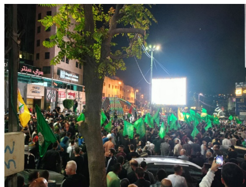
תהלוכה של חמאס בחברון (חשבון X של שהאב, 11 באוקטובר 2023)