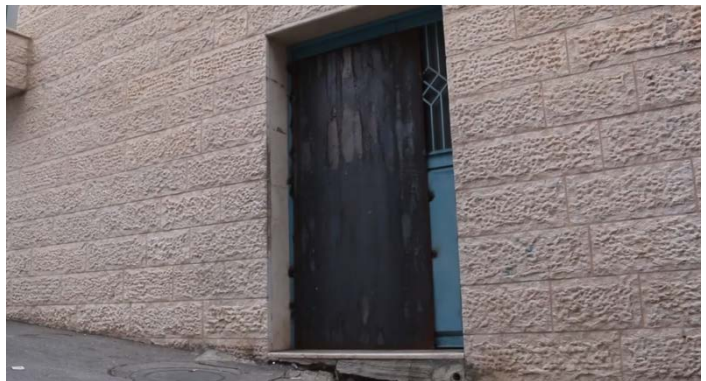
מימין: אטימת מבנה אגודת הצדקה האסלאמית של חמאס בחברון (ערוץ היוטיוב של ופא, 13 בנובמבר 2023). משמאל: חומרי הסתה שהוחרמו מבית דפוס בשכם (דובר צה"ל, 13 בנובמבר 2023)