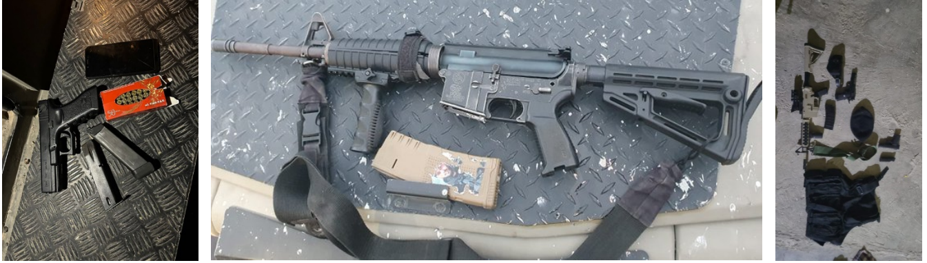
אמצעי לחימה שהוחרמו במהלך פעילות כוחות הביטחון (אתר דובר צה"ל, 29 באוקטובר 2023)