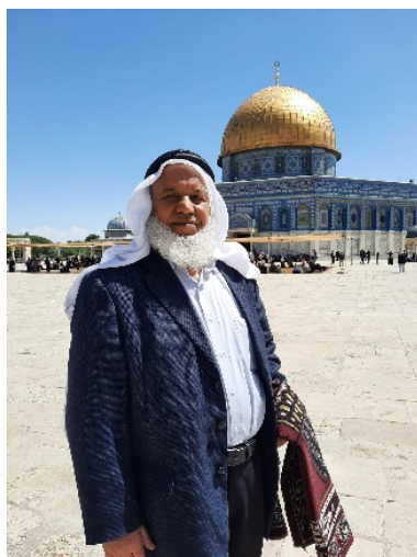
חאתם קפישה (דף הפייסבוק של חאתם קפישה, 17 באפריל 2023)

◆ חאתם קפישה , חבר המועצה המחוקקת מטעם התנועה. תושב חברון, אסיר משוחרר, ששהה שנים ארוכות בבתי הכלא בישראל. היה אחד מבכירי חמאס שגורשו למרג' אלזהור בשנת 1992 (אתר מרכז רא"יה לפיתוח פוליטי, 23 בנובמבר 2022). נעצר ב-13 באוקטובר (קדס פרס, 13 באוקטובר 2023).