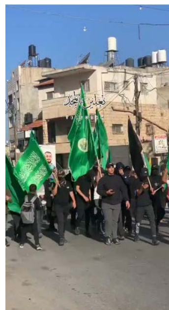
מימין: תהלוכת תלמידים בנעלין (ערוץ הטלגרם QUDSN, 6 בנובמבר 2023). משמאל: הפגנת תלמידות מול מחלקת החינוך במחוז ראמאללה (חשבון הטוויטר PALDF, 5 בנובמבר 2023)