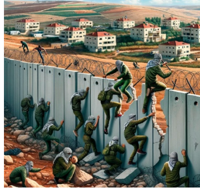
כרזות פלסטיניות הקוראות לפעילי הטרור ביהודה ושומרון לתקוף התנחלויות (ערוץ הטלגרם של קריקטורות פלסטיניות, 16 בנובמבר 2023)