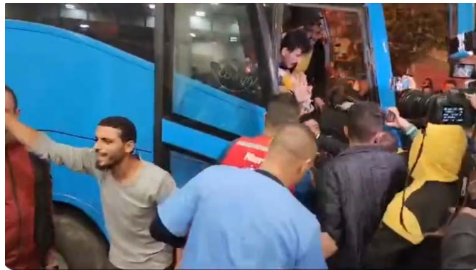
הגעת חולים ומפוני בית החולים האינדונזי בצפון הרצועה לבית החולים נאצר בח'אן יונס