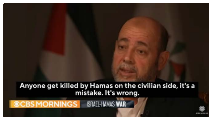
ראיון מוסא אבו מרזוק (אתר CBSNEWS, 20 בנובמבר 2023)

נושאת באחריות כלשהי למתרחש עתה ברצועת עזה, ענה בשלילה וציין שחמאס עשתה את חובתה ביצירת עתיד עבור הפלסטינים (אתר CBSNEWS, 20 בנובמבר 2023).