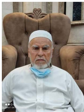
מצטפא אלקאנוע (חשבון X של אלא' נבהאן, 21 בנובמבר 2023)