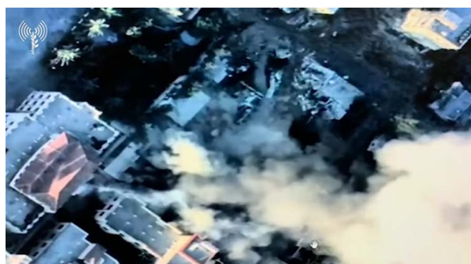
מימין: תקיפת לשכת מפקד חטיבת עזה. משמאל: אמצעי לחימה ורקטות שנמצאו בתוך מסגד (אתר דובר צה"ל, 20 בנובמבר 2023)

◆ ג'באליא: כוחות צה"ל השלימו את כיתור ג'באליא והם ערוכים להמשך פעילות במקום. כוחות צה"ל שפעלו באזור, תקפו מטרות טרור בסיוע מטוסי קרב וכלי טיס מאוישים מרחוק. בין המטרות שלושה פירים תת-קרקעיים בפאתי ג'באליא בהם נמצאו מחבלים. במקביל פעלו כוחות צה"ל מצפון לג'באליא לפתיחת ציר. הלוחמים איתרו פירי מנהרות ואמצעי לחימה במספר מוקדים, כולל בבתי מגורים ובחדרי ילדים (דובר צה"ל, 21 בנובמבר 2023).