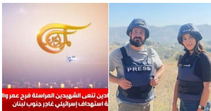
שני הכתבים שנהרגו (חשבון X של האני האשם, 21 בנובמבר 2023)

(אלנשרה, 21 בנובמבר 2023). חזבאללה פרסם גינוי לתקיפה והביע תנחומים למשפחות ההרוגים (רדיו אלנור, 21 בנובמבר 2023).