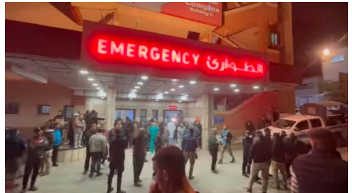
הכניסה הראשית לבית החולים נאצר בח'אן יונס עם הגעת חולים ומפונים מבית החולים האינדונזי בצפון הרצועה