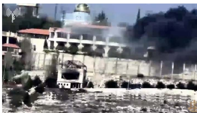
תקיפת תשתית טרור של חיזבאללה (אתר דובר צה"ל, 20 בנובמבר 2023)