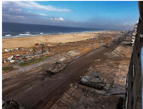
תיעוד כוחות צה"ל על ציר חוף הים של עזה (חשבון X של חסן אצליח, 21 בנובמבר 2023)

◀ פעילות קרקעית משולבת: נמשכה פעילות כוחות צה"ל בעיר עזה ובצפון הרצועה. במקביל בוצעו גם מספר תקיפות במרכז ובדרום הרצועה. במהלך הפעילות המשיכו הלוחמים לחשוף אמצעי לחימה ותשתיות צבאיות בבתי מגורים, בבתי חולים ובמוסדות חינוך ודת. כך למשל, איתרו לוחמים מצבור אמצעי לחימה וטיל נ"ט בבית מגורים שהוסתר מתחת למיטת תינוק. כמו כן נמצא במהלך הפעילות מסגד בשכונת זיתון בעזה, ששימש כמעבדה לייצור אמצעי לחימה (דובר צה"ל, 20 בנובמבר 2023).