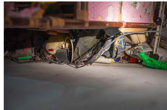
אמצעי הלחימה שאותרו בבית המחבל. משמאל: טיל נ"ט שהוסתר מתחת למיטת תינוק (דובר צה"ל, 21 בנובמבר 2023)