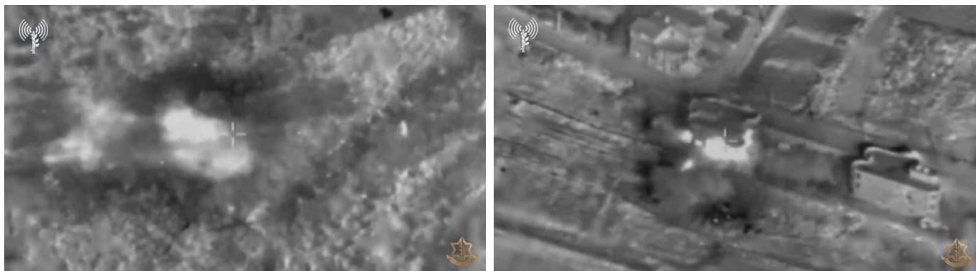
מימין: תקיפת תשתית להכוננת טרור של חזבאללה. משמאל: תקיפת חוליית נ"ט של חיזבאללה (אתר דובר צה"ל, 21 בנובמבר 2023)