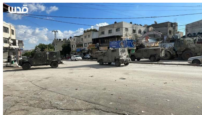
פעילות כוחות ביטחון במחנה הפליטים בלאטה בשכם