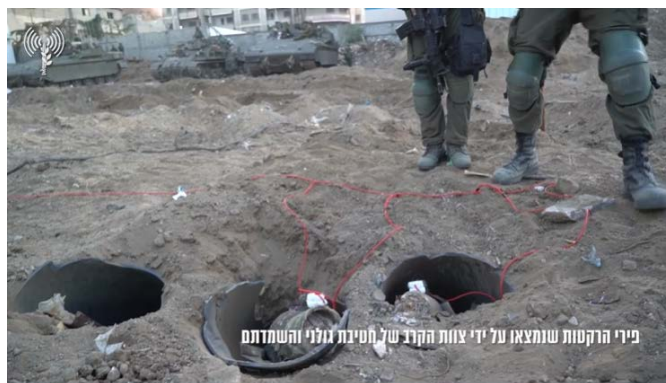
מימין: פירי רקטות שאותרו. משמאל: פיר מנהרה שאותר בתוך מסגד (דובר צה"ל, 20 בנובמבר 2023)