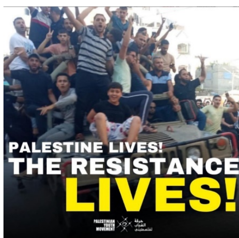
הודעת התמיכה של תנועת הצעירים הפלסטינים (הפייסבוק של התנועה, 7 באוקטובר 2023)

◀ התנועה גם סיפקה "חומר מידע" שלטענתה נועד לספק את "ההקשר האמיתי" של האירועים. "מה שהתקשורת המסורתית בשפה האנגלית מתייחסת אליו כמלחמת 'עזה-ישראל' הוא למעשה המאבק של אנשים תחת קולוניאליזם למען חירות", נטען בהסבר שכינה את המתקפה "רגע היסטורי" (Reddit, אוקטובר 2023). ◀ מאז תחילת מלחמת "חרבות ברזל", תנועת הצעירים מארגנת הפגנות, עצרות ופעולות מחאה נוספות על בסיס יומי בערים רבות בארה"ב ובקנדה, תוך האשמת ישראל ברצח עם ובקריאה להפסקת אש במלחמה. ב-17 באוקטובר 2023, התנועה ארגנה הפגנה מול הבית הלבן, שם נישאו שלטים שעליהם נכתב "סיימו את השואה הפלסטינית" ו-"הפסיקו לממן את הטיהור האתני" (Anadolu Agency, 17 באוקטובר 2022).