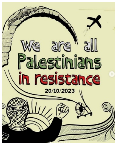
מודעה של Decolonize this Place להפגנה ב-20 באוקטובר (עמוד האינסטגרם של הארגון, 17 באוקטובר 2023)

◀ תנועת Decolonize This Place הביעה תמיכה מובהקת במתקפת הטרור של חמאס. ב-7 באוקטובר, היא העלתה פוסט באינסטגרם שהציג סרטונים של הטרקטור שהפיל את גדר הגבול ושל ההתקפה על החוגגים במסיבת נובה. "היום, מתעמתים עם המתנחלים הישראלים החמושים ועם הצבא המתנחל הקולוניאלי", נכתב בפוסט. "היום, הפלסטינים מספקים עוד מעשה של דמיון על הצורך לפעול כדי להיות חופשיים, נגד כל הסיכויים" (חשבון האינסטגרם של Decolonize This Place, 7 באוקטובר 2023).