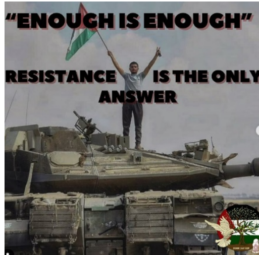
מודעה של הסניף של סטודנטים למען צדק בפלסטין בקולג' ג'ון ג'יי בניו יורק

◀ ארגון הגג של SJP כינה את מתקפת חמאס ב-7 באוקטובר: "ניצחון היסטורי עבור ההתנגדות הפלסטינית" והצהיר כי "זו צריכה להיות המשמעות של פלסטין חופשית: לא רק סיסמאות ועצרות, אלא עימות מזוין עם המדכאים" (The Seattle Times, 18 באוקטובר 2023).