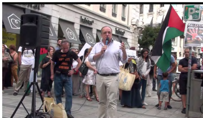
עורך הדין בהפגנה בליון נגד "המצור" על רצועת עזה (יוטיוב, 6 באוגוסט 2014)

◀ עורך הדין Gilles Devers הוא צרפתי יליד 1956, בלוגר, מורה-חוקר ומרצה. חבר לשכת עורכי הדין של ליון. הוא אחד הדוברים של קבוצה של 350 ארגונים לא ממשלתיים המיוצגים על ידי ארבעים עורכי דין האחראים לטיפול בעתירה לבית הדין הפלילי הבינלאומי בגין פשעי מלחמה. הוא ייצג את הרשות הפלסטינית בפני בית הדין הפלילי הבינלאומי. במהלך מבצע "עופרת יצוקה" (2008-2009), לאחר שלדבריו, הרשות הפלסטינית העניקה לו את המנדט להגיש תלונה בשמה, הוא הגיש תלונה נוספת נגד ישראל ביולי 2014 בשם שר המשפטים ברשות הפלסטינית, בנוגע לאירועי מבצע "צוק איתן". 1