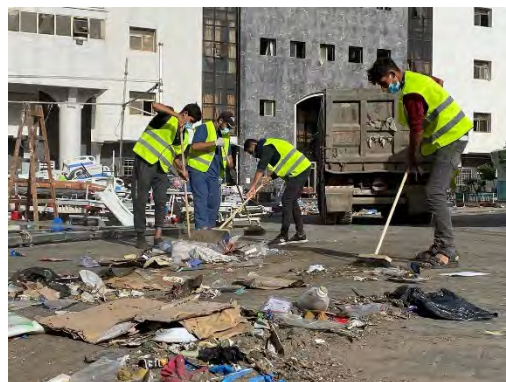
מתנדבים מטעם משרד הבריאות בעזה מנקים את אזור בית החולים אלשפאא' (חשבון X של חסן אצליח, 26 בנובמבר 2023)