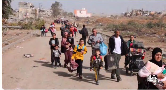
תושבים מצפון העיר עזה ממשיכים להתפנות לדרום הרצועה (ערוץ היוטיוב של ופא, 26 בנובמבר 2023)

◀ במקביל, מדווחים כלי התקשורת הפלסטינים על תושבי צפון העיר עזה שמנצלים את הפסקת האש כדי להתפנות לדרום הרצועה (ערוץ היוטיוב של ופא, 26 בנובמבר 2023).