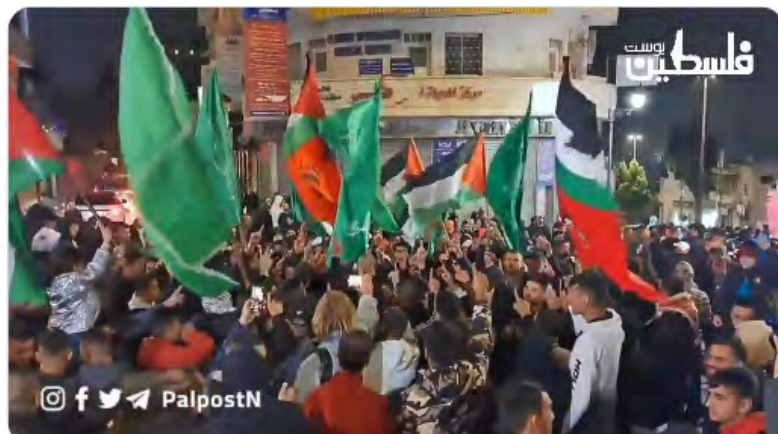
קבלת הפנים ברמאללה לקבוצה השלישית של האסירים הפלסטינים ששוחררו. הושמעו קריאות תודה לעזה