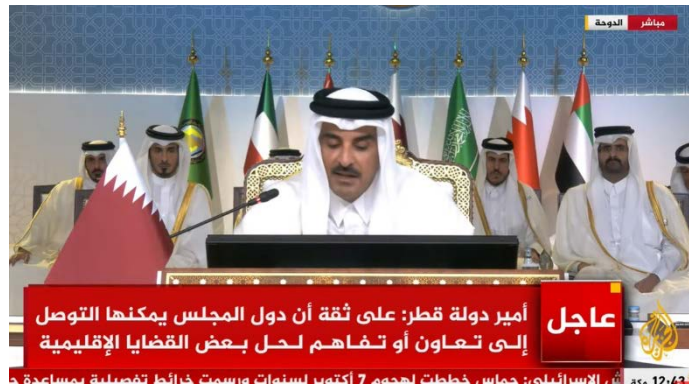
השיח' תמים נושא דברים בכנס (אלג'זירה, 5 בדצמבר 2023)

◀ רג'פ טאיפ ארדואן, נשיא תורכיה , אמר בנאומו כי ממשלת ישראל מסכנת את הביטחון ואת עתיד האזור כדי להאריך את חייה הפוליטיים. הוא ציין שאסור להם לאפשר למעשי הטבח בעזה להפוך למלחמה אזורית שתכלול את סוריה. לדבריו, ישראל מבצעת "פשעי מלחמה ופשעים נגד האנושות", וכי העדיפות העליונה עתה היא להכריז על הפסקת אש קבועה ומיידית ולהבטיח כניסה רציפה של סיוע הומניטרי לרצועה (אנטוליה, 5 בדצמבר 2023).