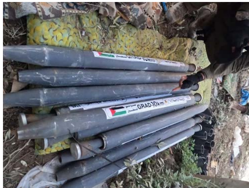
רקטות שאותרו בחצר בית בצפון הרצועה (דובר צה"ל, 5 בדצמבר 2023)

◀ פעילות קרקעית: כוחות צה"ל שפעלו באזור ג'באליא השלימו את כיתור מחנה הפליטים. הכוחות, פעלו במעוזי חמאס והשמידו תשתיות טרור, איתרו אמצעי לחימה ומשגרים במבנים אזרחיים, והכוונו כוחות אוויריים שתקפו חוליות מחבלים. הכוחות גם תקפו מבנים מהם פעלו פעילי נח'בה, איתרו והשמידו רקטות. כוחות משולבים של יבשה וים פשטו על מבנה חמ"ל הביטחון הכללי של חמאס בג'באליא. בחמ"ל אותרו אמצעי תצפית ושליטה, אמצעי לחימה ומפות (דובר צה"ל, 5 בדצמבר 2023).