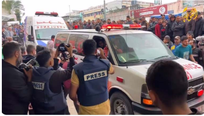
פינוי נפגעים רבים מתקיפות צה"ל באזור ח'אן יונס לבית החולים נאצר בעיר (חשבון X של QUDSN, 5 בדצמבר 2023)