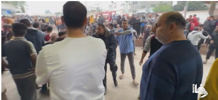
תושבים רבים מתגודדים בכניסה הראשית לבית חולים נאצר בח'אן יונס ואנשי משטרת חמאס מנסים להשליט סדר (ערוץ היוטיוב של ופא, 5 בדצמבר 2023)