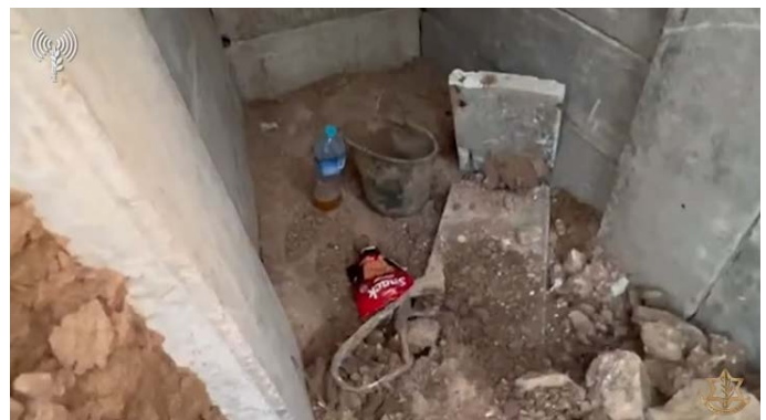
מימין: עמדת לחימה. משמאל: מנהרה ששימשה את פעילי חמאס (דובר צה"ל, 4 בדצמבר 2023)