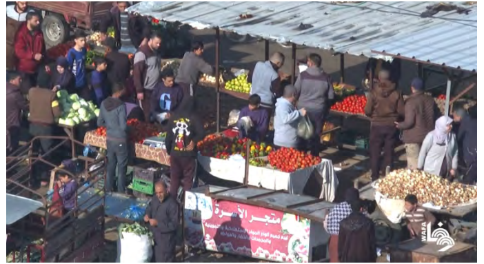
תמונות מהבוקר ברפ"ח. בעלי דוכנים בשוק מסדרים את סחורתם לצד תושבים הקונים בשוק (ערוץ היוטיוב של ופא, 6 בדצמבר 2023)

◀ לדברי אסאמה חמדאן, בכיר חמאס , ישראל אינה מסתפקת ב"מעשי הטבח", אלא גם נוקטת במדיניות הרעבה נגד תושבי עזה באמצעות המצור ומניעת הגעת הסיוע. אמר כי כל מי שמונע הגעת הסיוע לרצועה הוא שותף בפשע של הרעבת הפלסטינים. הזהיר מפני עלייה במספר ההרוגים בשל מחלות, רעב וצמא, וקרא למדינות הערביות והאסלאמיות ולבעלי המצפון החי בעולם לשאת באחריותם האנושית והמוסרית. הוא גם קרא לאונר"א ולארגון הבריאות העולמי לשאת באחריותם ולהמשיך להעניק את שירותיהם לתושבי הרצועה, ולא להיכנע לתכתיביה של ישראל. בהקשר זה ציין חמדאן, כי עמדת אונר"א אינה מובנת, שכן היא נענית לכל דרישות ישראל וזונחת את אחריותה (ערוץ היוטיוב של אלג'זירה מבאשר, 5 בדצמבר 2023).