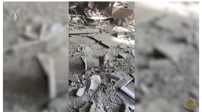
מטען שאותר בבית ספר בצפון הרצועה. משמאל: מצבור אמצעי לחימה שנמצא בצפון הרצועה (אתר צה"ל, 6 בדצמבר 2023)