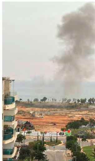
עשן מיתמר בגוש דן בעקבות נפילת רקטה (חשבון X של QUDSN, 5 בדצמבר 2023)