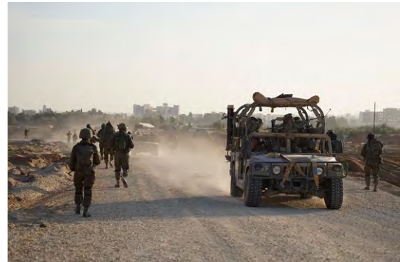
תיעוד כוחות צה"ל ברצועת עזה

פעילות אווירית: ביממה האחרונה, חיל האוויר תקף כ-250 מטרות בשטח רצועת עזה. בתקיפות נהרגו פעילי חמאס והג'יהאד האסלאמי בפלסטין, והושמדו תשתיות טרור (דובר צה"ל, 6 בדצמבר 2023).