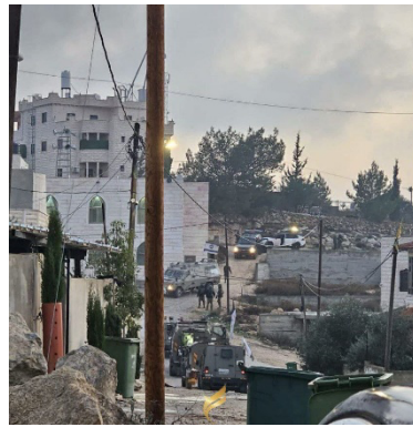
מעצר מבוקשים במחנה הפליטים אלדהישה בבית לחם (חשבון X של QUDSN, 6 בדצמבר 2023)

◆ ב-6 בדצמבר 2023, לפנות בוקר, פעלו הכוחות בכפר טמון בצפון השומרון, ובמחנה הפליטים אלפארעה. בשני המקומות התגלעו עימותים אלימים בין חמושים לכוחות, אשר ביצעו ירי לעברם. זהו פגיעות (ערוץ הטלגרם של דובר צה"ל, 6 בדצמבר 2023). הפלסטינים דיווחו על שני הרוגים פלסטינים, אחד בטמון והשני במחנה הפליטים אלפארעה. גופתו של ההרוג בטמון נעטפה בדגל חמאס ושל ההרוג השני בדגל של הג'האד האסלאמי בפלסטין (ופא, חשבון X של PALINFO, 6 בדצמבר 2023). מאוחר יותר דיווחו הפלסטינים על פעילות כוחות ביטחון ישראליים למעצר מבוקשים במחנה הפליטים אלדהישה בבית לחם (חשבון X של QUDSN, 6 בדצמבר 2023).