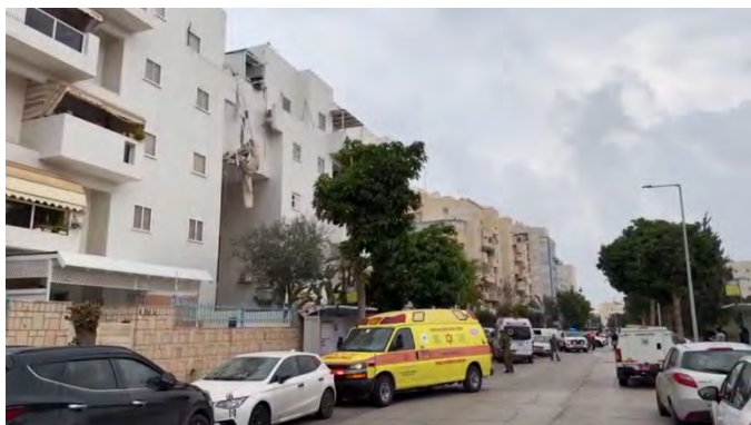
פגיעה ישירה של רקטה בבניין מגורים באשקלון (מימין: דוברות מד"א. משמאל: חשבון X של QUDSN, 5 בדצמבר 2023)