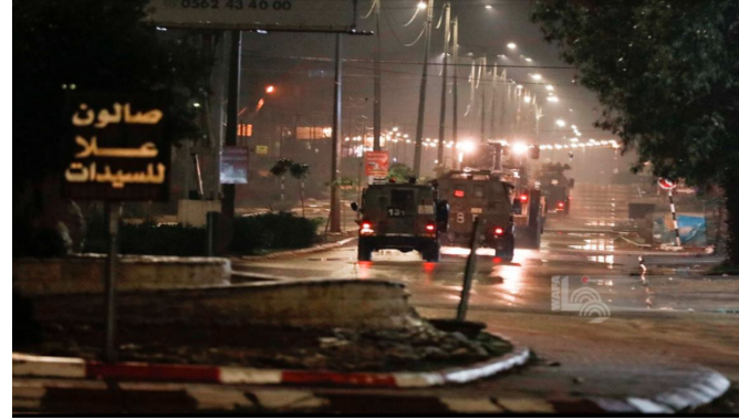
מימין פעילות כוחות הביטחון במחנה הפליטים ג'נין (חשבון X של QUDSN, 5 בדצמבר 2023). משמאל: אמצעי הלחימה שנתפסו בפעילות במחנה הפליטים ג'נין (אתר דובר צה"ל, 6 בדצמבר 2023)

◆ ב-6 בדצמבר 2023, לפנות בוקר, פעלו הכוחות בכפר טמון בצפון השומרון, ובמחנה הפליטים אלפארעה. בשני המקומות התגלעו עימותים אלימים בין חמושים לכוחות, אשר ביצעו ירי לעברם. זהו פגיעות (ערוץ הטלגרם של דובר צה"ל, 6 בדצמבר 2023). הפלסטינים דיווחו על שני הרוגים פלסטינים, אחד בטמון והשני במחנה הפליטים אלפארעה. גופתו של ההרוג בטמון נעטפה בדגל חמאס ושל ההרוג השני בדגל של הג'האד האסלאמי בפלסטין (ופא, חשבון X של PALINFO, 6 בדצמבר 2023). מאוחר יותר דיווחו הפלסטינים על פעילות כוחות ביטחון ישראליים למעצר מבוקשים במחנה הפליטים אלדהישה בבית לחם (חשבון X של QUDSN, 6 בדצמבר 2023).