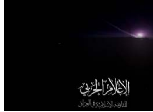
מתוך סרטון מה-24 באוקטובר 2023 המתעד ירי כלי טיס בלתי מאויש לעבר בסיס עין אלאסד