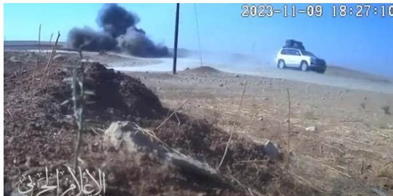
מתוך סרטון מה-9 בנובמבר 2023 המתעד הפעלת מטען נגד כלי רכב אמריקני באזור מוצול (ערוץ הטלגרם של ההתנגדות האסלאמית בעיראק, 9 בנובמבר 2023)