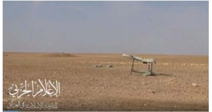
מתוך סרטון מה-23 באוקטובר 2023: כלי טיס בלתי מאויש רגע לפני שיגורו ובעת שיגורו לעבר בסיס אלחנף ואלרכבאן (ערוץ הטלגרם של ההתנגדות האסלאמית בעיראק, 23 באוקטובר 2023)