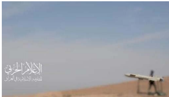
מתוך סרטון מה-27 באוקטובר 2023: כלי טיס בלתי מאויש רגע לפני שיגורו לעבר בסיס עין אלאסד (ערוץ הטלגרם של ההתנגדות האסלאמית בעיראק, 27 באוקטובר 2023)

◀ מסרטונים 8 קצרים שפרסמה ההתנגדות האסלאמית בעיראק עולה שחלק מהתקיפות בוצעו באמצעות כלי טיס בלתי מאוישים המשמשים את המיליציות הפרו-איראניות בעיראק ורובם המכריע שוגרו בשעות החשכה. בנוסף, עושה הארגון שימוש גם ברקטות וטילים. ב-6 בנובמבר 2023 חשף הארגון את הרקטה אלאקצא 1, שבאמצעותה תקף לדבריו יעדים אמריקנים בסוריה ועיראק (אלנשרה, 6 בנובמבר 2023). ב-14 בנובמבר 2023 חשף הארגון טיל חכם קצר טווח בשם צארם (אלמיאדין, 14 בנובמבר 2023). במקרה אחד, בודד עד כה, ביצע הארגון פיגוע תוך שימוש במטען חבלה נגד כלי רכב אמריקני באזור מוצול בעיראק.