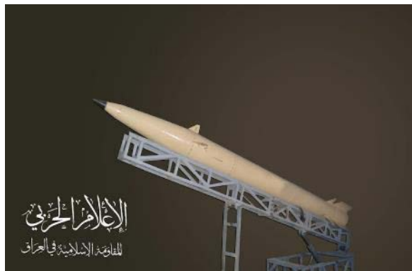
טיל חכם קצר טווח בשם צארם (אלמיאדין, 14 בנובמבר 2023)