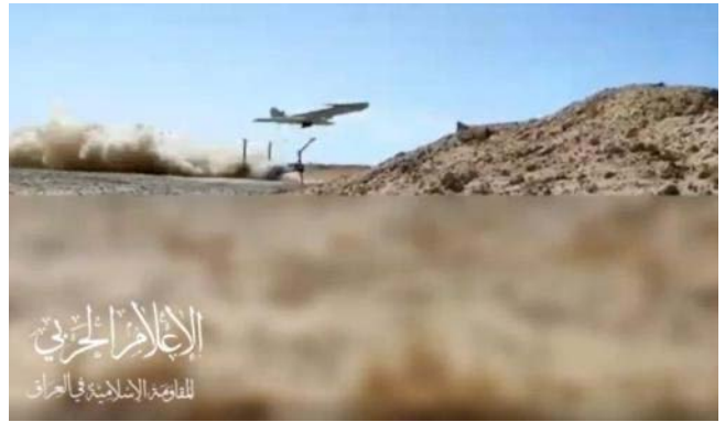
מתוך סרטון מה-21 באוקטובר 2023 המתעד שיגור כלי טיס בלתי מאויש לעבר בסיס עין אלאסד