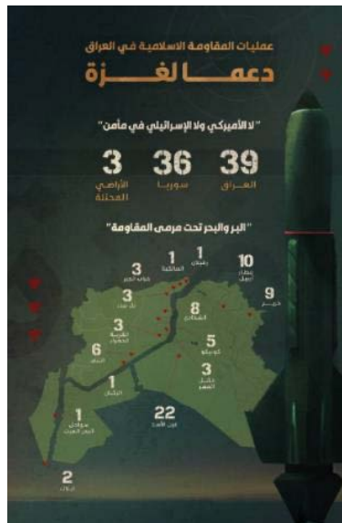
האינפוגרף המרכז את פעילות הארגון בין התאריכים 18 באוקטובר 2023 לבין 25 בנובמבר 2023 (ערוץ הטלגרם של ההתנגדות האסלאמית בעיראק, 25 בנובמבר 2023)

◀ ערוץ הטלגרם, צאברין ניוז, המזוהה עם המיליציות הפרו-איראניות בעיראק, פרסם ב-23 בנובמבר 2023 אינפוגרף, המרכז את נתוני פעילות ההתנגדות האסלאמית בעיראק נגד יעדים אמריקנים בסוריה ובעיראק ונגד יעדים בישראל בין 18 באוקטובר 2023 - 23 בנובמבר 2023, ופרט בו את היעדים לתקיפה ואת אמצעי הלחימה, שבהם נעשה שימוש (ערוץ הטלגרם צאברין ניוז, 23 בנובמבר 2023). על-פי האינפוגרף, הארגון ביצע בתקופה הנדונה 71 תקיפות, על-פי החלוקה להלן: עיראק: בוצעו 34 תקיפות בסוריה: 34 ובישראל ("פלסטין הכבושה"): שלוש תקיפות - 2 נגד אילת באמצעות מטח טילים ואחת נגד חופיים המלח באמצעות שני כטב"מים. ◀ ערוץ הטלגרם של ההתנגדות האסלאמית בעיראק פרסם אינפוגרף ב-25 בנובמבר 2023, המרכז את פעילות הארגון בין 18 באוקטובר 2023 - 25 בנובמבר 2023. על-פי האינפוגרף, ביצע הארגון 78 תקיפות 7 - 39 בעיראק, 36 - בסוריה ו-3 בישראל. באינפוגרף צוין כי "לא האמריקני ולא הישראלי יזכו למקום בטוח" וכי היבשה והים נמצאים בטווח הפגיעה של "ההתנגדות". בנוסף לאינפוגרף פורסמו מפות בהן צוינו יעדי הפגיעה (ערוץ הטלגרם של ההתנגדות האסלאמית בעיראק, 25 בנובמבר 2023).