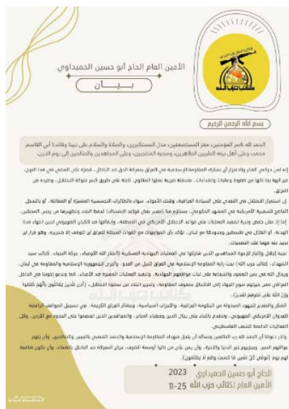
נוסח ההודעה של כגדודי חזבאללה (ערוץ הטלגרם כאפ, 25 בנובמבר 2023)

تحية إجلال وإكبار للبخوة المجاهدين الذين شاركوا في العمليات الجهادية العسكرية [أنصار الله الأوفياء ، حركة النجباء ، كتائب سيد الشهداء ، كتائب حزب الله] تحت راية المقاومة الإسلامية في العراق للنيل من العدو ، وأخرى للجمهورية الإسلامية والمقاومة في لبنان ، ورجال الله في اليمن الصمود والشجاعة على ثبات مواقفهم الجهادية ، وتنفيذ العمليات المميزة ضد الأعداء ، كما وتدعو إخواننا في الداخل العراقي ممن خربتهم سوح الجهاد إلى الالتحاق بصوف المقاومة ، وتحرير البلاد من سطوة الاحتلال ، [أذن لئذبن يقَاتِلُون بِأَهْمَ ظَلَمُوا وإنَّ الله على ظههم لقيدير] .