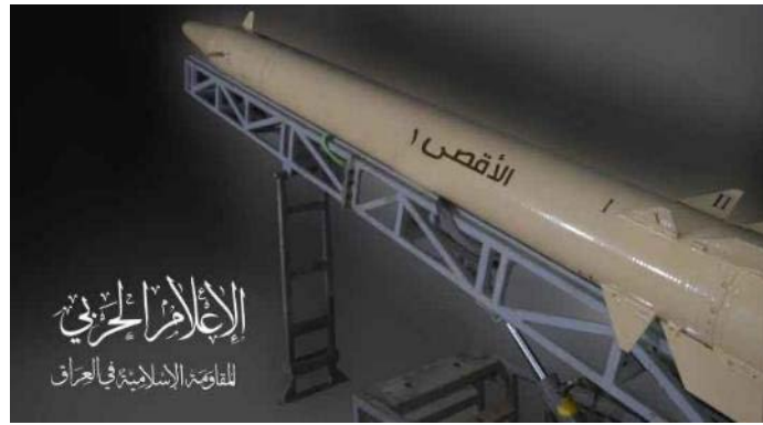
הרקטה אלאקצא 1 של ההתנגדות האסלאמית בעיראק, שבה עשה הארגון שימוש נגד יעדים אמריקנים בסוריה ועיראק (אלנשרה, 6 בנובמבר 2023).