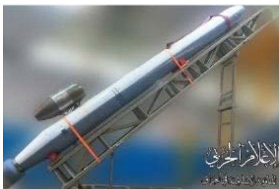
צילום של רקטה על כן שיגור שצורף לאיום (ערוץ הטלגרם של ההתנגדות האסלאמית בעיראק, 3 בנובמבר 2023)

ההתנגדות האסלאמית בעיראק פרסמה ב-3 בנובמבר 2023 הודעה כי הם יחלו בשבוע הקרוב שלב חדש בעימות. על-פי ההודעה, שלב זה יהיה עוצמתי יותר ונרחב יותר. להודעה צורף צילום של רקטה על כן שיגור (ערוץ הטלגרם של ההתנגדות האסלאמית בעיראק, 3 בנובמבר 2023). יתכן שהשלב הבא עלול לכלול גם הגברת התקיפות של המיליציות נגד ישראל ובפרט משטח סוריה.