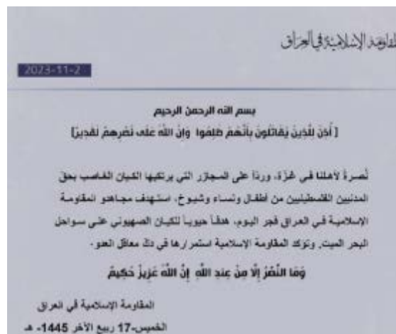
ההודעה על תקיפת "יעד חיוני על חופי ים המלח" (ערוץ הטלגרם של ההתנגדות האסלאמית בעיראק, 2 בנובמבר 2023)

ב-2 בנובמבר 2023 הודיע הארגון כי תקף לראשונה בישראל עם פרסום הודעה לפיה הוא תקף "יעד חיוני" ישראלי על חופי ים המלח. על-פי הודעת הארגון: "מתוך סיוע לאנשינו בעזה ובתגובה על הטבח שהישות הציונית העושקת מבצעת נגד אזרחים הפלסטינים - ילדים, נשים וזקנים, תקפו לוחמי הג'האד של ההתנגדות האסלאמית בעיראק היום [2 בנובמבר 2023] לפנות בוקר מטרה חיונית של הישות הציונית בחופי ים המלח. ההתנגדות האסלאמית בעיראק מדגישה כי תמשיך להרוס את מעוזי האויב" (ערוץ הטלגרם של ההתנגדות האסלאמית בעיראק, 2 בנובמבר 2023).