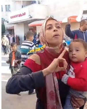
תושבת מתלוננת נגד חמאס (חשבון X של הדא ג'נאת {35 אלף עוקבים}, 7 בדצמבר 2023)

◆ תושבת רצועת עזה מתלוננת על המצב ופונה לעולם בבקשה לשלוח להם סיוע אך מדגישה ודורשת שהסיוע יהיה בידיים נאמנות כי הם (חמאס) לוקחים הכל, משפילים אותם וצוחקים עליהם עד שנותנים להם משהו. לדבריה, היא מחפשת כל היום ומבקשת צדקה מאנשים כדי להביא אוכל לבנה הקטן. נמאס להם מהחיים! היא פונה לאל שיעניש את מי שגרם להם להגיע למצב הזה! (חשבון X של הדא ג'נאת {35 אלף עוקבים}, 7 בדצמבר 2023).