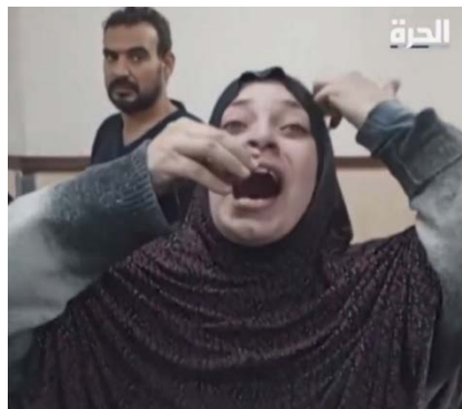
פלסטינית צועקת לסיים את המלחמה בעזה (חשבון X של ערוץ אלחרה, 4 בדצמבר 2023)

◀ פלסטינית אשר שוהה בבית החולים שהדאא' אלאקצא בדיר אלבלח, לאחר שבני משפחתה נפגעו בתקיפת צה"ל, צועקת (לחמאס) בסרטון, שהתפרסם ברשת האמריקאית אלחרה, לסיים את המלחמה ברצועה. לדבריה, מספיק עם ההרס, והם לא רוצים (חילופי) אסירים (חשבון X של ערוץ אלחרה, 4 בדצמבר 2023).