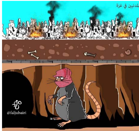
עכברי חמאס מתחבאים במנהרות ואילו האזרחים בעזה נפגעים מתקיפות צה"ל (חשבון X של עיסא אלריס, 23 בנובמבר 2023)

מאורגן שיערער על שלטונה. אולם, נראה שככל שתגבר מצוקת התושבים ותיחלש יכולת השליטה של חמאס, יעזו התושבים להביע יותר את עמדתם הביקורתית כלפי ממשל חמאס ואולי אף לפעול בשטח נגדו.