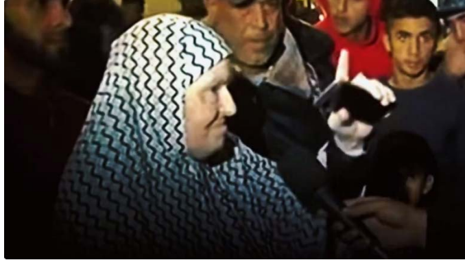
פלסטינית מעזה מאשימה את חמאס בשידור חי עם כתב אלג'זירה בגין גניבת סיוע שנכנס לרצועה (חשבון X של מחמד עמאד, 6 בדצמבר 2023)

◆ כך למשל בשידור ישיר של רשת אלג'זירה מרצועת עזה דיברה פלסטינית נגד חמאס וטענה כי הסיוע שמגיע לרצועה לא מגיע אליהם וכי הכל מגיע "לבתיים שלהם" (של חמאס). הכל יורד למטה (כלומר מתחת לאדמה היכן שהם מתחבאים). היא אמרה לכתב שחמאס ייקחו אותה, יירו בה או שיעשו מה שהם רוצים. לדבריה, העם החל לומר את האמת מול התקשורת (חשבון X של מחמד עמאד, 6 בדצמבר 2023).