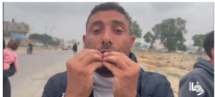
תושבים ומפונים העושים דרכם מח'אן יונס לרפיח מותחים ביקורת על חמאס ועל יחיא אלסנאר

◀ רדיו עלם, תחנת רדיו מחברון, פרסם ראיון עם תושבי רצועת עזה אשר מתחו ביקורת על חמאס והנהגתה. אחד המרואיינים פנה ליחיא אלסנאר בקללות וטען "הרסת אותנו". עוד הצהיר כי "האזרח הפלסטיני מדבר ללא פחד, כי הוא יודע כעת שהמוות נמצא בכל מקום, על מנהיגי חמאס לשים לב לאזרח העזתי, כדי לשמור על מה שנותר מהעם העזתי ולסיים את המלחמה שאין לו שום תועלת ממנה". הוא הביע את קשיי התושבים ברצועת עזה לאחר שעברו מח'אן יונס לרפיח, והדגיש כי להנהגת חמאס לא אכפת. יתרה מכך, מרואיין נוסף פנה ליחיא