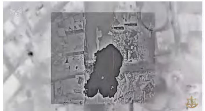
תקיפת מטרות ברצועת עזה (דובר צה"ל, 11 בדצמבר 2023)