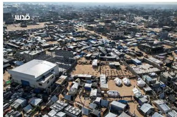
מחנות האוהלים של המפונים ברפיח