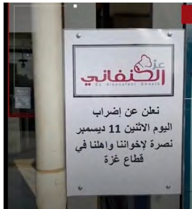
אחד העסקים השובתים: ממתקי אלכנפאני, שעל-פי השם הינו ככל הנראה בבעלות של אזרח פלסטיני (ערוץ אלממלכה הירדני, 11 בדצמבר 2023)

◀ דווח כי עסקים רבים בירדן הכריזו על שביתה במסגרת קמפיין בינלאומי הקורא להפסקת אש מיידית בעזה (ערוץ אלממלכה הירדני, 11 בדצמבר 2023). דווח כי גם בתורכיה נסגרו חלק מהעסקים במסגרת הקמפיין (חשבון X Esralshikh, 11 בדצמבר 2023).