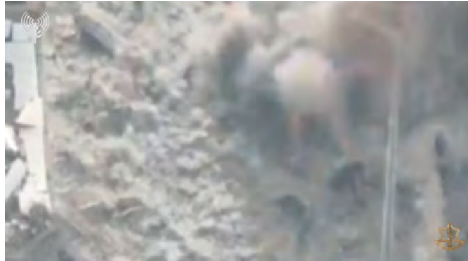
תקיפת המחבלים החמושים בטיילי כתרף (דובר צה"ל, 11 בדצמבר 2023)

כוחות צה"ל מחבלים חמושים בטיילי כתרף. הכוחות הכוונו כלי טיס אשר סיכל את המחבלים מאוויר (דובר צה"ל, 11 בדצמבר 2023).