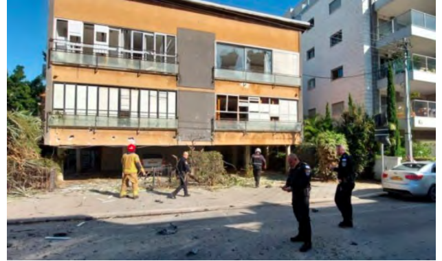
זירת נפילת רקטה בחולון והנזק הכבד שנגרם במקום (דוברות כבאות והצלה, 11 בדצמבר 2023)