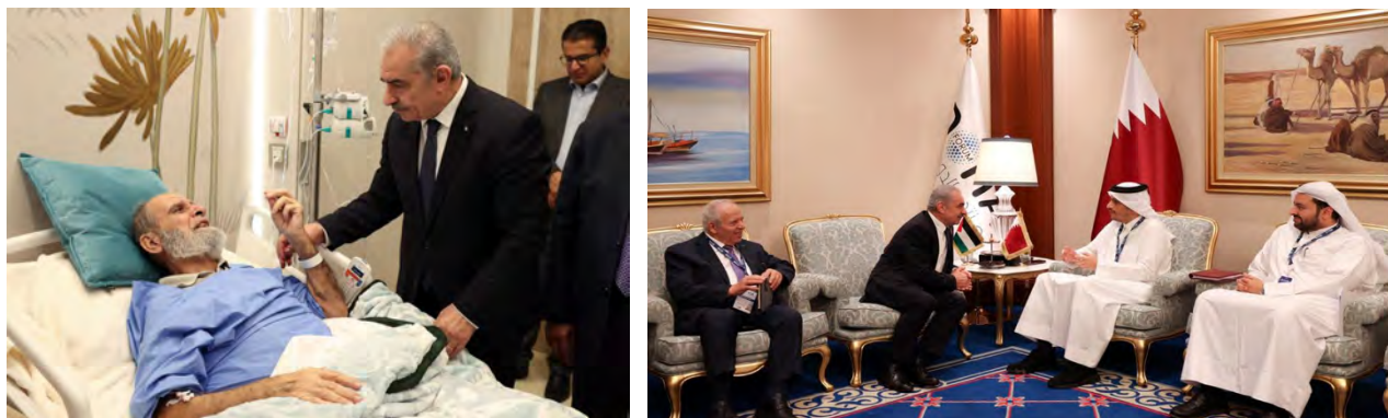
מימין: פגישת אשתיה עם מחמד בן עבד אלרחמן אלת'אני. משמאל: מחמד אשתיה מבקר בדוחה פצועים פלסטינים

◀ מחמד אשתיה, ראש ממשלת הרשות, נפגש בשולי פורום דוחה עם מחמד בן עבד אלרחמן אלת'אני, ראש הממשלה ושר החוץ של קטר. בפגישה הביע אשתיה את הערכתו הרבה לקטר על הסיוע ההומניטארי שהיא מעבירה לרצועת עזה, קרא להפסקת המלחמה ולפעילות בינלאומית למציאת פתרון מדיני ולהקמת מדינה פלסטינית. הוא גם הודה על נכונותה של קטר לקלוט 1,500 פצועים מרצועת עזה ואשפוזם בתי חולים בקטר. במהלך שהותו בקטר ביקר אשתיה פצועים מהרצועה המאושפזים בבתי חולים שם.