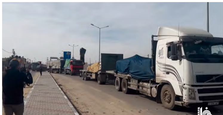
כניסת משאיות סיוע דרך מעבר רפיח (ערוץ היוטיוב של ופא, 10 בדצמבר 2023)

◀ כלי תקשורת פלסטינים דיווחו, כי למרות החרפת המצב ההומניטארי ברצועה מספר משאיות הסיוע הנכנסות דרך מעבר רפיח הוא קטן (ערוץ היוטיוב של ופא, 10 בדצמבר 2023).