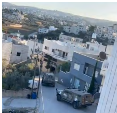
פעילות כוחות צה"ל בבית אולא

◀ בפעילות הכוחות במחנה הפליטים בלאטה בשכם פתחו כוחות וכלי הנדסה של צה"ל צירים מחסימות מאולתרות ומטענים שנועדו לפגוע בכוחות צה"ל. בנוסף, נעצרו שני מבוקשים ונמצאו חלקי נשק ותחמושת (ערוץ הטלגרם של דובר צה"ל, 11 בדצמבר 2023).