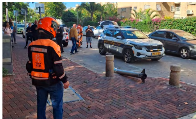
זירה נוספת בחולון בה נפלה רקטה ששוגרה מרצועת עזה (דוברות איחוד הצלה, 11 בדצמבר 2023)