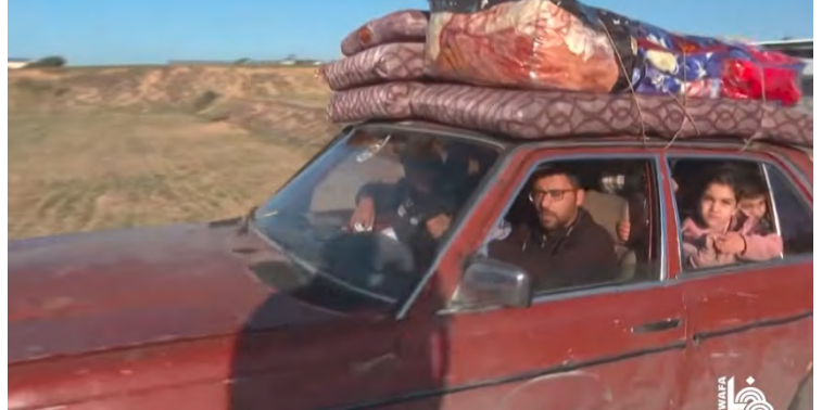
תושבים מאזור ח'אן יונס מתפנים לרפיח (ערוץ היוטיוב של ופא, 10 בדצמבר 2023)