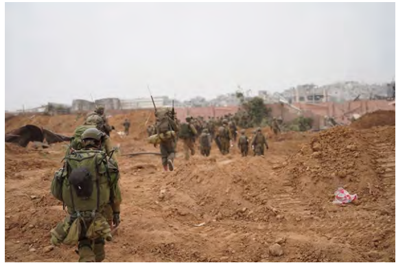
תיעוד פעילות כוחות צה"ל ברצועת עזה (דובר צה"ל, 11 בדצמבר 2023)