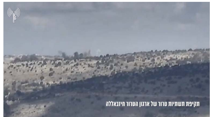
תקיפת מטרות חזבאללה בדרום לבנון (דובר צה"ל, 14 בדצמבר 2023)