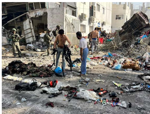
מעצר פעילים במרחב בית החולים כמאל עדואן (דובר צה"ל, 14 בדצמבר 2023)

◀ העיתונאי אנס אלשריף עדכן מג'באליא, כי תקיפות צה"ל וחיל האוויר נמשכו במהלך כל הלילה והבוקר ללא הפסקה. לדבריו, חיל האוויר תקף בשעות הלילה, בין השאר, מתחם מגורים באזור ג'באליא וגם בשעות הבוקר נמשכות פעולות חילוץ הנפגעים מהמתחם. הוא ציין כי נגרם נזק רב למקום (חשבון X של QUDSN, 14 בדצמבר 2023).