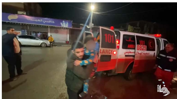
פינוי נפגעים לבית החולים ברפיח בעקבות תקיפת חיל האוויר (ערוץ היוטיוב של ופא, 14 בדצמבר 2023)