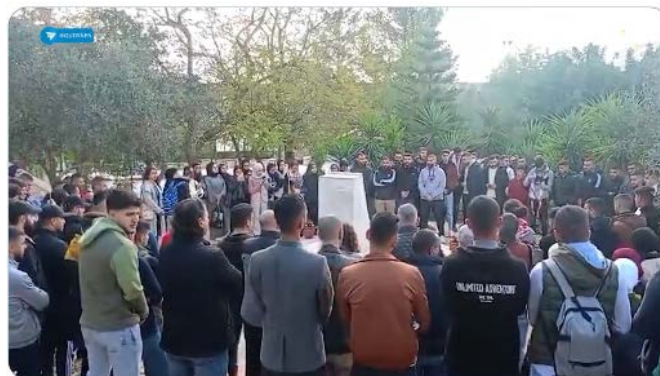
הפעילות באוניברסיטת בירזית (חשבון X של QUDSN, 14 בדצמבר 2023)

◀ באוניברסיטת בירזית נערכה ב-14 בדצמבר בשעות הצהריים פעילות הזדהות עם הפלסטינים ברצועת עזה ובג'נין, ביוזמת מועצת הסטודנטים באוניברסיטה (ערוץ הטלגרם של הגוש האסלאמי באוניברסיטת בירזית, 13 בדצמבר 2023).