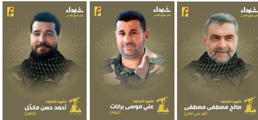
הרוגי חזבאללה (ערוץ הטלגרם של זרוע ההסברה הקרבית של חזבאללה, 13 בדצמבר 2023)