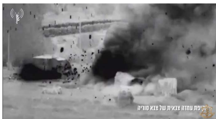
תקיפת עמדת צבא סוריה (דובר צה"ל, 18 בדצמבר 2023)

◀ ב-18 בדצמבר 2023 בסביבות 22:00 זוהו מספר שיגורי רקטות מסוריה לעבר ישראל. הרקטות נפלו בשטחים פתוחים. בתגובה, תקפו כוחות צה"ל באש ארטילריה את מקורות הירי בשטח סוריה. טנקים תקפו עמדה צבאית של צבא סוריה (דובר צה"ל, 18 בדצמבר 2023).