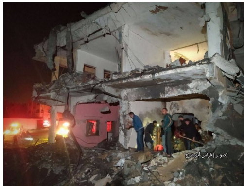
תוצאות תקיפת בית משפחת זערב ברפיח במהלך הלילה (חשבון X של שהאב, 19 בדצמבר 2023)

◀ כלי תקשורת פלסטינים דווחו על 29 הרוגים בתקיפת שלושה מבנים ברפיח. הנפגעים פונו לבית החולים אבו יוסף אלנג'אר ובית החולים הכותי בעיר (אלקדס, ערוץ אלערבי, 19 בדצמבר 2023).