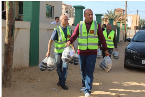
חלוקת מנות אוכל למפונים במתקני המחסה במימון בנק פלסטין (מען, 18 בדצמבר 2023)

בנק פלסטין דיווח, כי ביומיים האחרונים הוא חילק אלפי מנות אוכל למפונים במתקני המחסה ברחבי הרצועה, זאת במטרה להקל מצוקות המפונים ברצועה (מען, 18 בדצמבר 2023).