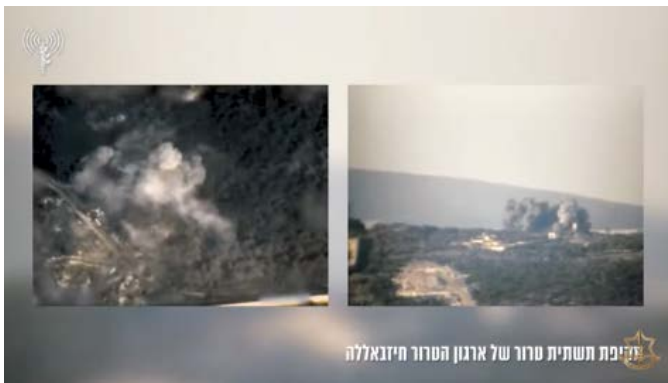
תקיפת תשתיות טרור של חיזבאללה (דובר צה"ל, 18 בדצמבר 2023)