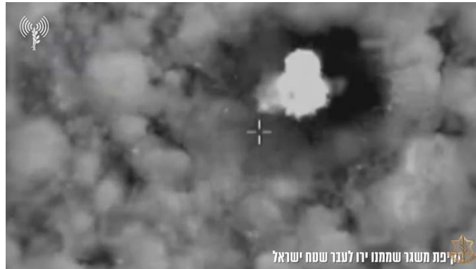
תקיפת משגר ממנה בוצע ירי לעבר ישראל (דובר צה"ל, 18 בדצמבר 2023)

◀ כוחות צה"ל הגיבו בירי ארטילרי לעבר מקורות הירי ובתקיפה מהאוויר של יעדים צבאיים וחוליות של חזבאללה בשטח לבנון (דובר צה"ל, 17 בדצמבר 2023).