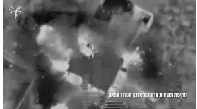
תקיפת מטרות ברצועת עזה (אתר צה"ל, 19 בדצמבר 2023)

◀ פעילות ימית: כוחות זרוע הים תקפו מטרות טרור ברצועת עזה. ביניהן מבנים בהם אותרו פעילי הזרוע הצבאית של חמאס וכלי שיט ששימשו את המחבלים למטרות טרור. במקביל, המשיכו כוחות זרוע הים בתקיפות כסיוע לכוחות הקרקע המתמרנים ברצועה (אתר צה"ל, 19 בדצמבר 2023).