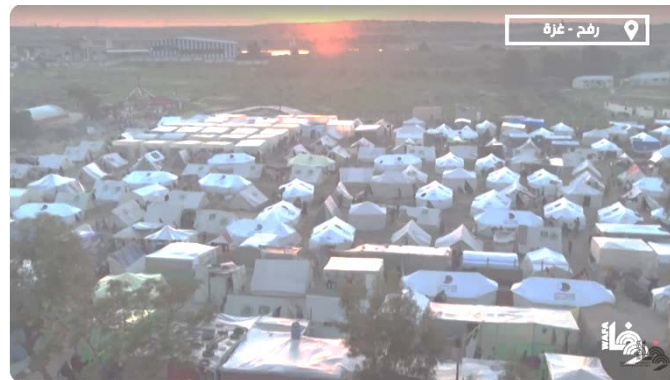
מחנה האוהלים שהוקם במערב רפיח (ערוץ היוטיוב של ופא, 19 בדצמבר 2023)

◀ ערוץ ופא פרסם תיעוד של מחנה אוהלים שהוקם במערב רפיח אשר נועד עבור מפונים מרחבי הרצועה. ניתן לראות כי האוהלים שהוקמו נתרמו ע"י קטר (ערוץ היוטיוב של ופא, 19 בדצמבר 2023).