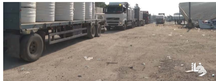
מימין: הכנסת סיוע לרצועה דרך מעבר רפיח. משמאל: הכנסת סיוע לרצועה דרך מעבר כרם שלום (ערוץ היוטיוב של ופא, 18 בדצמבר 2023)