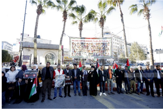
הפעילות מול מטה האו"ם (ופא, 18 בדצמבר 2023)

רשת הארגונים הלא ממשלתיים ערכה הפגנה מול מטה האו"ם בראמאללה בדרישה להפסקת המלחמה בעזה (ופא, 18 בדצמבר 2023).