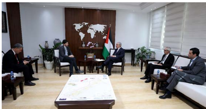
מימין : אשתיה בפגישה השרה הגרמנית. משמאל : פגישה אשתיה עם חברי פרלמנט מאיטליה (ופא, 19 בדצמבר 2023)

◀ מחמד אשתיה, ראש ממשלת הרשות הפלסטינית , נפגש עם השרה הגרמנית לשיתוף פעולה ופיתוח כלכלי, בנוכחות נציג גרמניה ברשות הפלסטינית. במהלך הפגישה אמר אשתיה, כי העדיפות כעת היא להפסיק לאלתר את "התוקפנות הישראלית" ברצועת עזה, ביהודה ושומרון וירושלים, להכניס סיוע רפואי ולשקם את החשמל והמים ברצועה. עוד הוסיף, כי ההרס המסיבי ברצועה והדיבורים על כיבוש מחדש שלה או ניתוק חלקים ממנה והקמת אזורי חיץ, הם חלק מהאסטרטגיה המתמשכת של ממשלת ישראל לחיסול האפשרות להקמת מדינה פלסטינית עצמאית. הוא קרא לגרמניה להכיר במדינת "פלסטין", ובהכרה בה כמדינה חברה מלאה באו"ם (ופא, 19 בדצמבר 2023). קודם לכן, נפגש אשתיה עם חברי פרלמנט מאיטליה והדגיש בפניהם את הצורך בהפסקה מיידית של המלחמה ברצועת עזה, פתיחת המעברים והכנסת סיוע הומניטארי לרצועה (ופא, 19 בדצמבר 2023).