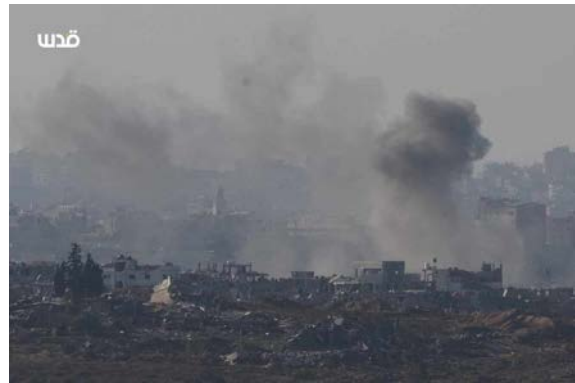
תקיפות צה"ל בצפון הרצועה (חשבון X של QUDSN, 19 בדצמבר 2023)