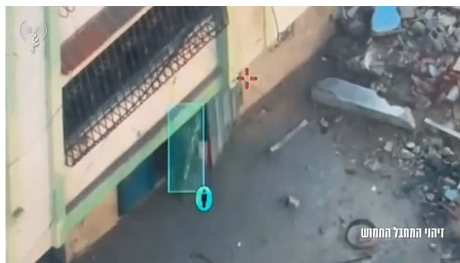
זיהוי המחבל חמוש בח'אן יונס והריגתו על ידי כוחות צה"ל (דובר צה"ל, 20 בדצמבר 2023)