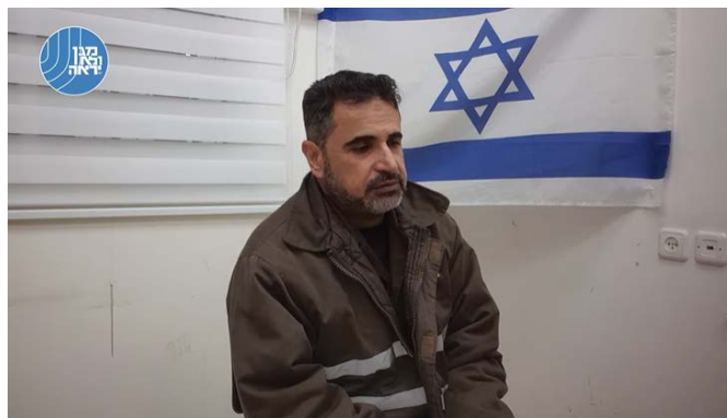
אחמד כחלות (דובר צה"ל, 19 בדצמבר 2023)

◀ העיר עזה: כוחות מיוחדים של צה"ל פעלו בתוך מנהרת טרור גדולה של חמאס שנחשפה בלב העיר עזה (דובר צה"ל, 19 בדצמבר 2023).