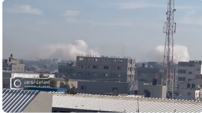
תיעוד הלחימה בין כוחות צה"ל לאנשי ההתנגדות בבני סהילא, במזרח ח'אן יונס