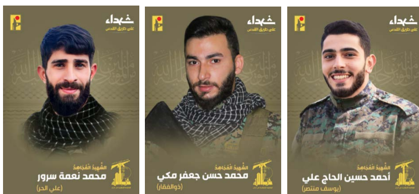
הרוגי חזבאללה (ערוץ הטלגרם של זרוע ההסברה הקרבית של חזבאללה, 19-20 בדצמבר 2023)