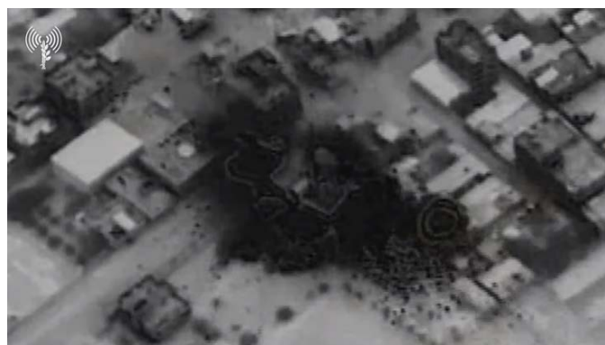
תקיפת מטרת ברצועת עזה (דובר צה"ל, 20 בדצמבר 2023)