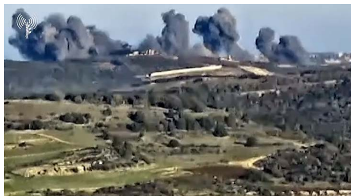
תקיפת מטרת חזבאללה בלבנון (20 בדצמבר 2023)