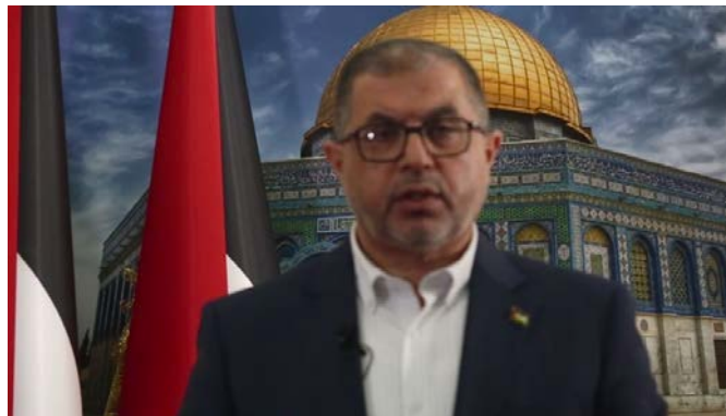
הצהרת באסם נעים (חשבון X של julia m.k., 19 בדצמבר 2023)

עוד ציין שלאור הפגיעה המכוונת בבתי החולים ברחבי רצועת עזה, קוראת חמאס לסוכנויות הבריאות של האו"ם, הצלב האדום הבינלאומי וארגוני זכויות האדם הבינלאומיים לחשוף את "המצב הקטסטרופלי" של בתי החולים וההשלכות החמורות על המצב הבריאותי. לדבריו, על הגופים הבינלאומיים הללו לדרוש הגנה על המתקנים הרפואיים ולקיים נוכחות פיזית בכל בתי החולים ברצועת עזה כדי לתעד את "הפשעים וההפרות הישראליות". לטענתו, הפלסטינים, במיוחד בצפון רצועת עזה, מצויים על סף רעב ובאחריות הקהילה הבינלאומית והאו"ם להפעיל לחץ רציני כדי להבטיח הזרמת מזון, מים ותרופות לעזה (חשבון X של julia m.k., 19 בדצמבר 2023).