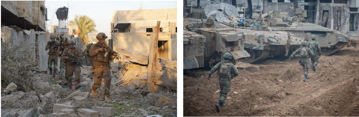
פעילות כוחות צה"ל ברצועת עזה (דובר צה"ל, 20 בדצמבר 2023)

◀ במהלך היממה האחרונה תקפו כוחות צה"ל מעל 300 מטרות ברחבי רצועת עזה. כוחות צה"ל המשיכו לנהל קרבות פנים אל פנים מול מחבלים, להכווין כלי טיס לעבר חוליות חמושות ואמצעי לחימה, זאת לצד תקיפות חיל האוויר וכוחות זרוע הים, בהן נהרגו עשרות מחבלים והושמדו תשתיות טרור (דובר צה"ל, 20 בדצמבר 2023).