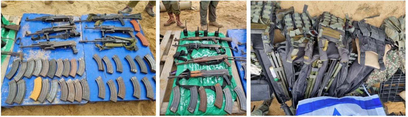
חלק מאמצעי הלחימה שאותרו (דובר צה"ל, 19 בדצמבר 2023)