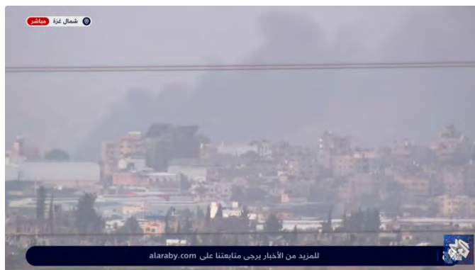
עשן מיתמר באזור ג'באליא העיר (ערוץ היוטיוב של אלערבי, 24 בדצמבר 2023)

◀ ערוץ אלע'ד דיווח על חילופי אש בין כוחות צה"ל לאנשי "ההתנגדות" בג'באליא העיר ועל ירי מאסיבי של כוחות צה"ל לעבר שכונת מזרח העיר עזה, אלתפאח ואלזיתון (ערוץ אלע'ד, 24 בדצמבר 2023). כתב ערוץ אלערבי בצפון הרצועה דיווח גם הוא הבוקר על חילופי אש עזים בין כוחות צה"ל לאנשי ההתנגדות באזור ג'באליא העיר. לדבריו, תושבים רבים לא התפנו מהאזור ונשארו בבתיהם למרות הלחימה במקום (ערוץ היוטיוב של אלערבי, 24 בדצמבר 2023).