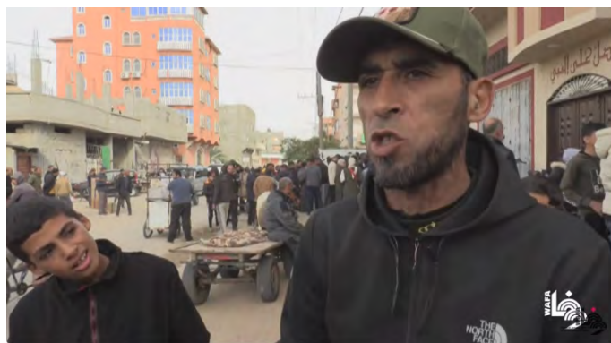
תושבים ברפיח מביעים מורת רוח מהחלטת מועצת הביטחון של האו"ם (ערוץ היוטיוב של ופא, 23 בדצמבר 2023)

◀ תושבים מפונים השוהים ברפיח הגיבו להחלטת מועצת הביטחון של האו"ם בדבר הגדלת הסיוע לרצועה בציינם, כי הם לא מבקשים סיוע ואוכל אלא הם רוצים הפסקת אש מלאה ולשוב לבתיהם. לטענתם, החלטה זו היא לטובת ישראל כדי שזו תמשיך במלחמה ברצועת עזה במשך עוד שנה או שנתיים (ערוץ היוטיוב של ופא, 23 בדצמבר 2023).