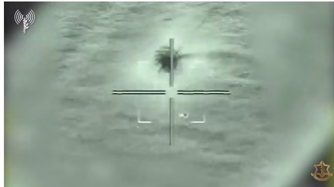
יורט כלי טיס הבלתי מאויש בים התיכון (דובר צה"ל, 22 בדצמבר 2023)

היא שדה הגז כריש ((אלג'זירה, 22 בדצמבר 2023). בהקשר זה יצוין כי דובר צה"ל מסר כי לפני מספר ימים יורט כלי טיס בלתי מאויש מעל הים התיכון (דובר צה"ל, 22 בדצמבר 2023).