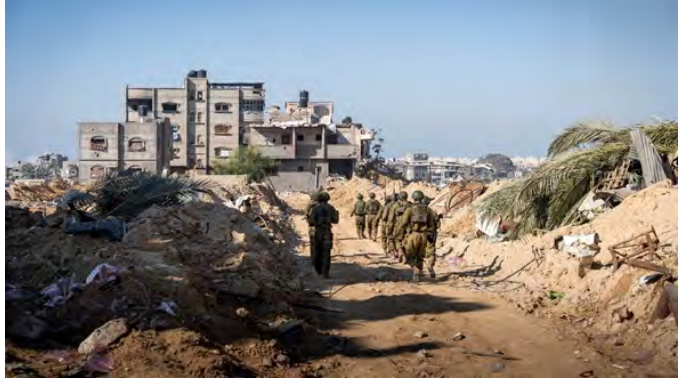
פעילות כוחות צה"ל בח'אן יונס (22 בדצמבר 2023)