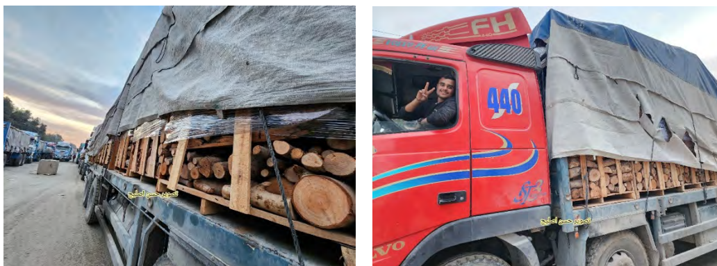
הכנסת גזמי עץ לרצועה דרך מעבר כרם שלום (חשבון X של חסן אצליח, 22 בדצמבר 2023)

שב והדגיש את תפקיד האו"ם להגן על בתי הספר והמוסדות שבהם הפלסטינים מוצאים מחסה, ואמר כי ישראל מבצעת הוצאות להורג בשטח, שהאחרונה שבהן אירעה למשפחת ענאן בעיר עזה (PALINFO, 23 בדצמבר 2023; אתר ערוץ אלג'זירה, 23 בדצמבר 2023).