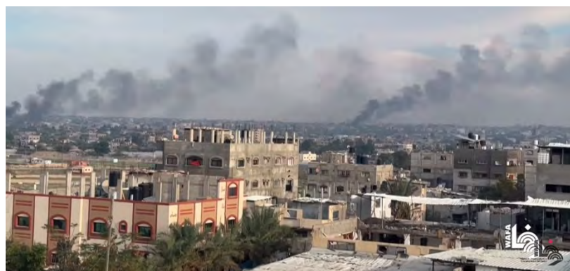
מימין: תקיפות צה"ל באזור ח'אן יונס (ערוץ היוטיוב של ופא, 23 בדצמבר 2023). משמאל: הסבר על הלחימה במזרח ח'אן יונס (ערוץ היוטיוב של אלערבי, 24 בדצמבר 2023)