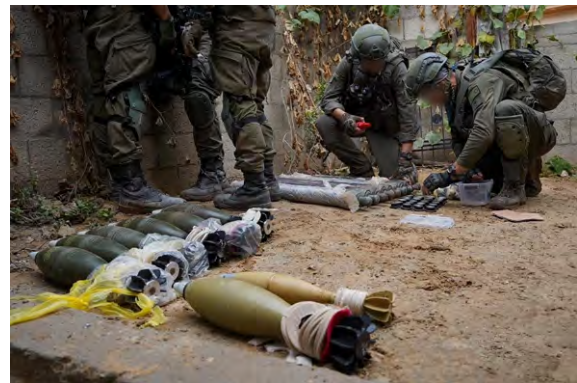
אמצעי לחימה שאותרו בפעילות הכוחות בח'אן יונס (דובר צה"ל, 22 בדצמבר 2023)