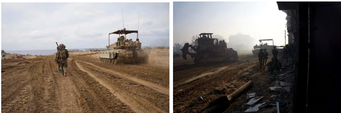
תיעוד פעילות כוחות צה"ל ברצועת עזה (דובר צה"ל, 24 בדצמבר 2023)