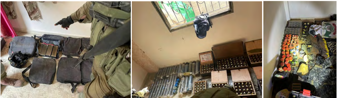
אמצעי לחימה שאותרו בפעילות כוחות צה"ל ברחבי רצועת עזה (דובר צה"ל, 24 בדצמבר 2023)

◀ במהלך סוף השבוע המשיכו הכוחות הלוחמים לנהל קרבות עזים נגד מחבלים, להשמיד תשתיות טרור ולאתר אמצעי לחימה רבים בצפון, מרכז ודרום הרצועה. במהלך הלחימה נעצרו השבוע מאות חשודים במעורבות בפעילות טרור ברצועת עזה, יותר מ-200 מהם פעילי חמאס והג'האד האסלאמי בפלסטין, אשר הועברו להמשך חקירה בשטח ישראל. יצוין שמתחילת המלחמה נלקחו לחקירה יותר מ-700 פעילים מארגוני הטרור. על פי הערכות צה"ל מאז תחילת המלחמה נהרגו כ-8,000 חמושים פלסטינים (דובר צה"ל, 23 בדצמבר 2023).