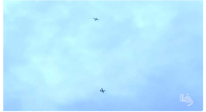
מימין: כלי טיס של חיל האוויר חגים הבוקר בשמי ח'אן יונס. משמאל: תקיפות צה"ל בח'אן יונס (ערוץ היוטיוב של ופא, 2 בינואר 2024)