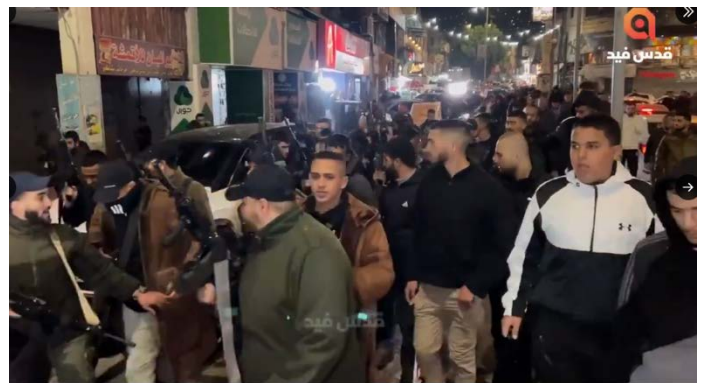
תהלוכה ומפגן צבאי שאירגן "גדוד ג'נין" לתמיכה בהתנגדות ברצועת עזה (חשבון X של @Khalounnaji, 1 בינואר 2024)