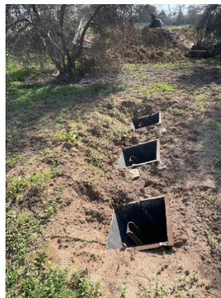
משגרי הרקטות שאותרו בסמוך לבית ספר של אונר"א (חשבון X של דובר צה"ל, 2 בינואר 2024)