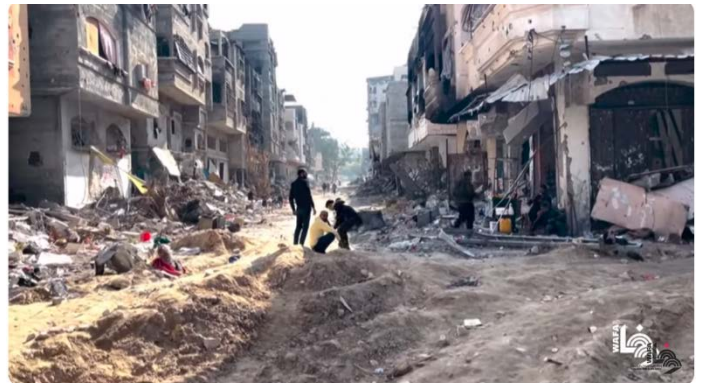
תיעוד ההרס בצפון הרצועה. בית לאהיא (מימין) וג'באליא (משמאל)