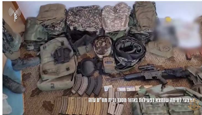
אמצעי לחימה שאותרו באזור המסגד (דובר צה"ל, 2 בינואר 2024)