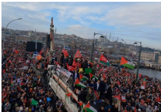
הפגנת התמיכה ההמונית בפלסטינים באיסטנבול (אנטוליה, 1 בינואר 2024)

◀ התובע הכללי בתורכיה הודיע כי הוצאו צווי מעצר ל-46 חשודים בפעילות המוסד הישראלי "נגד גורמים זרים בתורכיה". דווח כי הרשויות בתורכיה עצרו 33 בני אדם החשודים בריגול לטובת המוסד וכי המשטרה פשטה במקביל על 57 מוקדים בשמונה מחוזות שונים בתורכיה. נמסר שההערכה בתורכיה היא כי מטרת החשודים הייתה לזהות, לעקוב, לחטוף ולהתנקש בזרים הנמצאים בתורכיה (Daily Sabah, 2 בינואר 2023). ◀ ב-1 בינואר 2024 נערכה הפגנת תמיכה המונית בפלסטינים באיסטנבול (אנטוליה, 1 בינואר 2024).