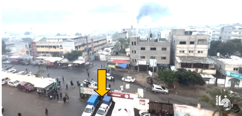
כלי רכב של משטרת חמאס בכניסה הראשית לבית החולים נאצר