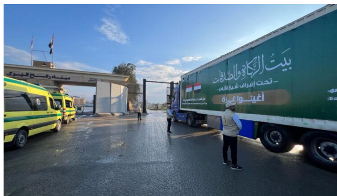
כניסת משאית סיוע לרצועת עזה מטעם בית הזכאה המצרי דרך מעבר רפיח (ערוץ אלע'ד, 2 בינואר 2024)