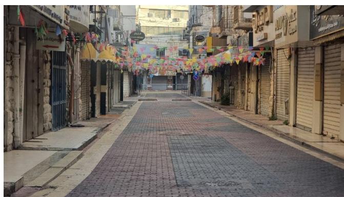
מימין: שביתה כללית בשכם. משמאל: שביתה כללית בראמאללה