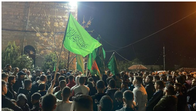
מימין: ההתקהלות מול בית משפחתו של צאלח אלעארורי בכפר עארורה (חשבון X של אתר אלקסטל, 2 בינואר 2024). משמאל: התהלוכה בכפר (ערוץ הטלגרם של הטלוויזיה הפלסטינית, 2 בינואר 2024)