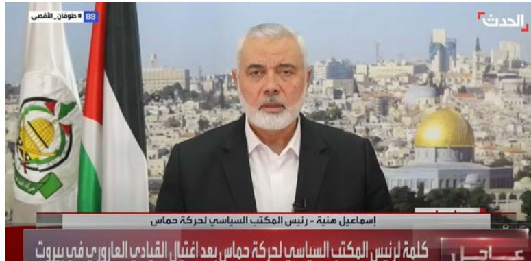
אסמאעיל הניה מנחה את מועצתו של אלעארורי (אלחדת', 2 בינואר 2024)

הפטריוטי הגדול, לוחם הג'האד" וציין כי ביצוע ההתנקשות על אדמת לבנון היא פעולת טרור במלוא מובן המילה והפרה של ריבונות לבנון. כמו כן לדבריו, מהווה הפעולה הרחבה של העוינות כלפי העם הפלסטיני והאומה האסלאמית וכי ישראל ("הכיבוש הציוני") תישא באחריות על הפעולה וההתנגדות הפלסטינית לכיבוש לא תיפסק אלא תימשך ביתר שאת (אלחדת', 2 בינואר 2024).