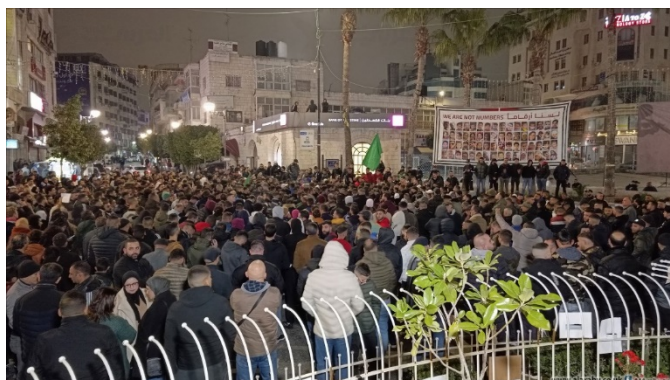
מימין: תהלוכה ברמאללה (אלערבי אלג'דיד, 2 בינואר 2024). משמאל: תהלוכה במחנה הפליטים ג'נין (חשבון X של צפא, 2 בינואר 2024)