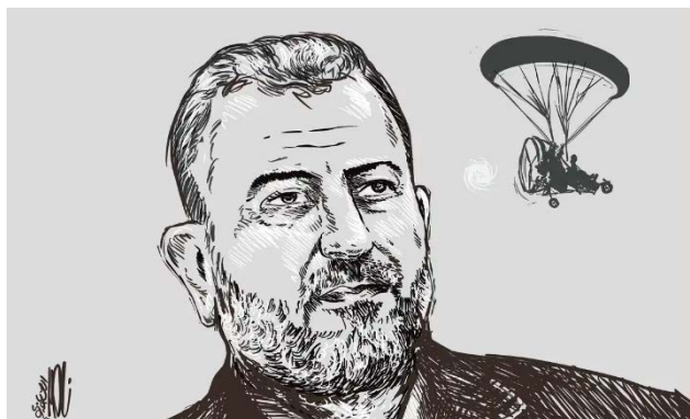
תמונה לזכרו של אלעארורי (העיתון המזרח ירושלמי אלקדס, 3 בינואר 2024)

◀ הפגנות ושבתה כללית ברחבי יהודה ושומרון: ברחבי יהודה ושומרון התקיימו ב-2 בינואר 2024 בשעות הערב והלילה תהלוכות זעם. צעירים התאספו מול ביתו של אלעארורי במקום הולדתו בכפר עארורה, והשמיעו קריאות בגנות הריגתו לצד קריאות להגיב על מותו. במחנה הפליטים ג'נין נערכה תהלוכה, ובמחנה אלערוב מצפון לחברון התגלעו עימותים בעקבות תהלוכה שהגיעה לכניסה למחנה (אלערבי אלג'דיד, 2 בינואר 2024; ופא, 2 בינואר 2024; ערוץ ה-YOUTUBE של ערוץ אלג'זירה, 3 בינואר 2024).