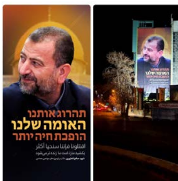
שלטי חוצות המנציחים את אלעארורי במרכז טהראן (רשת קדס, 3 בינואר 2024)

◀ במרכז טהראן נתלה שלט חוצות מטעם המשטר האיראני המנציח את אלעארורי. בשלט הופיע הכיתוב בעברית (ומתחת באותיות קטנות בערבית): "תהרוג אותנו – האומה שלנו הופכת חיה יותר", המאדיר את "מות הקדושים" למען האסלאם ונועד להעביר מסר לישראל כי "ההתנגדות" תמשך למרות הפגיעה בראשיה (רשת קדס, 3 בינואר 2024).