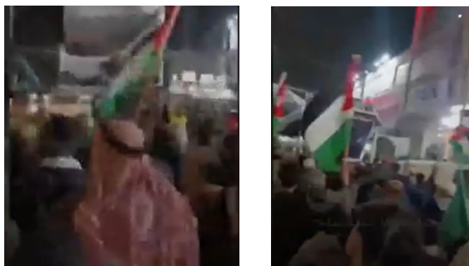
הפגנת התמיכה בחמאס ובאלעארורי באלזרקאא' בירדן (אלפג'ר, 2 בינואר 2024)

◀ בירדן נערכה הפגנת תמיכה באלזרקאא', תוך התייחסות לאלעארורי כאל "חלל קדוש" (שהיד) השמעת דברי נאצה נגד ישראל והנפת דגלי חמאס והדגל הפלסטיני (אלפג'ר, 2 בינואר 2024).