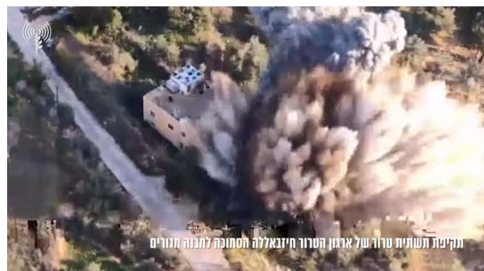
תקיפת יעדי חזבאללה