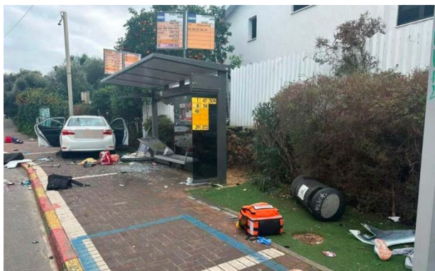
אחת מזירות הפיגוע ברעננה (איחוד הצלה, 15 בינואר 2024)