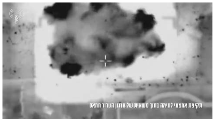
תקיפות בח'אן יונס. מימין: תקיפת משאית ובה אמצעי הלחימה. משמאל: תקיפת חוליית מחבלים