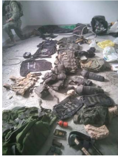
מימין: אמצעי לחימה שאותרו באזור ח'אן יונס. משמאל: אמצעי לחימה שאותרו בארון ילדים (דובר צה"ל, 15 בינואר 2024)