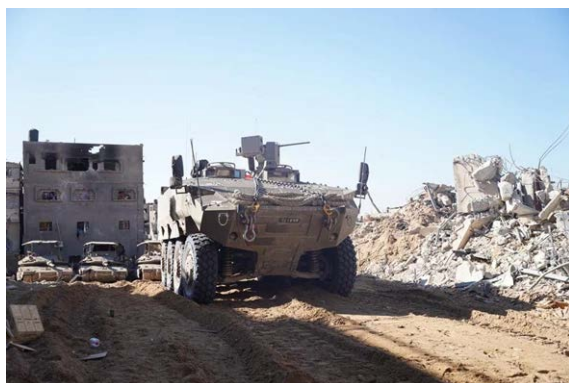
תיעוד פעילות כוחות צה"ל באזור ח'אן יונס (דובר צה"ל, 14 בינואר 2024)