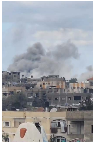
תקיפת צה"ל בבית לאהיא (חשבון X של QUDSN, 14 בינואר 2024)

◀ דרום הרצועה: כוחות צה"ל הרחיבו את פעילותם באזור ח'אן יונס וביצעו פשיטות ממוקדות ברחבי העיר. במהלך הפעילות איתרו הלוחמים אמצעי לחימה רבים, מצבור של פצצות מרגמה ומדים של כוחות נח'בה. בפשיטה שביצעו הכוחות על מפקדה מבצעית של חמאס הוחרם בין השאר ציוד צלילה שהיה שייך לכוח הימי של חמאס. כמו כן השמידו הכוחות שני מחסני אמצעי לחימה ותקפו מבנים צבאיים (דובר צה"ל, 14, 15 בינואר 2024).