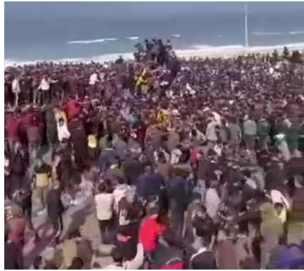
תושבים בעזה בוזזים משאית סיוע סמוך לכביש חוף הים