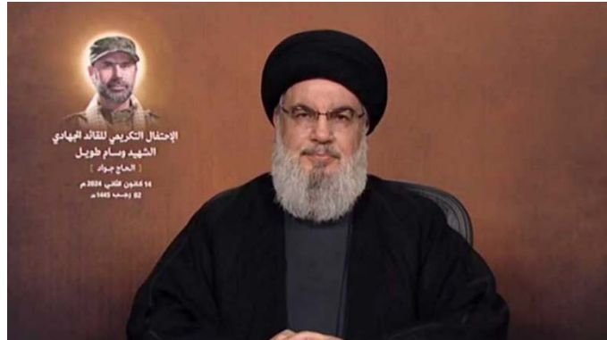
חסן נצראללה נואם (14 בינואר 2024)

◆ מעורבות ארה"ב: ארה"ב איימה עליהם, שאם לא יעצרו, ישראל תפתח במלחמה נגדם, אלה איומי סרק וההפחדה שלהם לא תועיל. הם מוכנים למלחמה כבר 99 יום, והם יילחמו ללא גבול. על האמריקנים לחשוש לכלי השייט שלהם באזור ולשלום בסיסיהם.