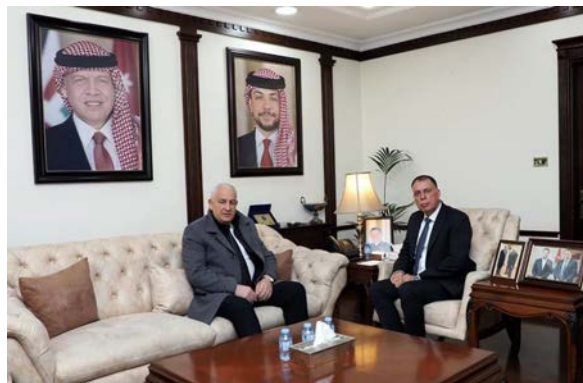
שר הפנים הפלסטיני נפגש בעמאן עם מקבילו הירדני (ופא, 14 בינואר 2024)

◀ זיאד הב אלריח, שר הפנים ברשות הפלסטינית , נועד בעמאן עם מאזן אלפראיה, שר הפנים הירדני , וזן עימו בדרכי שיתוף הפעולה והתיאום בין שני המשרדים. הב אלריח שיבח את תמיכת ירדן בעם הפלסטיני ואת מאמציה לעצור את התוקפנות נגדם ברצועת עזה וביהודה ושומרון. אלפראיה הדגיש את המחויבות הקבועה של ירדן להגיע להפסקת אש ולדחות את עיקרון העקירה. הב אלריח גם נועד ברמאללה עם גיל מישו, סמזכ"ל לענייני שלום וביטחון באו"ם , והדגיש בפניו את הצורך לחזק את שיתוף הפעולה בין הגופים הרשמיים כדי להבטיח כניסת סיוע הומניטרי בסיסי ודלק לרצועה. מישו הביע את דאגתו מהמצב ברצועת עזה וביהודה ושומרון וציין כי האו"ם פועל להשגת הפסקת אש ולאספקת סיוע המוניטרי לרצועה (ופא, 14 בינואר 2024).