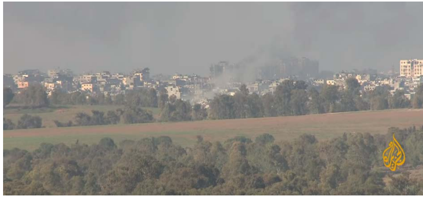
תקיפות צה"ל במחנה הפליטים אלברגי' (ערץ היוטיוב של אלג'זירה, 15 בינואר 2024)