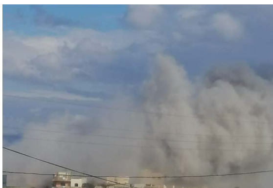
מימין: תקיפה אווירית בעיתרון או מיס אלג'בל. משמאל: תקיפה אווירית באזור אללבונה (חשבון X של עלי שעיב, 14 בינואר 2024)