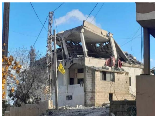
מבנה הרוס חלקית כתוצאה מתקיפת חיל האוויר בעיתרון