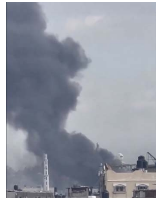
מימין: תקיפות צה"ל בח'אן יונס (חשבון X של QUDSN, 14 בינואר 2024). משמאל: עשן מיתמר מאזור הלחימה בשכונות קיזאן אלנג'אר ובטן אלסמין (חשבון X של שהאב, 14 בינואר 2024)