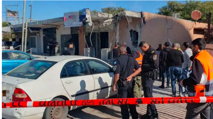
פגיעה ישירה של רקטה בחנות מוצרי חשמל בנתיבות (דוברות המשטרה, 16 בינואר 2024)

◀ ב-16 בינואר 2024 שוגר מטח של כעשרים רקטות לעבר נתיבות. רוב השיגורים יורטו. אחת הרקטות פגעה בחנות, כמו כן אותרה נפילה במושב סמוך. הירי בוצע מאזור אלבוריג' ונציראת, שבמרכז הרצועה. הזרוע הצבאית של חמאס הודיעה, כי פעיליה שיגרו מטח רקטות לעבר נתיבות (ערוץ הטלגרם של צפא, 16 בינואר 2024).