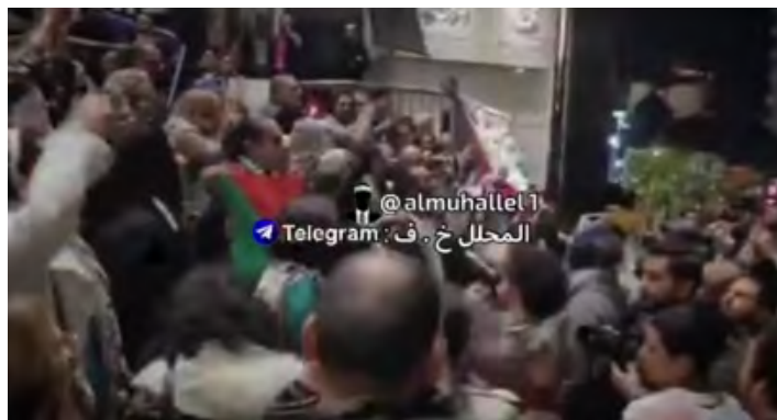
ההפגנה בקהיר (ערוץ הטלגרם מחלל ח' פ, 15 בינואר 2024)

◀ ב-15 בינואר 2024 התקיימו הפגנות בקהיר נגד ממשלת מצרים בדרישה לפתיחת מעבר רפיח והסרת המצור על רצועת עזה. המפגינים קראו: "ככל שהדם הערבי זול, כך ייפול כל נשיא" (ערוץ הטלגרם מחלל ח' פ, 15 בינואר 2024).