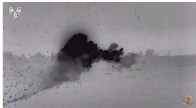
תקיפת תשתית מבצעית של חזבאללה באזור מארון אלראס (דובר צה"ל, 15 בינואר 2024)