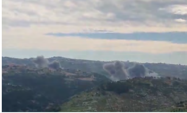
תקיפה באזור ואדי אלסלוקי (חשבון X של עלי שעיב, 16 בינואר 2024)