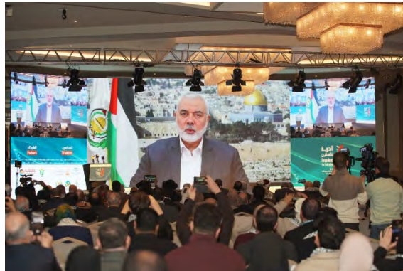
נאום הניה בוועידה באיסטנבול (אתר מוסד אלקדס הבינלאומי, 14 בינואר 2024)

הציונית, שכבשה את אדמתם וגרמה לעקירת הפלסטינים. לדבריו, הציונות היא אחת התנועות המסוכנות ביותר שידעה האנושות, שכן יש לה מאפיינים שלא קיימים באף תנועה אחרת לאורך ההיסטוריה. ◀ הניה קרא לפעול במספר נתיבים: השתתפות במערכה באמצעות התנגדות כוללת וישירה נגד ישראל; הוקעה והפלה של התנועה הציונית בכל הפורומים ובתי המשפט הבינלאומיים; ושבירה של המצור על רצועת עזה והקמת קואליציה הומניטרית לסיוע לפלסטינים ברצועת עזה (סוכנות אנטוליה, 14 בינואר 2024; ערוץ הטלגרם של חמאס ביהודה ושומרון, 14 בינואר 2024).