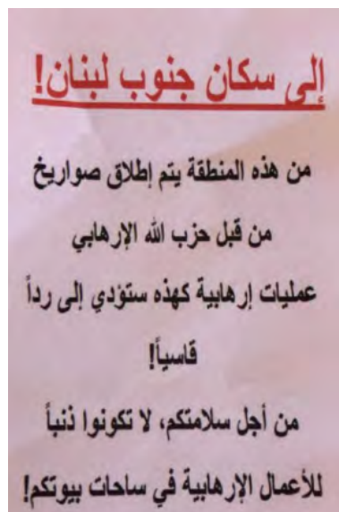
נוסח הכרוז (ערוץ הטלגרם הואנא לבנאן, 16 בינואר 2024)

◀ דווח שבאזור כפרכלא פוזרו כרוזים בזו הלשון: "אל תושבי דרום לבנון! חזבאללה משגר רקטות מאזור זה. פעולות טרור מסוג זה תובלנה לתגובה קשה! למען ביטחונכם, אל תהיו אשמים בפעולות טרור בחצרות של בתיכם!" (ערוץ הטלגרם הואנא לבנאן, 16 בינואר 2024).