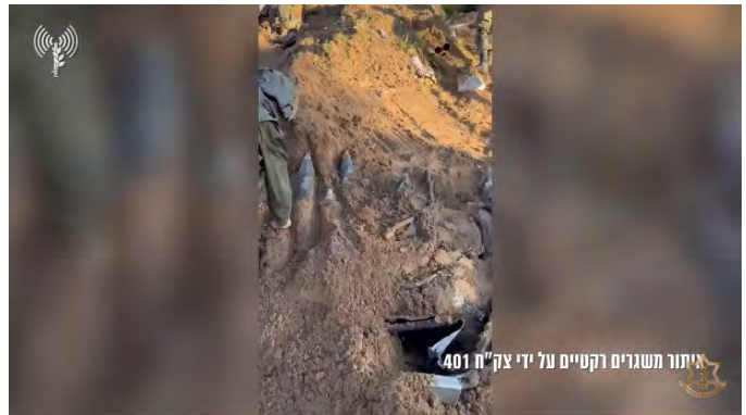
איתור משגרי רקטות באזור בית לאהיא (דובר צה"ל, 16 בינואר 2024)