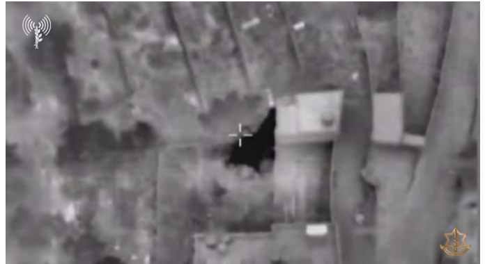
תקיפות חיל האוויר. מימין: תקיפת משגר הנ"ט (דובר צה"ל, 16 בינואר 2024)