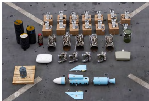
אמצעי הלחימה שנתפסו: חלקי טילים בליסטיים וטילי שיוט (חשבון X של פיקוד מרכז של צבא ארצות-הברית, 16 בינואר 2024)