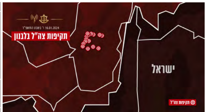
מימין: מפת התקיפות האוויריות נגד מטרות בואדי אלסלוקי. משמאל: הגדלה של אזור המטרות שהותקפו (דובר צה"ל, 16 בינואר 2024)