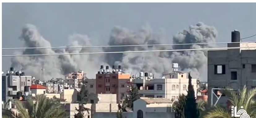
תקיפות צה"ל במחנה הפליטים אלמע'אזי ואלמצדר (ערוץ היוטיוב של ופא, 15 בינואר 2024)