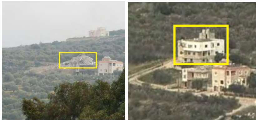
מימין: מבנה בן שלוש קומות בכפרכלא טרם תקיפתו. משמאל: המבנה הרוס כתוצאה מהתקיפה (חשבון X של Fouad Khreiss, 15 בינואר 2024)

◀ פורסמו תמונות, שתיעדו פגיעות בכפרכלא ביניהם פגיעה במבנה בן שלוש קומות, שנהרס. צוין, כי הבניין היה ריק מיושביו מאז תחילת המלחמה (חשבון X של Fouad Khreiss, 15 בינואר 2024).