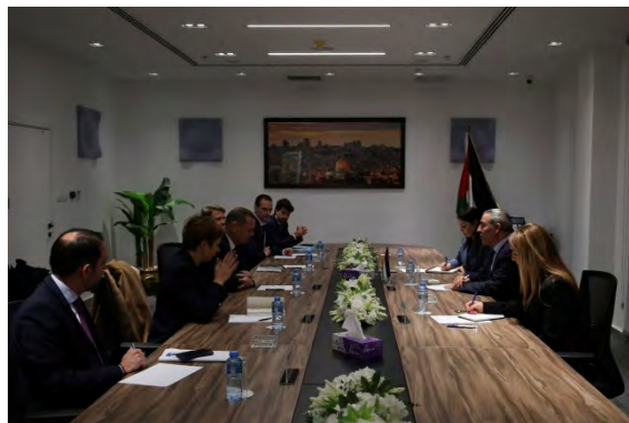
חסין אלשיח' נפגש עם משלחת צרפתית (חשבון X של חסין אלשיח', 15 בינואר 2024)

◀ חסין אלשיח', מזכיר הוועד הפועל של אש"פ , נפגש עם משלחת מצרפת בראשות עמנואל בון היועץ הדיפלומטי של נשיא צרפת. בפגישה דנו הצדדים במצב בזירה הפלסטינית, המלחמה ברצועת עזה, ובדרכים להגיע להפסקת אש מלאה ברצועה (חשבון X של חסין אלשיח', 15 בינואר 2024).