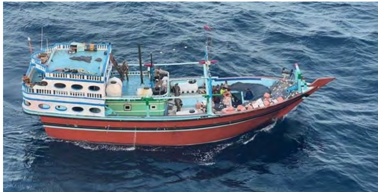
הספינה שעליה השתלט חיל הים (חשבון X של פיקוד מרכז של צבא ארצות-הברית, 16 בינואר 2024)