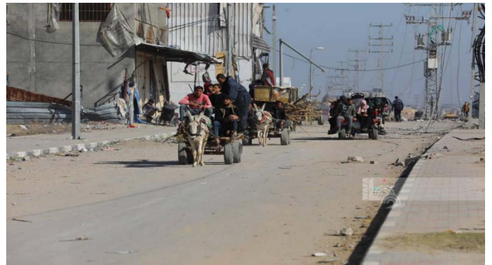
תושבים חוזרים לבתיהם באזור אלמע'אזי ואלזואידה ((ופא, 20 בינואר 2024)

◀ רשת סקיי ניוז בערבית דיווחה מפי "גורם פלסטיני" כי הרשות מוכנה לשלוט על הרצועה בתנאי שהיא תעבור שיקום. לדבריו, הרשות לא מתנגדת לנוכחותו של גוף ערבי ובינלאומי שיפקח על שיקום הרצועה. הגורם גם מסר כי מתקיים תיאום פלסטיני-מצרי-ישראלי בנוגע להסדרת פעילות המעברים ברצועה בעתיד וכי הם משוחחים על פתיחת מעבר כרם שלום למעבר בני אדם וסחורות ועל סגירת מעבר רפיח (רשת סקיי ניוז בערבית, 19 בינואר 2024).