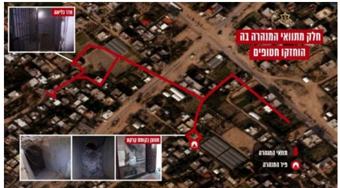
מימין: חלק מתוואי המנהרה בה הוחזקו חטופים. משמאל: מטבח שאותר במנהרה (21 בינואר 2024)