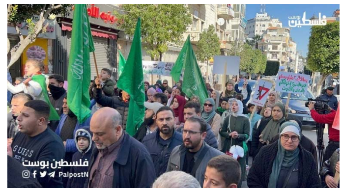
התהלוכה בראמאללה (ערוץ הטלגרם של "פלסטין פוסט", 19 בינואר 2024)