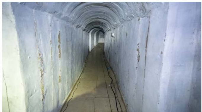
תיעוד המנהרה והכלובים שנמצאו בה (דובר צה"ל, 21 בינואר 2024)