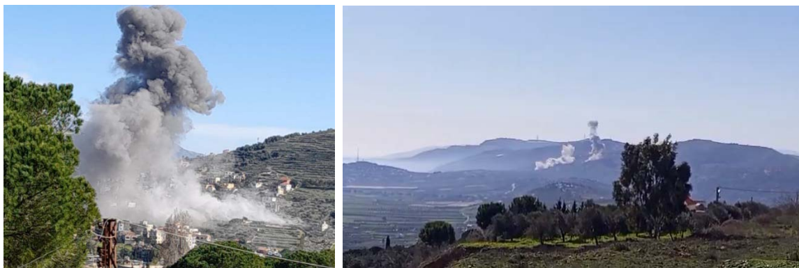
תיעוד תקיפות חיל האוויר באלעדיסה