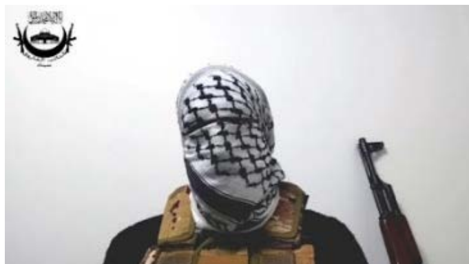
מתוך הסרטון של גדודי אלפארוק (ערוץ הטלגרם של גדוד אלפארוק, 20 בינואר 2024)

דובר מטעם גדוד אלפארוק, שהכריז על הקמתו בחצי האי סיני ב-17 בינואר 2024, ציין בסרטון חדש שפורסם, כי פעילי הארגון ביצעו סדרת פיגועים נגד חיילי צה"ל וגרמו למותם ופציעתם של רבים מהם. הוא ציין שהארגון ימשיך לתקוף את ישראל וקרא לכל האומות הערביות והמוסלמיות לנצל את המצב ולקחת חלק במלחמה כדי "לחסל את הכיבוש" ולפגוע במיוחד בקצינים בצבא מצרים וירדן. הוא גם ציין כי המלחמה האחרונה הבהירה לעולם את חולשת צה"ל וכי מאז 1967 ישראל לא ניצחה בשום מלחמה ולכן יש לנצל את המצב כעת כדי להכשיל את תכנון ישראל לפלוש למדינות נוספות באזור. הוא מסר שאנשי הארגון יילחמו יחד עם כל פעיל ערבי נגד ישראל (ערוץ הטלגרם של גדוד אלפארוק, 20 בינואר 2024).