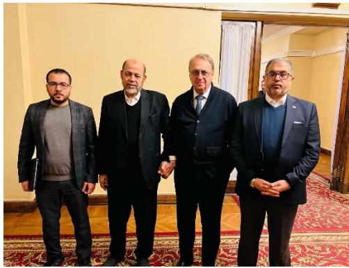
משלחת חמאס עם בוגדנוב (PALINFO, 19 בינואר 2024)

◀ משלחת הנהגת חמאס בראשות מוסא אבו מרזוק יו"ר המשרד לקשרים בינלאומיים, באסם נעים, חבר הלשכה המדינית של חמאס ברצועה , ביקרה ברוסיה. חברי המשלחת נועדו עם מיכאיל בוגדנוב, סגן שר החוץ הרוסי והשליח המיוחד של נשיא רוסיה למזרח התיכון . שני הצדדים ערכו התייעצויות מדיניות לגבי הדרכים להגיע להפסקת אש, והבהרת עמדת חמאס ומדיניותה בכל הנוגע לסוגיית החטופים. חברי המשלחת הביעו את הערכתם כלפי הסיוע ההומניטרי של רוסיה וכלפי מאמצייה הדיפלומטיים שהיא משקיעה. בוגדנוב הביע את עמדת רוסיה התומכת בזכויות העם הפלסטיני ואת מאמצייה מול הגורמים הרלוונטיים להגיע להפסקת אש (אתר ספוטניק בערבית, 19 בינואר 2024). משרד החוץ הרוסי מסר כי הם הדגישו בפגישה את הצורך לשחרר במהירות את האזרחים שנתפסו במתקפת ה-7 באוקטובר 2023, ביניהם שלושה אזרחים רוסים (ערוץ הטלגרם של משרד החוץ הרוסי, 19 בינואר 2024).