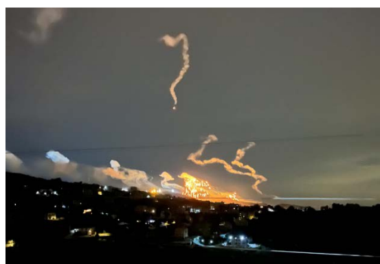
תיעוד ירי ארטילרי בחולא (21 בינואר 2024)