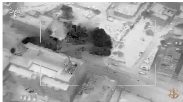
הריסת בתי המחבלים (דובר צה"ל, 21 בינואר 2024)