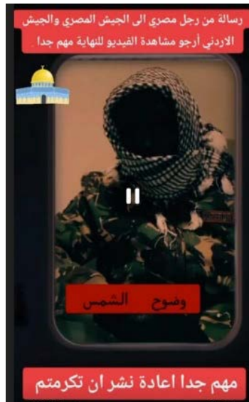
רעול הפנים קורא להצטרף ללחימה למען רצועת עזה (טלגרם, 21 בינואר 2024)