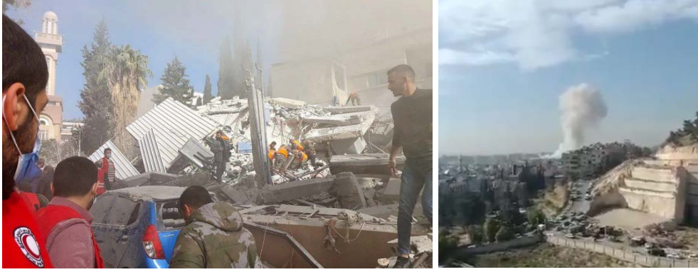
מימין: ענן עשן מתמר מאזור התקיפה. משמאל: הריסות המבנה שהותקף