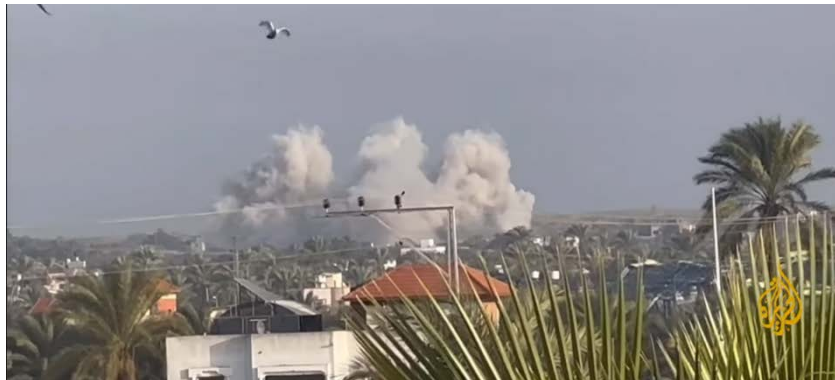
תיעוד הפיצוץ בו נהרגו 21 לוחמי צה"ל

◀ מרכז הרצועה: בתקרית קשה שארעה ב-22 בינואר 2024 בשעות אחר הצהריים נהרגו 21 לוחמי צה"ל. התקרית ארעה כאשר כוחות צה"ל פעלו במרחב אשר חוצץ בין היישובים הישראליים לרצועת עזה, סמוך לכיסופים. הכוחות הסירו מבנים ותשתיות טרור במרחב, ליצירת התנאים הביטחוניים לחזרת תושבי הדרום לבתיהם. מתחקור ראשוני של האירוע עלה, כי ככל הנראה שוגר טיל RPG על ידי מחבלים לעבר טנק שאבטח את הכוח. טיל RPG נוסף נורה לעבר מבנה בו פעלו כוחות צה"ל שהיו לקראת השלמת מלכוד המבנה לפני פיצוץ. כתוצאה מהירי, אירע פיצוץ של שני מבנים דו-קומתיים, שקרסו, בעת שמרבית הכוח נמצא בתוכם ובסמוך אליהם. במהלך כל שעות הלילה התקיימה פעילות לאיתור וחילוץ הנפגעים (דובר צה"ל, 23 בינואר 2024).