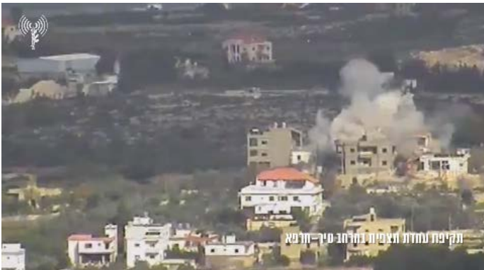
תקיפת עמדת תצפית ברחוב סיר-חרפא