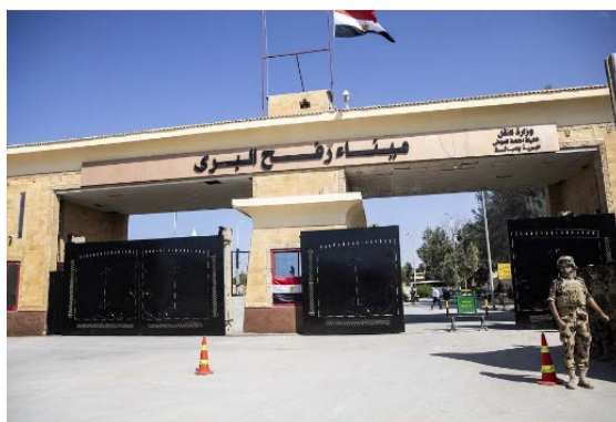
מעבר רפיח (אלשרוק, 22 בינואר 2024).

◀ צ'יאג' רשואן, ראש לשכת ההסברה המצרית , התייחס לטענות ישראל לפיהן הוברחו אמצעי לחימה משטח מצרים לתוך הרצועה. לדבריו, "כל העולם יודע את היקף המאמצים שהשקיעה מצרים להשגת ביטחון ויציבות בגבול הרצועה" ולמצרים יש ריבונות מלאה על שטחה וגבולותיה, ועל כן כל טענה בנוגע להברחה באמצעות משאיות סיוע הנכנסות לרצועה ממעבר רפיח היא שקרית, משום שכל משאית העוברת במעבר עוברת קודם כל במעבר כרם שלום הנמצא בפיקוח ישראל. לדבריו, ישראל משקרת כדי להצדיק המשך הרג פלסטינים ברצועת עזה וכדי ליצור לגיטימציה לכיבוש ציר פילדלפי. הוא אף הדגיש כי "כל מהלך בכיוון זה יאיים על יחסי ישראל-מצרים (אלשרוק, 22 בינואר 2024).