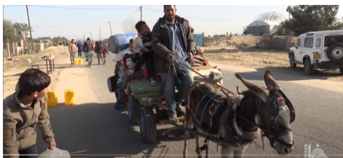
מימין : תושבים מח'אן יונס מתפנים לאזור רפיח. משמאל : מחנות אוהלים עבור מפונים ברפיח

◀ אסאמה חמדאן, בכיר חמאס , אמר כי לאור מיעוט הגעתו של סיוע מספיק של מוצרי מזון והיעדרם המוחלט באזורים רבים בצפון רצועת עזה, יותר מחצי מיליון פלסטינים בצפון רצועת עזה עומדים בפני סכנת מוות אמיתית, והם גועים ברעב, ואינם אוכלים במשך ימים שלמים. הוא קרא לארגון הבריאות העולמי לפעול לאלתר ולהכריז על רצועת עזה כאזור מוכה רעב, וללחוץ לביצוע צעדים שימנעו את החמרת המצב ההומניטרי הקטסטרופלי ברצועה. הוא גם קרא לאונר"א לשאת באחריות ההומניטרית שלה ולקיים את תפקידה בהכנסת סיוע וחלוקתו לכל האזורים ברצועת עזה ובפרט לצפונה, ולא להיכנע ללחצים והתכתיבים של ישראל. הוא קרא לכל המדינות בעולם, בתיאום עם מוסדות האו"ם הרלוונטיים, להפעיל לחץ על ישראל והממשל האמריקני כדי שיוכנס סיוע דרך היבשה, האוויר והים. כן קרא לארגון לשיתוף פעולה אסלאמי ולליגה הערבית, ולמנהיגי האומות הערבית והאסלאמית, להתערב מיידית ולהפעיל לחץ רציני לפתוח את המעברים ולהכניס סיוע, ע"י שליחת שיירות סיוע והנחתת סיוע מהאוויר בדחיפות, כדי למנוע התרחשות אסון של רעב (ערוץ הטלגרם של חמאס ביהודה ושומרון, 22 בינואר 2024).