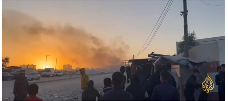
כתב ערוץ אלג'זירה במערב העיר ח'אן יונס, סמוך לאוניברסיטת אלאקצא, מתעד את הלחימה באזור (ערוץ היוטיוב של אלג'זירה, 23 בינואר 2024)