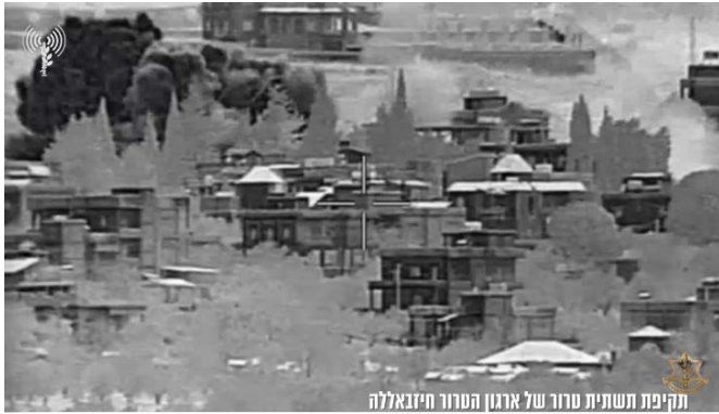
תקיפת תשתית טרור של ארגון הטרור חיזבאללה