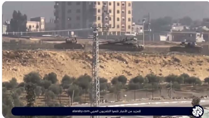
טנקים של צה"ל סמוך לבית החולים אלח'יר במערב ח'אן יונס (ערוץ אלערבי, 23 בינואר 2024)

◀ כלי תקשורת פלסטינים דיווחו על המשך תקיפות סמוך לבית החולים נאצר במערב העיר וכן גם באזור קיזאן אבו רשואן (דרום ח'אן יונס), שם מתנהלים חילופי אש כבדים. כמו כן דיווחו על תקיפות צה"ל באזור מואצי, במערב רפיח (מען, 23 בינואר 2024). עוד דווח כי כוחות צה"ל פשטו על בית החולים אלח'יר במערב ח'אן יונס ועצרו את הצוות הרפואי (ערוץ אלערבי, 23 בינואר 2024).