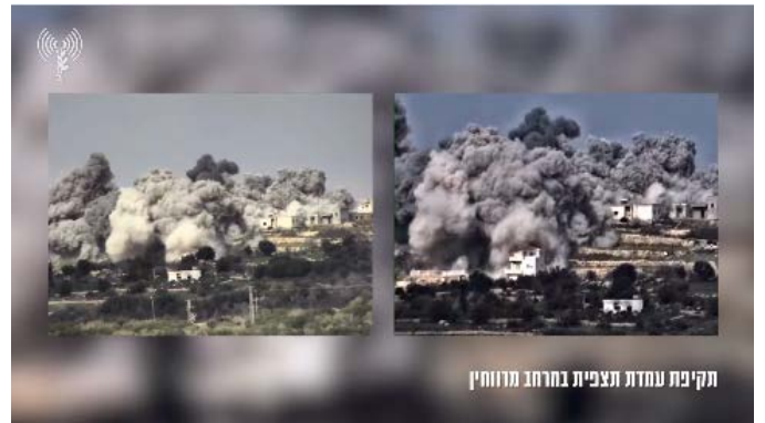
תקיפת עמדת תצפית ברחוב מרווחין