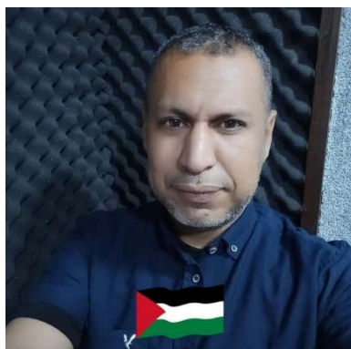
איאד אלרואעי (חשבון X של רדיו צות אלאקצא, 26 בינואר 2024)