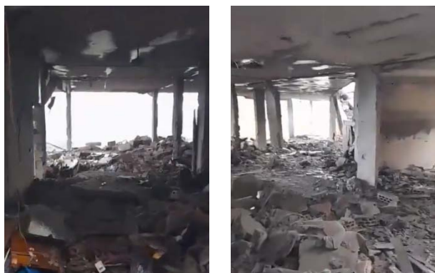
תיעוד תוצאות תקיפת באלח'יאם (חשבון X של Fouad Khreiss, 26 בינואר 2024)

בתיעוד תקיפת מבנה בדיר עאמץ (Deir Aames), כ-12 ק"מ מצפון לשתולה. נשמע דובר המציין כי נהרס לחלוטין מבנה בן שלוש קומות (חשבון X של Fouad Khreiss, 27 בינואר 2024).