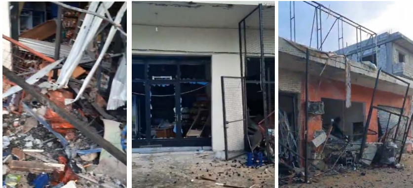
תיעוד תוצאות תקיפת חיל האוויר בטירחרפא-אלג'בין