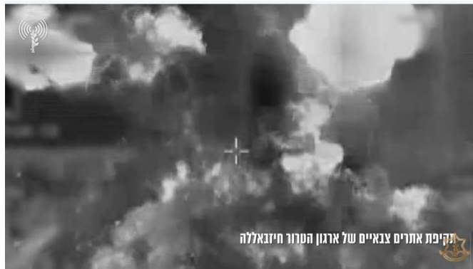
תקיפת יעדים צבאיים של חזבאללה (דובר צה"ל, 28 בינואר 2024)

בכלי תקשורת לבנוניים וברשתות החברתיות פורסמו סרטונים, שתעדו את תקיפות חיל האוויר (חשבון X של Fouad Khreiss, 25 בינואר 2024).