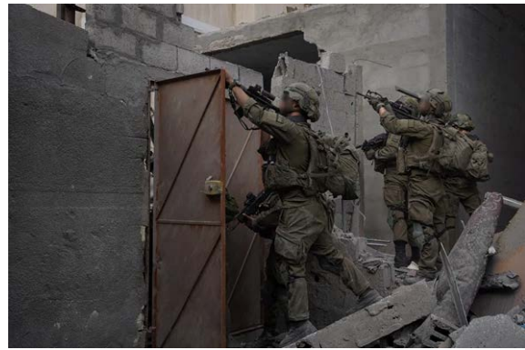
תיעוד פעילות כוחות צה"ל בחאן יונס (אתר צה"ל, 27 בינואר 2024)