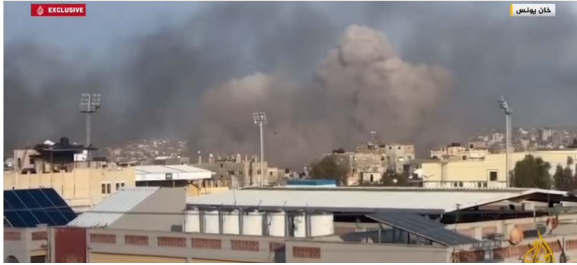
תקיפות צה"ל באזור ח'אן יונס (ערוץ היוטיוב של אלג'זירה, 28 בינואר 2024)

◀ במקביל ללחימה בח'אן יונס, צה"ל פתח מסדרון הומניטרי מאובטח ממערב לח'אן יונס אשר מאפשר תנועה בטוחה של תושבי הרצועה לכיוון מערב לאזור ההומניטרי אלמואצי תוך המשך הלחימה בחמאס (דובר צה"ל, 27 בינואר 2024).