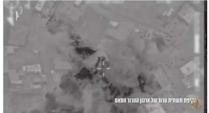
תקיפת משותפת טרור של ארגון הטרור חמאס (אתר צה"ל, 27 בינואר 2024)