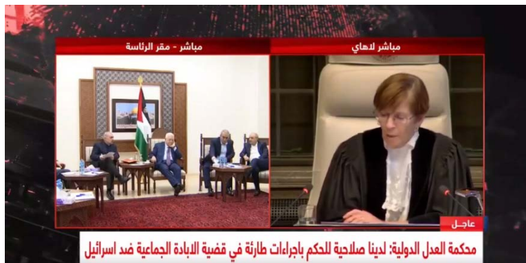
אבו מאזן צופה מלשכתו בראמאללה בהחלטת בית הדין לצדק בהאג (דף הפייסבוק של אבו מאזן, 26 בינואר 2024)

פסיקת בית הדין התקבלה בחיוב על ידי הפלסטינים אך היו שמתחו ביקורת על כך שבית הדין לא קרא להפסקת אש מיידית.