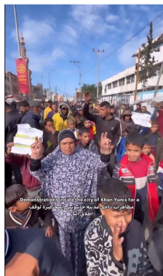
תיעוד ההפגנה בח'אן יונס (מימין: חשבון X של QUDSN, משמאל: חשבון X של אתר ספוטניק בערבית, 25 בינואר 2024)

◀ מתאם פעולות הממשלה בשטחים פרסם תיעוד של עקורים פלסטינים, שעברו מח'אן יונס דרך המעבר הבטוח לאזור אלמואצי, כשהם קוראים "העם רוצה להפיל את חמאס" (דף הפייסבוק בערבית של מתאם פעולות הממשלה בשטחים, 27 בינואר 2024).