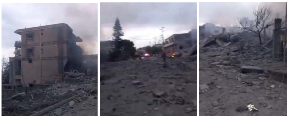
תיעוד תוצאות תקיפות חיל האוויר בכפרכלא (חשבון X של Fouad Khreiss, 25 בינואר 2024)

בכלי תקשורת לבנוניים וברשתות החברתיות פורסמו סרטונים, שתעדו את תקיפות חיל האוויר (חשבון X של Fouad Khreiss, 25 בינואר 2024).