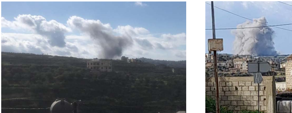
מימין: תיעוד תקיפת חיל האוויר בחולא (חשבון X של Fouad Khreiss, 28 בינואר 2024). משמאל: תיעוד תקיפת חיל האוויר בין זבקיין למג'דל זון (חשבון X של Nour Ajini, 28 בינואר 2024)