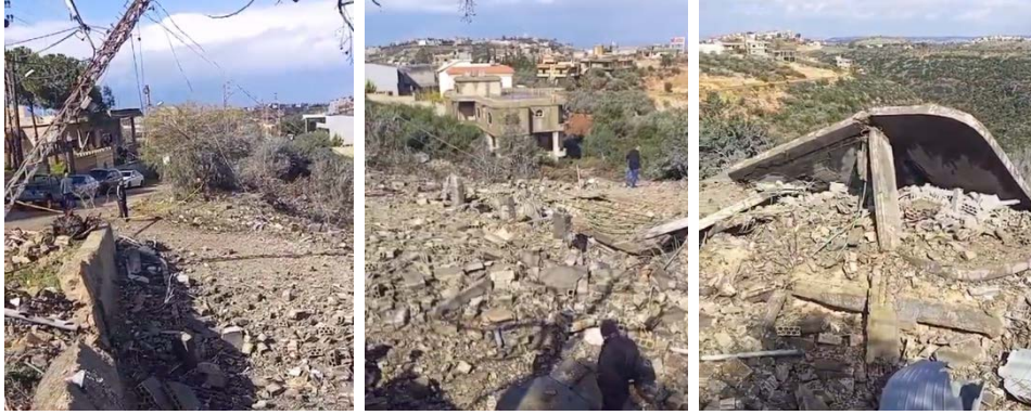
תוצאות תקיפת חיל האוויר בדיר עאמץ 2024