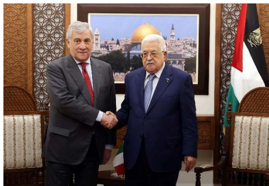
אבו מאזן בפגישה עם סגן ראש ממשלת איטליה ושר החוץ שלה (ופא, 25 בינואר 2024)

התוקפנות הישראלית נגד העם הפלסטיני. אבו מאזן חזר וציין כי הוא דוחה באופן מוחלט את עקירת הפלסטינים והדגיש כי אין פתרון צבאי או ביטחוני לרצועת עזה אשר מהווה חלק בלתי נפרד מהמדינה הפלסטינית. הוא הודה לאיטליה ולאיחוד האירופי על תמיכתם במאמצי השלום המבוססים על יישום פתרון שתי המדינות (ופא, 25 בינואר 2024).