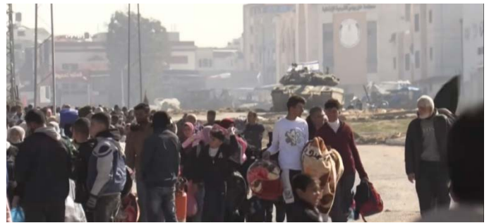
תושבים מתפנים מח'אן יונס דרומה בשל פעילות צה"ל (ערוץ היוטיוב של ופא, 26 בינואר 2024)

◀ צפון הרצועה: כוחות קרקעיים בשיתוף חיל האוויר, תקפו תשתיות צבאיות של חמאס. כמו כן הרגו הלוחמים מספר פעילים חמושים באמצעות ירי טנקים והכוונת כלי טיס (דובר צה"ל, 25 בינואר 2024). מטוסי קרב תקפו מבנה ממולכד וכן מבנה צבאי, עמדת נ"ט ופיר ששימש לצרכים מבצעיים (דובר צה"ל, 26 בינואר 2024).