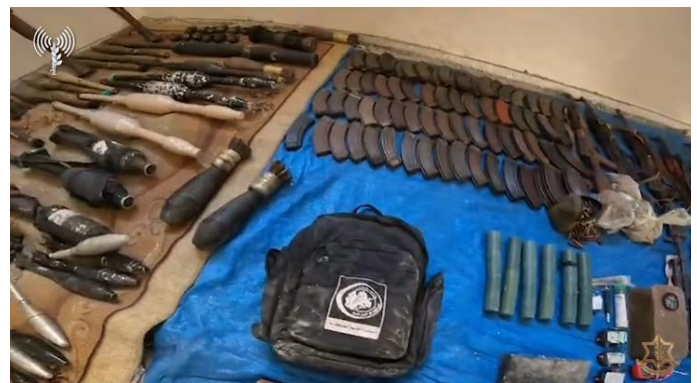
אמצעי הלחימה שאותרו על ידי הכוחות (דובר צה"ל, 25 בינואר 2024)