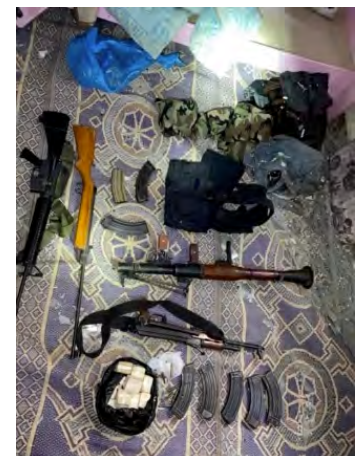
אמצעי לחימה שאותרו על ידי הכוחות (דובר צה"ל, 29 בינואר 2024)