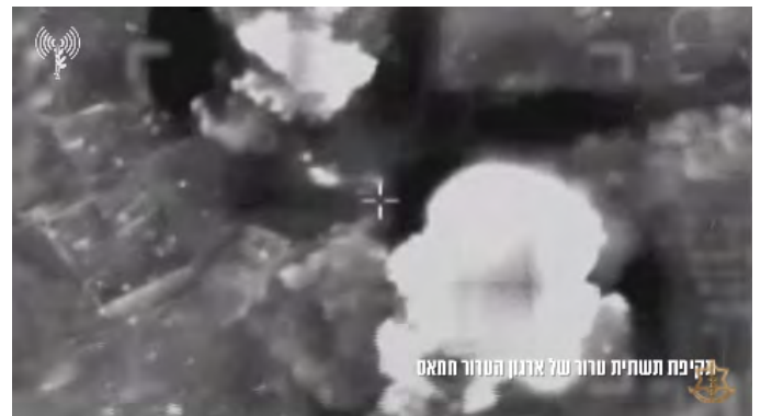
מימין: תקיפת תשתית טור של חמאס. משמאל: תקיפת מחבלי חמאס (דובר צה"ל, 29 בינואר 2024)