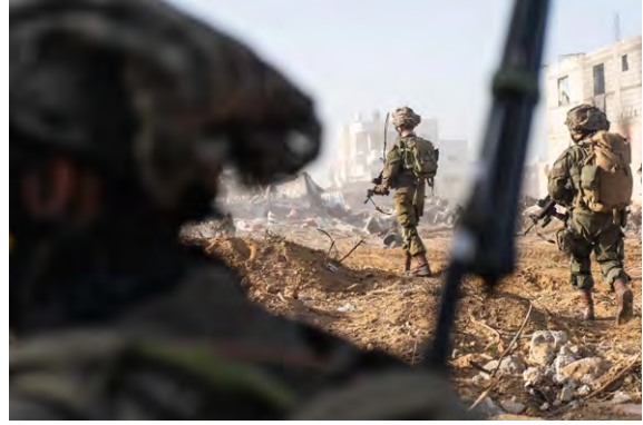
תיעוד פעילות כוחות צה"ל (אתר צה"ל, 29 בינואר 2024)

◀ דרום הרצועה: כוחות צה"ל המשיכו לפעול לטיהור המרחב במערב ח'אן יונס. כלי טיס של חיל האוויר תקפו בהכוונת כוחות קרקעיים, שני מבנים ששימשו כתשתיות טרור ובהם שהו מחבלים חמושים. הלוחמים פשטו על יעדי טרור ואיתרו אמצעי לחימה רבים ואמצעים טכנולוגיים. סמוך לבית החולים אלאמל, פשטו הלוחמים על מבנה ששימש כדירת מסתור של פעילי הג'האד האסלאמי בפלסטין בה איתרו אמצעי לחימה (דובר צה"ל, 29 בינואר 2024).