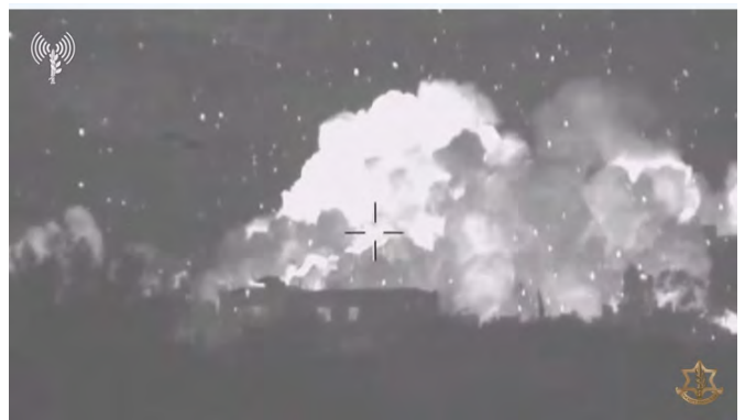
מימיו: תקיפת מבנה צבאי של חזבאללה . משמאל: תקיפת עמדה צבאית (דובר צה"ל, 28 בינואר 2024)

◀ בכלי תקשורת לבנוניים וברשתות החברתיות פורסמו סרטונים ותמונות, שתעדו את תקיפות חיל האוויר.