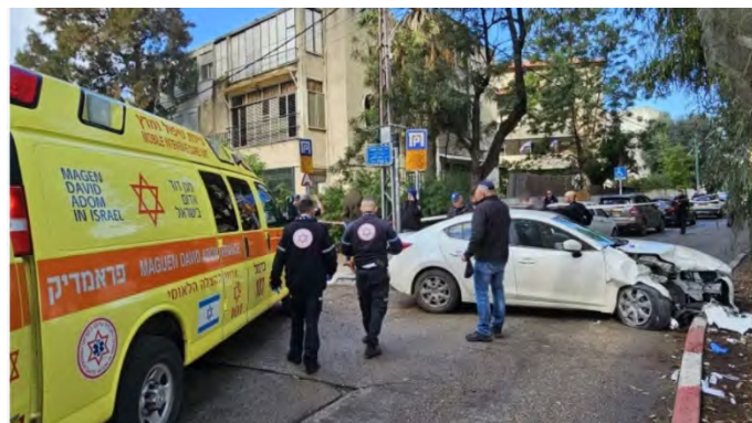
זירת הפיגוע בחיפה (דוברות מד"א, 29 בינואר 2024)

◀ ב-29 בינואר 2024 בשעות הבוקר בוצע פיגוע דריסה בחיפה, סמוך לבסיס חיל הים. אדם שנסע בכלי רכבו דרס חייל צה"ל ופצע אותו באורח קשה. לאחר הדריסה הוא התנגש עם כלי רכבו בחומת הבסיס, יצא מכלי הרכב כשהוא חמוש בגרזן וניסה לרדוף אחרי אזרחים שהיו במקום. הוא הספיק לרוץ מרחק של כמאתיים מטרים ונורה למוות על ידי קצין חובל שהיה בדרכו לבסיס. זהות מבצע הפיגוע עדיין לא ברורה ונמצאת בבדיקה של גורמי הביטחון (תקשורת ישראלית, 29 בינואר 2024).