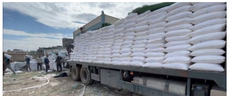
חלוקת שקי קמח במתקן אונר"א ברצועה (ערוץ היוטיוב של ופא, 28 בינואר 2024)