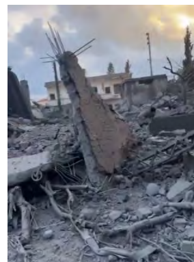
מימין: תיעוד תוצאות תקיפות חיל האוויר באלצ'היריה. משמאל: תיעוד תקיפת חיל האוויר בפרברי רמיש