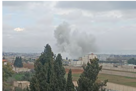
תיעוד התקיפות באלסידה זינב. מימין: (חשבון X של Daraq Net, 29 בינואר 2024). משמאל: (אלחדת', 29 בינואר 2024)

◀ בהמשך להתרעות שהופעלו במרחב קצרין, שוגרו מיירטים לעבר שתי מטרות אוויריות חשודות (דובר צה"ל, 28 בינואר 2024).