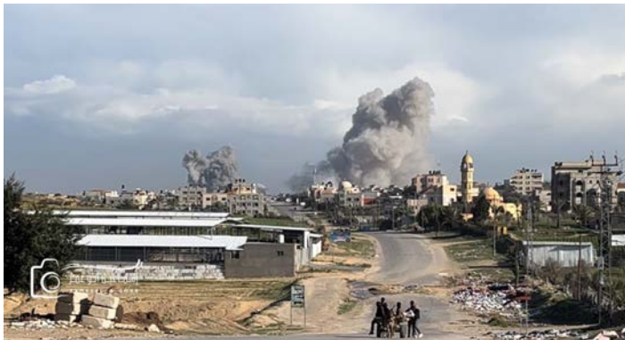
תקיפת צה"ל במרכז ח'אן יונס ב-31 בינואר בבוקר

תקף צה"ל בתים הסמוכים לבית החולים אלמל, וגם אזור בית החולים נאצר נתון לתקיפות מדי פעם (ערוץ ה-YOUTUBE של אלג'זירה, 31 בינואר 2024).