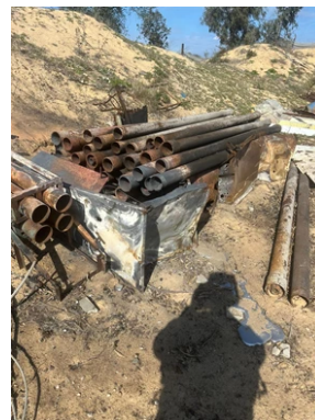
חלק מאמצעי הלחימה שאותרו בפעילות הכוחות (דובר צה"ל, 31 בינואר 2024)

◀ השאם זקות, כתב ערוץ אלג'זירה ברפיח, דיווח כי צה"ל ממקד את פעילותו בח'אן יונס. לדבריו, התקיפות בח'אן יונס מתמקדות בשכונת אלמנארה, בשכונת אלכתיבה, באזורים המערביים, ובמרכז העיר. כמו כן