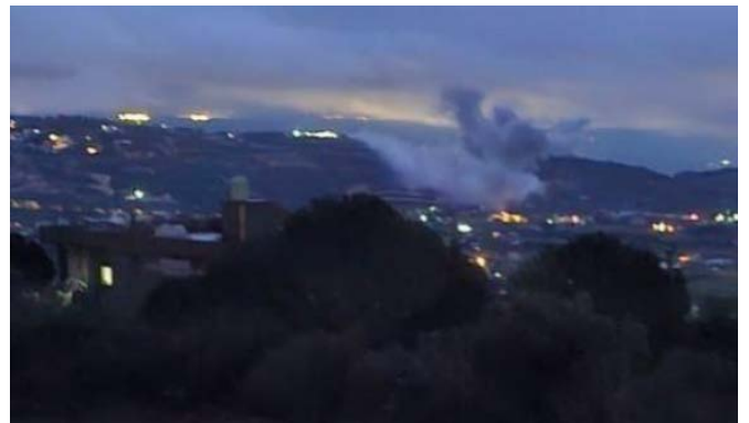
תקיפות חיל האוויר באלח'יאם (חשבון X של עלי שעב, 30 בינואר 2024)