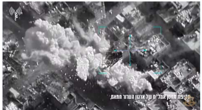
מימין: תקיפת מחסן אמצעי לחימה של חמאס. משמאל: תקיפת מחבלי חמאס (דובר צה"ל, 31 בינואר 2024)