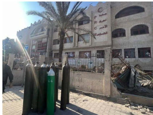
בלוני החמצן שהוכנסו לבית החולים (דובר צה"ל 11 בפברואר 2024)