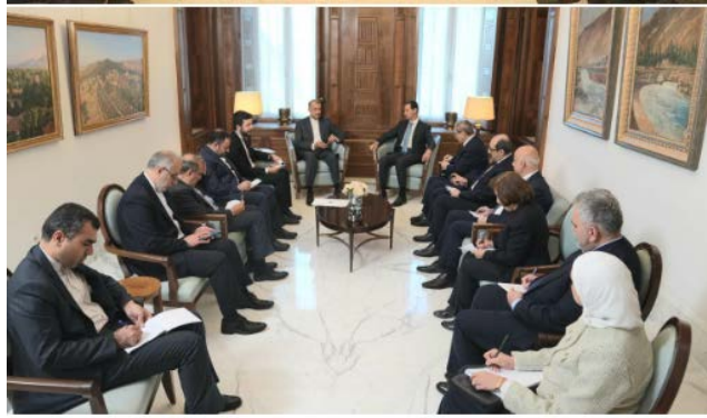
פגישת שר החוץ האיראני בסוריה (ערוץ הטלגרם של משרד החוץ האיראני, 11 בפברואר 2024)

◀ במסיבת עיתונאים שערך עם מקבילו הסורי אמר עבדאללהיאן, כי כל פעולה של ישראל באזור תקבל מענה. הוא ציין, כי רצועת עזה הפכה ל"בית הקברות של הציונים" וכי אין כל אפשרות אחרת למעט פתרון מדיני והפסקת "פשעי המלחמה" מצד ישראל וארה"ב (פארס, 11 בפברואר 2024). פיצל אלמקדאד, שר החוץ הסורי , אמר במהלך מסיבת העיתונאים, כי התקיפות הישראליות על אדמות סוריה נובעות מההתנגדות הסורית לישראל מאז הקמתה. עבדאללהיאן אמר כי הוא העביר הזמנה רשמית מנשיא איראן, אברההים רא'יסי, לאלאסד לביקור באיראן. עבדאללהיאן גינה את תוכניות ישראל לעקור בכוח את העם הפלסטיני ואמר כי התקפותיה של ישראל באזור לא יישארו ללא מענה (אלאח'באריה, 11 בפברואר 2024).