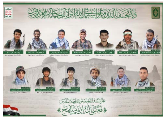
כרזת חללי החות'ים (ערוץ הטלגרם של חללי החות'ים, 11 בפברואר 2024)

◀ החות'ים פרסמו כרזה לזכר 13 פעילים שנהרגו בתקיפות של ארה"ב ובריטניה בתימן. בפרסום לא צוין מתי הם נהרגו (ערוץ הטלגרם של חללי החות'ים, 11 בפברואר 2024).