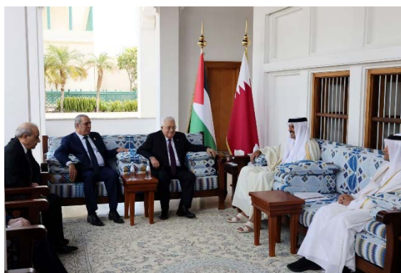
פגישת אבו מאזן עם שליט קטר (ופא, 12 בפברואר 2024)

◀ אבו מאזן נפגש בדוחה עם תמים בן חמד, שליט קטר . בפגישה עדכן אותו אבו מאזן אודות תמונת המצב בזירה הפלסטינית והמאמצים להפסקת המלחמה ברצועת עזה. אבו מאזן הזהיר מפני הסכנות הכרוכות בפעולה צבאית ישראלית ברפיח וקרא להתערבות הקהילה הבינלאומית ובמיוחד ממשל ארה"ב כדי להפסיק את המלחמה ברצועה והמתקפה נגד רפיח, שכדי שלא להביא לאסון הומניטארי, למעשי טבח ולהישנות אירועי הנכבה של שנת 1948 ו-1967. אבו מאזן גם ביקש את שחרור כספי הסילוקין שבידי ישראל. שליט קטר עדכן אותו אודות המאמצים להפסקת המלחמה ועל המהלכים להקמת מדינה פלסטינית והכרה בפלסטין כחברה מן המניין באו"ם (ופא, 12 בפברואר 2024).