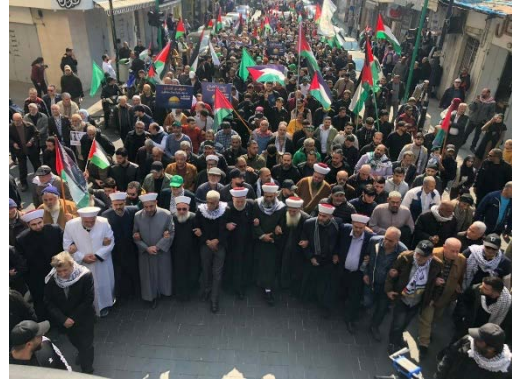
התהלוכה בבירות