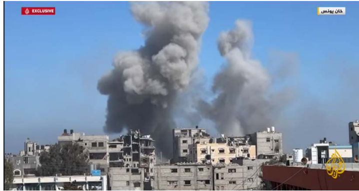
תקיפות צה"ל סמוך לבית החולים נאצר בח'אן יונס (ערוץ היוטיוב של אלג'זירה, 11 בפברואר 2024)