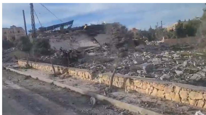
תקיפה במרכבא (חשבון X של Fouad Khreiss, 12 בפברואר 2024)

◀ ברשתות החברתיות בלבנון, דווח על תקיפה אווירית נגד מבנה במרכבא (חשבון X של Fouad Khreiss, 12 בפברואר 2024).