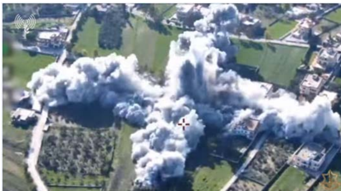
מימין: תיעוד התקיפה במרחב יארון. משמאל: תיעוד התקיפה במרחב מרוחין (דובר צה"ל, 11 בפברואר 2024)

◀ ברשתות החברתיות בלבנון, דווח על תקיפה אווירית נגד מבנה במרכבא (חשבון X של Fouad Khreiss, 12 בפברואר 2024).