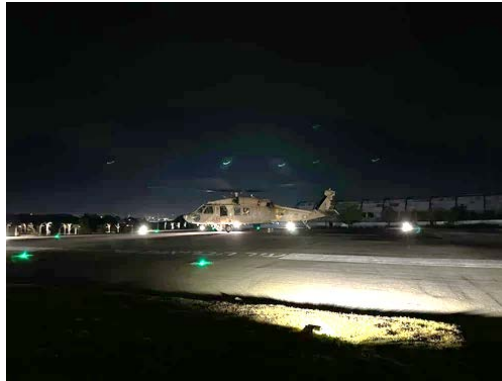
תיעוד הגעת החטופים לבית החולים סורוקה בישראל (דובר צה"ל, 12 בפברואר 2024)

◀ במבצע משותף של צה"ל, שירות ביטחון כללי וימ"מ בלב רפיח חולצו שני חטופים ישראלים. פעולת החילוץ התבצעה על בסיס מודיעין מדויק. הכוחות, שפעלו תחת אש, פרצו למבנה בלב רפיח. שם בקומה השנייה, הוחזקו שני החטופים, בידי חמושים של חמאס, ששהו במבנה. לאחר קרב וחילופי אש כבדים, בכמה מוקדים במקביל, עם מחבלים רבים הצליחו הכוחות לחלץ את השניים (דובר צה"ל, 12 בפברואר 2024). מקורות פלסטינים ברפיח דיווחו כי יותר ממאה בני אדם נהרגו, ביניהם ילדים ונשים, וכמה מאות נפצעו בעקבות תקיפות ישראליות אינטנסיביות על העיר (ופא, 12 בפברואר 2024). החטופים הוחזקו בבית משפחה, כשפעילי חמאס שומרים עליהם. זו עדות נוספת לשימוש שעושה חמאס בתשתית האזרחית ברצועת עזה לצרכים צבאיים ולשיתוף הפעולה בין האוכלוסייה האזרחית לפעילי חמאס. יצוין ששחרור חטופים מרפיח יכול להעיד על כך שחטופים נוספים נמצאים במקום כמו גם פעילי חמאס, יתכן ביניהם גם בכירים.