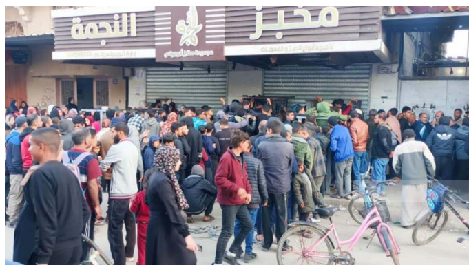
תושבים פלסטינים מפונים בריח ממתנים בתור במאפייה (11 בפברואר 2024)

◀ ד"ר אשרף אלקדרה, דובר משרד הבריאות ברצועת עזה עדכן, כי מלאי המזון בבית החולים נאצר בח'אן יונס אזל, וכי לא ניתן לנוע כלל במתחם בית החולים לאחר שצלפים של צה"ל הרגו עד כה שבעים תושבים ופצעו 14 אנשי צוות במקום (דף הפייסבוק של משרד הבריאות בעזה, 12 בפברואר 2024).