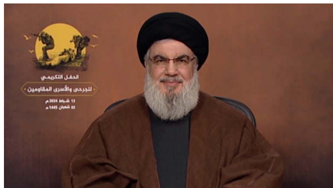
חסן נצראללה נואם (אלמנאר, 14 בפברואר 2024)

◆ ביטחון מידע: נצראללה הזהיר, כי אסור למסור מידע בחינם לישראל באמצעות הרשתות החברתיות, מאחר שישראל מחפשת אחר מידע זה. הוא הוסיף, כי יש לשים לב לשמועות המופצות ברשתות החברתיות, שמטרתן להפחיד את האנשים ולפגוע ברצונם. הטלפון הסלולארי הינו מכשיר ציתות. הוא קרא לכל תושבי הכפרים הסמוכים לגבול דרום לבנון, ובפרט ללוחמים ובני משפחותיהם, לוותר על הטלפונים הסלולאריים שלהם, כדי לשמור על חייהם וכבודם. הוא טען, כי הטלפון הסלולארי הינו סוכן הורג, המוסר מידע וממית.