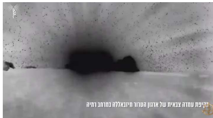
תקיפות באזור ראמיה (דובר צה"ל, 13 בפברואר 2024)

◀ בתגובה לפעילות חזבאללה ביממה האחרונה תקפו מטוסי קרב עמדה צבאית באזור רמיה ועמדה צבאית נוספת באזור רשיא אלפחאר, אשר בוצעו ממנה שיגורים לעבר ישראל. כמו כן תקפו עמדת תצפית ותשתיות נוספות של חזבאללה באזור חולא, קלעת דבה, יארון, מיס אלג'בל, יארין ושיחין (דובר צה"ל, 14 בפברואר 2024).