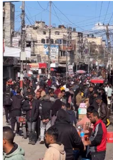
תנועה ערה של תושבים ברפיח (חשבון X של QUDSN, 14 בפברואר 2024)