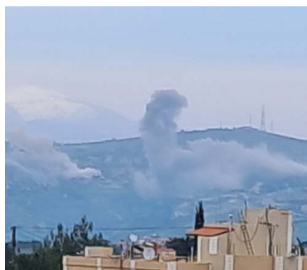
מימין: תקיפות בחולא (חשבון X של Fouad Khreiss, 13 בפברואר 2024). משמאל: תקיפות בראמיה (חשבון X של עלי שעיב, 13 בפברואר 2024)