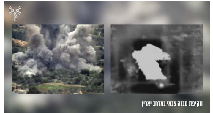
תקיפת מבנה צבאי במרחב יארין

מימין: תקיפות ביארין. משמאל: תקיפות בשיחין (דובר צה"ל, 13 בפברואר 2024)