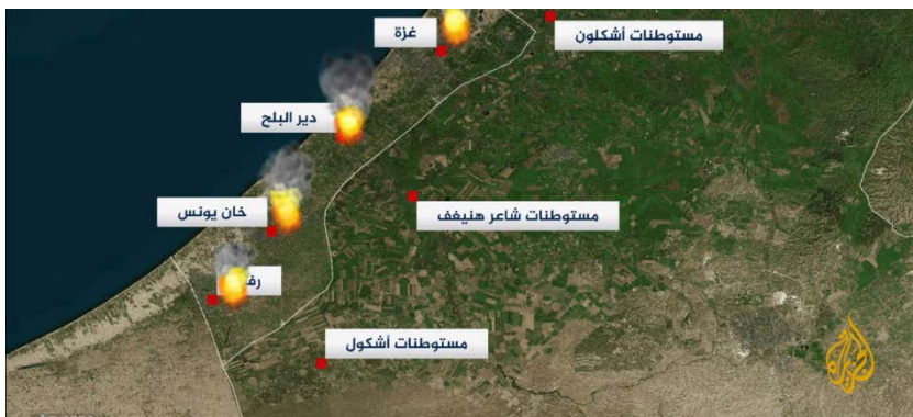
כתבת ערוץ אלג'זירה אודות תקיפות צה"ל ברחבי הרצועה (ערוץ היוטיוב של אלג'זירה, 13 בפברואר 2024)

◀ הזירה הדרומית: כלי תקשורת פלסטינים דיווחו על מספר מוקדי פעילות של כוחות צה"ל ברצועה ביממה האחרונה. העיר עזה: תקיפות חיל האוויר בצפון העיר ובשכונת אלזיתון, בדרום העיר. מרכז הרצועה: תקיפות במזרח דיר אלבלח ובאלזואידה. ח'אן יונס: תקיפות חיל האוויר באזור אלקרארה, צפונית-מזרחית לח'אן יונס. כמו כן ממשיכים כוחות צה"ל לכתר את בית החולים נאצר והם ביקשו מהשוהים בו להתפנות מייד למעט חולים ואנשי צוות רפואי. רפיח: תקיפות צה"ל וחיל האוויר ברחבי העיר בדגש על האזור הסמוך לגדר הגבול עם מצרים (ופא, 13 בפברואר 2024).