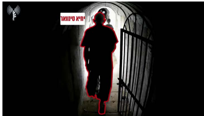
מתוך הסרטון: יחיא אלסנואר נמלט במנהרה (אתר צה"ל, 13 בפברואר 2024)