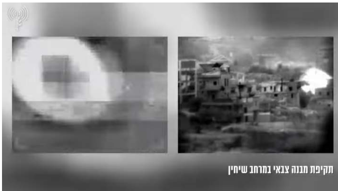
תקיפת מבנה צבאי במרחב שיחין