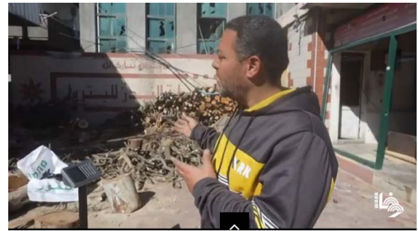
מכירת גזמי עץ לצורך בישול והבערת אש