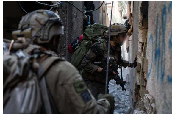
פעילות כוחות צה"ל