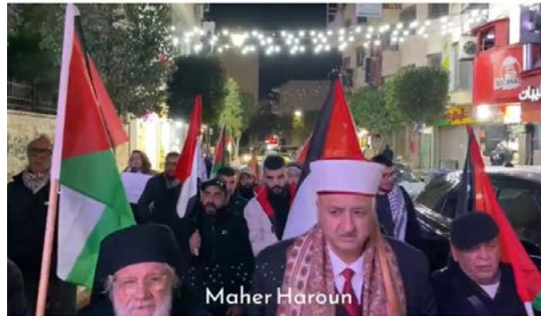
התהלוכה בראמאללה

◀ ב-13 בפברואר 2024 בשעות הערב נערכה בראמאללה צעדת תמיכה ברצועת עזה ובהתנגדות (חריה ניוז, 13 בפברואר 2024).