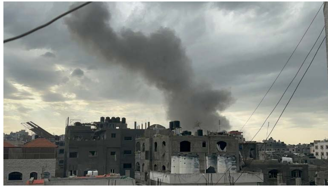
תקיפת צה"ל מזרחית למחנה הפליטים ג'באליא (חשבון X של שהאב, 15 בפברואר 2024)

הוסיף כי 85% מהמתקנים הרפואיים הגדולים ברצועת עזה שימשו את חמאס לפעולות טרור, כפי שהוכח בבתי החולים אלרנתיסי, אלאמל ובתי חולים נוספים (חשבון X של דובר צה"ל באנגלית, 15 בפברואר 2024). ◀ הג'האד האסלאמי בפלסטין גינה בחריפות את תקיפת בית החולים אלאמל וסביבתו בח'אן יונס בציינו כי זהו פשע חדש שהתווסף לפשעי המלחמה שביצעה ישראל נגד הפלסטינים. הם קראו להסלמת ההתנגדות בכל מקום כדי להגיב על "פשעי הכיבוש" (ערוץ הטלגרם של הג'האד האסלאמי בפלסטין, 14 בפברואר 2024). ◀ מרכז הרצועה: כוחות צה"ל פעלו בעיקר נגד חוליות חמושות. באחת הפעולות הרגו הכוחות מפקד תצפיות של הזרוע הצבאית של חמאס. בפעילות נוספת, זיהתה ספינה של זרוע הים חוליית מחבלים מתקרבת לכוחות צה"ל. החוליה הותקפה על ידי לוחמי זרוע הים והכוחות בשטח וחברי החוליה נהרגו (דובר צה"ל, 15 בפברואר 2024). ◀ צפון הרצועה: במהלך הימים האחרונים, ביצעו כוחות צה"ל שורה של סיכולים ממוקדים בצפון הרצועה ובעיר עזה. ביממה האחרונה, הרגו הלוחמים כ-15 פעילי חמאס, בהם פעיל מנגנון הביטחון הכללי של הארגון ומספר מחבלים שלקחו חלק במתקפה ב-7 באוקטובר (דובר צה"ל, 15 בפברואר 2024).