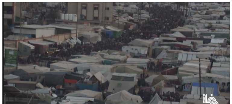
הרחוב הראשי של רפיח