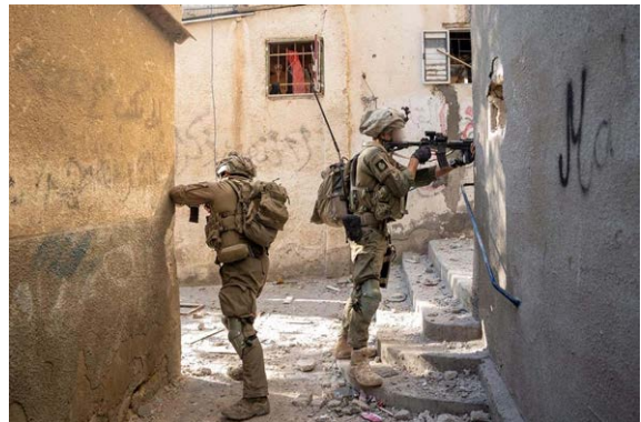
תיעוד פעילות הכוחות (דובר צה"ל, 15 בפברואר 2024)

◀ כלי תקשורת פלסטינים דיווחו ב-15 בפברואר 2024 בשעות הבוקר, כי כוחות צה"ל מבצעים ירי אינטנסיבי לעבר האזור הסמוך לבית החולים נאצר בח'אן יונס. עוד דווח, כי כוחות צה"ל עצרו מספר צעירים ורופאים עם צאתם מבית החולים וכי הכוחות נכנסו לשטח הדרומי של מתחם בית החולים והחלו לבצע עבודות חישוב קרקע. צוין, כי הירי גרם לפגיעה בצינור החמצן של בית החולים, דבר המסכן את חייהם של חולים רבים. במהלך הלילה ירו כוחות צה"ל לעבר מחלקת האורתופדיה בבית החולים. דווח על הרוג ומספר פצועים (חשבון X של שהאב, 15 בפברואר 2024). דובר צה"ל מסר כי בידי צה"ל מידע מודיעיני אמין לפיו חמאס החזיק חטופים בבית החולים ויתכן שישנן גופות חטופים במקום וכי נראה שגם מחבלים פועלים במתחם בית החולים. עוד