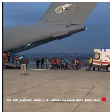
הגעת הפצועים מהרצועה לתורכיה (ערוץ היוטיוב של אלג'זירה, 15 בפברואר 2024)