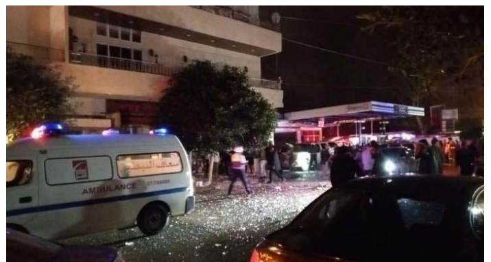
תקיפה באלנבטיה (מימין: אלנשרה, 15 בפברואר 2024), משמאל: חשבון X של Fouad Khreiss, 15 בפברואר 2024