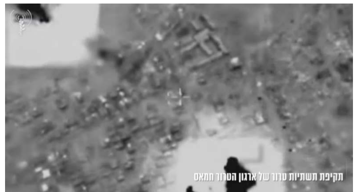
תקיפת תשתיות טרור של ארגון הטרור חמאס