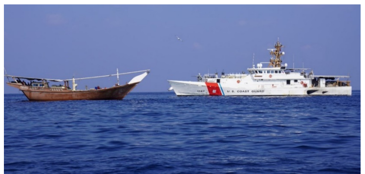
מימין: כלי השיט (בצבע חום) מלווה על-ידי משחתת אמריקנית. משמאל: אמצעי הלחימה שנמצאו על גבי כלי השיט