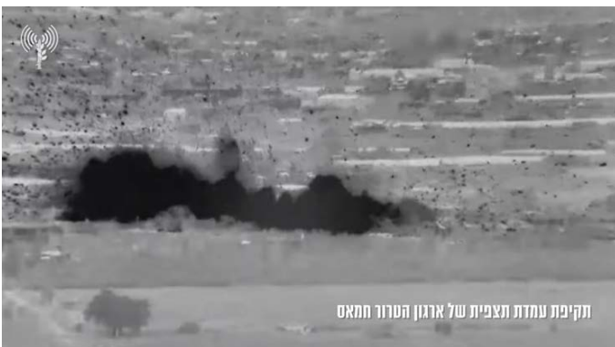
תקיפת עמדת תצפית של ארגון הטרור חמאס

◀ פעילות אווירית: במהלך היממה האחרונה, ביצעו כוחות חיל האוויר מספר תקיפות ברחבי רצועת עזה כחלק מהסיוע שהם מעניקים לכוחות המתמרנים בשטח. בתקיפות, הושמדו תשתיות תת קרקעיות לצד מבנים צבאיים ועמדות שיגור של חמאס (דובר צה"ל, 15 בפברואר 2024).