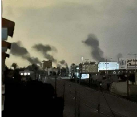
תקיפות מהאוויר בדיר אלבלח (חשבון X של שהאב, 14 בפברואר 2024)