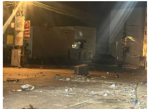
עימותים בטובאס (14 בפברואר 2024)