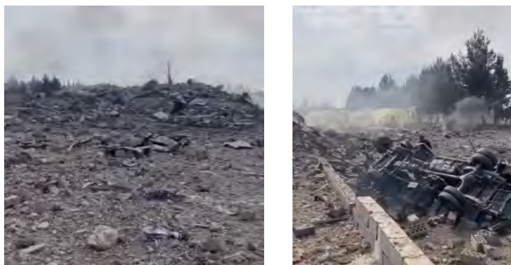
תקיפה בבעלבכ (ערוץ הטלגרם אח'באר כל מואטן, 26 בפברואר 2024)

◀ חזבאללה פרסם הודעה כי יחידת ההגנה האווירית שלו הפילה כלי טיס בלתי מאויש מסוג הרמס 450 באמצעות טיל קרקע אוויר באזור אלתפאח וכי ניתן היה לראות אותו מתרסק (ערוץ הטלגרם של זרוע ההסברה הקרבית, 26 בפברואר 2024).