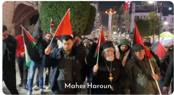
התהלוכה בראמאללה (חשבון X של QUDSN, 25 בפברואר 2024)