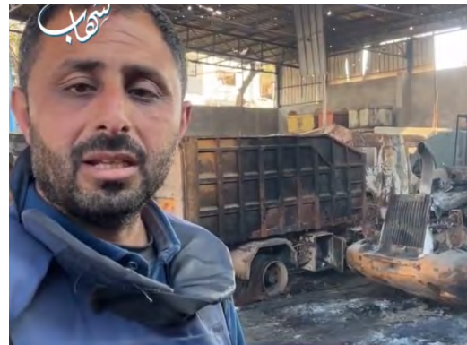
כלי רכב של עיריית עזה, שנפגעו בפעילות צה"ל בעיר (26 בפברואר 2024)