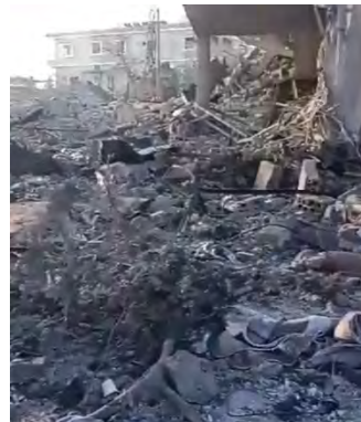
מימין: תיעוד תקיפה באלצ'הירה. משמאל: תקיפה בברעשית (חשבון X של Fouad Khreiss, 25 בפברואר 2024)