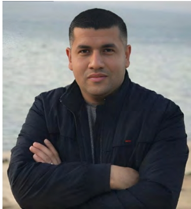
מצעב אבו זאיד

◀ ב-21 בפברואר דווח כי העיתונאי איהאב נצראללה נהרג בפעילות כוחות צה"ל בשכונת אלזיתון בעיר עזה (ופא, 21 בפברואר 2024).