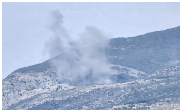
תקיפה בין אלג'רמק לג'בל אלרפיע במרחב אלנבטיה (חשבון X של עלי שעיב, 26 בפברואר 2024)

ב-26 בפברואר 2024 בשעות הבוקר יירטו לוחמי ההגנה האווירית באמצעות מערכת "קלע דוד" טיל קרקע-אוויר ששוגר לעבר כלי טיס מאויש מרחוק של חיל האוויר שפעל בשמי לבנון. לאחר זמן קצר, שוגר טיל נוסף לעבר כלי הטיס ופגע בו. הכלי הטיס נפל בשטח לבנון. בתגובה תקפו מטוסי קר של חיל האוויר יעדי הגנה אווירית של חיזבאללה בעומק לבנון (דובר צה"ל, 26 בפברואר 2024). הלבנונים דיווחו על תקיפה אווירית באזור בעלבכ (Ba'albek) (שבבקעת הלבנון ערוץ הטלגרם אח'באר כל מואטן, 26 בפברואר 2024). ועל תקיפה בין אלג'רמק (Al-Jarmaq) לג'בל אלרפיע ('Jabal Al-Rafee'), במרחב שהינו כארבעה ק"מ מצפון-מזרח לאלנבטיה (Al-Nabatiyeh) (חשבון X של עלי שעיב, 26 בפברואר 2024).