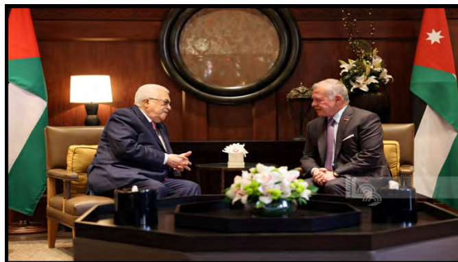
פגישת אבו מאזן עם עבדאללה מלך ירדן (ופא, 25 בפברואר 2024)

◀ אבו מאזן, יו"ר הרשות הפלסטינית , נפגש בעמאן עם עבדאללה השני, מלך ירדן. השניים שוחחו על ההתפתחויות האחרונות בזירה הפלסטינית והמגעים להפסקת "התוקפנות הישראלית". אבו מאזן הזהיר מפני כוונת ישראל להטיל הגבלות על כניסת מתפללים למסגד אלאקצא' במהלך חודש רמצ'אן (ופא, 25 בפברואר 2024). עבדאללה מלך ירדן , הדגיש את הצורך להגיע להפסקת אש מיידית וציין שירדן תמשיך להעניק סיוע הומניטרי לתושבי הרצועה. הוא גם הזהיר מפני המשך המלחמה במהלך חודש רמצ'אן, מה שלדעתו, יעמיק את הסיכוי להתרחבות הסכסוך (סוכנות הידיעות הירדנית, 25 בפברואר 2024).