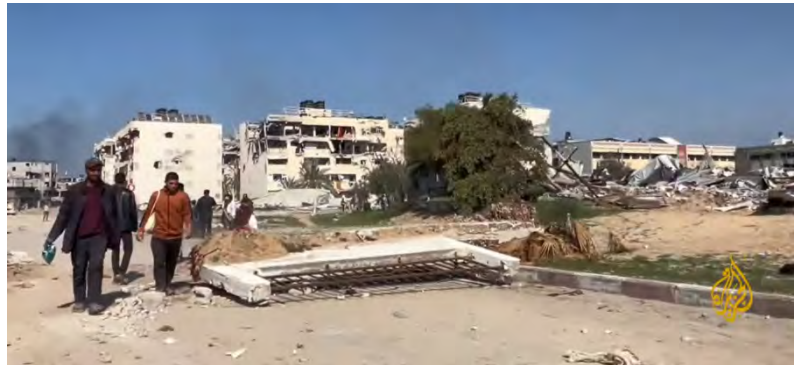
תיעוד ההרס ובריחת תושבים ממערב העיר ח'אן יונס (ערוץ היוטיוב של אלג'זירה, 26 בפברואר 2024)

◀ העיר עזה: נמשכה הלחימה בשכונת זיתון שבמזרח העיר של כוחות קרקע בסיוע מהאוויר. ביממה האחרונה הרגו הכוחות כשלושים מחבלים שפעלו בסמוך לכוחות (דובר צה"ל, 26 בפברואר 2024).