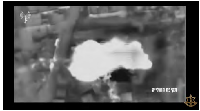
תקיפת מבנים צבאיים של חיזבאללה במרחב בלידא (דובר צה"ל, 25 בפברואר 2024)