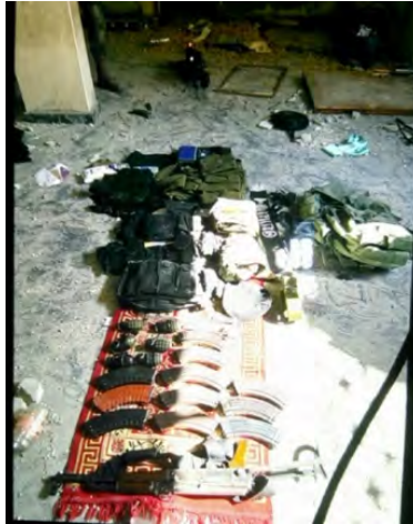
תיעוד הנשק שנמצא באחת מתשתיות הטרור (דובר צה"ל, 25 בפברואר 2024)

◀ כתב ערוץ אלג'זירה תיעד הבוקר את ההרס שנגרם בשכונה האוסטרית במערב ח'אן יונס בעקבות פעילות כוחות צה"ל. בכתבה הוא ראיין תושבים המחלצים שקי קמח וציוד מבתיהם במטרה לעזוב את המקום בשל הרחבת פעילות צה"ל (ערוץ היוטיוב של אלג'זירה, 26 בפברואר 2024).