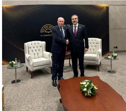
ריאצ' אלמאלכי נפגש באנטליה עם מקבילו התורכי (דף הפייסבוק של משרד החוץ הפלסטיני, 3 במרץ 2024)

חודש רמצי'אן ולאפשר להכניס סיוע לרצועה בבטחה (ערוץ הטלגרם של משרד החוץ של הרשות, 3 במרץ 2024).