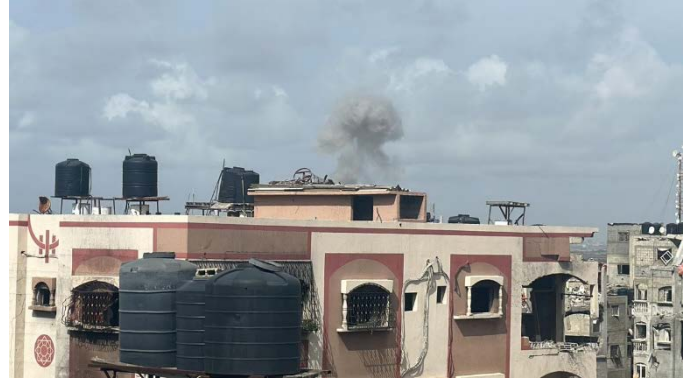
תקיפת חיל האוויר בצפון רצועת עזה (חשבון X של שהאב, 3 במרץ 2024)