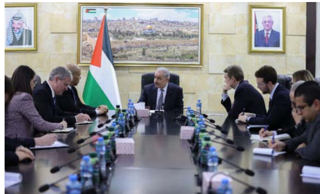
אשתיה נפגש עם משלחת של חברי הקונגרס האמריקני (ופא, 3 במרץ 2024)

◀ מחמד אשתיה, ראש ממשלת המעבר של הרשות הפלסטינית , נועד עם משלחת של חברי קונגרס אמריקאים. בפגישה הוא קרא לארה"ב לתמוך בהפסקת אש מיידית, לפעול לפתיחת המעברים ברצועת עזה להכנסת סיוע ולספק שירותים בסיסיים בצורה שתענה על המשבר ההומניטרי. כמו כן ביקש מארה"ב שלא לעשות שימוש בזכות הטו שלה נגד הדרישה הפלסטינית לחברות מלאה באו"ם וקרא לארה"ב להכיר בפלסטין כמדינה. עוד ביקש להשיב את המימון לאונר"א (ופא, 3 במרץ 2024).