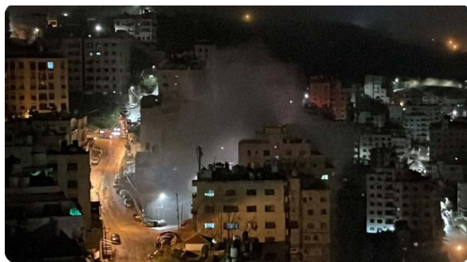
מימין: פיצוץ דירת המפגע בשכם (חשבון X של שהאב, 4 במרץ 2024). משמאל: הדירה לאחר הריסתה (ופא, 4 במרץ 2024)