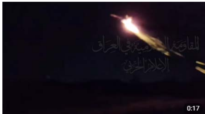
כלי הטיס בעת שיגורו (ערוץ הטלגרם של ההתנגדות האסלאמית בעיראק, 4 במרץ 2024)