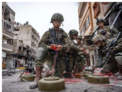
פעילות כוחות צה"ל בח'אן יונס (דובר צה"ל, 4 במרץ 2024)