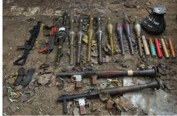
אמצעי לחימה שאיתרו הכוחות (דובר צה"ל, 3 במרץ 2024)