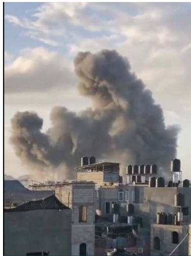
תקיפת חיל האוויר במחנה הפליטים ג'באליא (חשבון X של שהאב, 4 במרץ 2024)