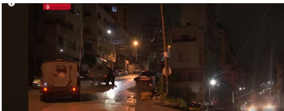
יציאת כוחות הביטחון משכם בתום פעילותם במקום (ערוץ היוטיוב של אלג'זירה, 4 במרץ 2024)

◀ כוחות הביטחון פעלו במספר מוקדים נוספים ביניהם במחנה הפליטים אלמערי בראמאללה שם עצרו שני מבוקשים, תחקרו חשודים, החרימו חומרי הסתה של חמאס. במהלך הפעילות התפתחו עימותים בהם נפצעה לוחמת משמר הגבול באורח קל. במחנה הפליטים נור שמס (מזרחית לטולכרם), חשפו הכוחות מטעני נפץ מוכנים לשימוש, אשר הוטמנו מתחת לכבישים. בטובאס עצרו הכוחות שני מבוקשים (חשבון X של דובר צה"ל, 4 במרץ 2024).