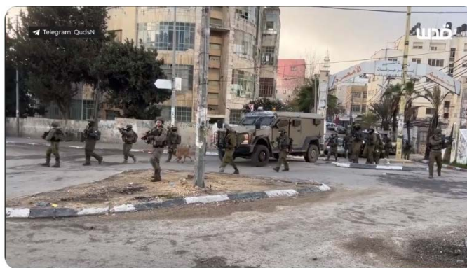
מימין: פעילות כוחות הביטחון במחנה הפליטים אלמערי בראמאללה. משמאל: מחנה הפליטים נור שמס לאחר שכוחות הביטחון חשפו מטעני נפץ מתחת לכבישים