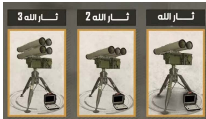
שלושת דגמי מערכות שיגור טילי נ"ט של חזבאללה (חשבון X של מג'תבא, 27 בפברואר 2024)