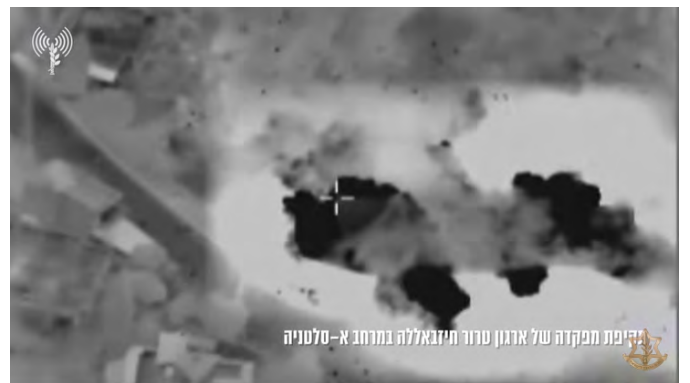
תקיפת מפקדה של ארגון טרור חזבאללה במרחב א-סלטניה

מימין: תקיפת מפקדה צבאית באסלטניה. משמאל: תקיפת מבנה צבאי במרחב צדיקין (דובר צה"ל, 4 במרץ 2024)