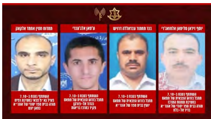
ארבעה עובדי אונר"א שהופללו (דובר צה"ל, 4 במרץ 2024)

ארבעה שמות של עובדים שלקחו חלק פעיל במתקפת ה7 באוקטובר ויתכן גם בחטיפת נשים (דובר צה"ל, 4 במרץ 2024).