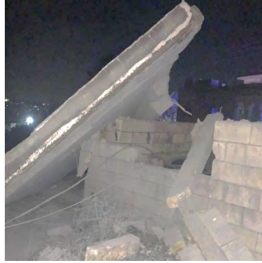
תקיפה באלסלטאניה