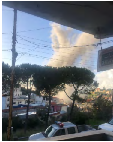
תקיפה באלעדיסה (חשבון X של Fouad Khreiss, 4 במרץ 2024)

◀ על פי חזבאללה ההרוגים הם (ערוץ הטלגרם של זרוע ההסברה הקרבית של חזבאללה, 4 במרץ 2024):