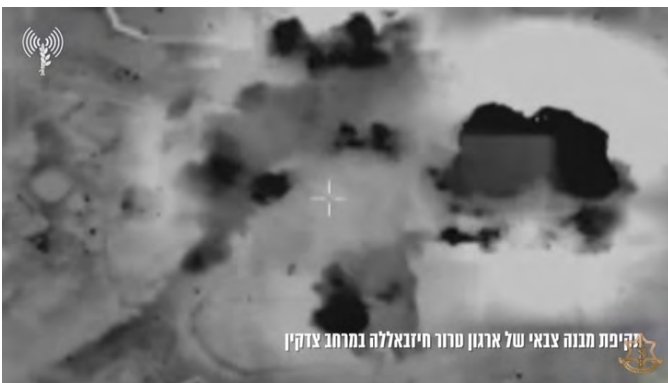
תקיפת מבנה צבאי של ארגון טרור חזבאללה במרחב צדיקין

◀ בתגובה לפעילות חזבאללה, תקפו מטוסי קרב במספר גיחות, יעדי חזבאללה בבנת ג'בל, אלסלטניה, שיחין, עיתא אלשעב וצדיקין. בין היעדים שהותקפו, מבנים צבאיים ומפקדה צבאית ששימשו את הארגון (דובר צה"ל, 4 במרץ 2024).