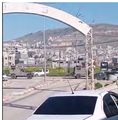
מימין: כוחות הביטחון י נכנסים למחנה הפליטים בלאטה בשכם. משמאל: פעילות הכוחות הביטחון במחנה (חשבון X של QUDSN, 5 במרץ 2024)