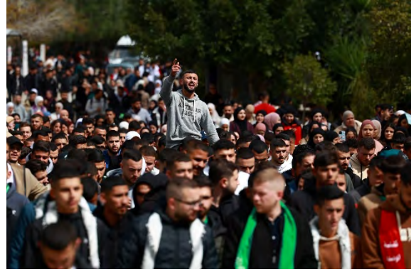
הפגנת התמיכה בביר זית