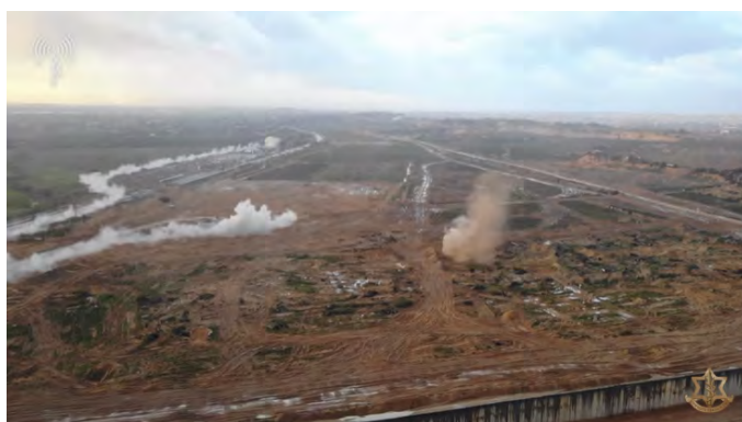
פיצוץ המנהרה (דובר צה"ל, 5 במרץ 2024)

◀ ב-5 במרץ 2024, בשעות הבוקר, השמידו כוחות צה"ל את מנהרת הטרור של חמאס שנחשפה ב-16 בדצמבר 2023. הייתה זו מנהרה בעלת מספר הסתעפויות אשר נחפרה מצפון רצועת עזה לכיוון ישראל, אך התוואי שלה לא חצה לשטח ישראל (אתר צה"ל 5 במרץ 2024).