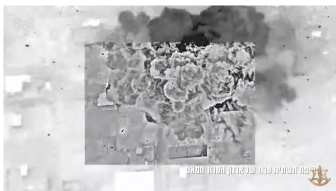
מימין: תקיפת תשתיות טרור של חמאס. משמאל: תקיפת מבנה צבאי של חמאס (דובר צה"ל, 5 במרץ 2024)