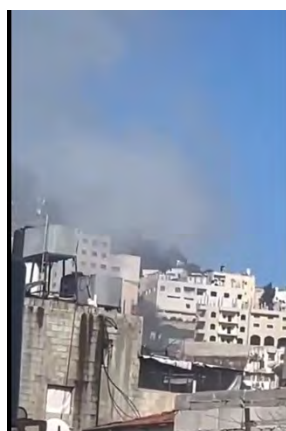
פיצוץ מטען מייצור מקומי בעת פעילות כוחות הביטחון במחנה הפליטים בלאטה