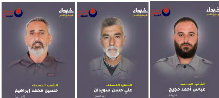
הרוגי ההגנה האזרחית בדרום לבנון (ערוץ הטלגרם של זרוע ההסברה הקרבית של חזבאללה, 4 במרץ 2024)