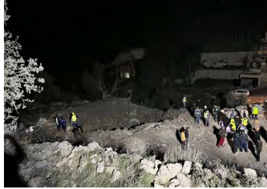
תקיפה בח'רבת סלם (חשבון X של אלאח'באר, 9 במרץ 2024)