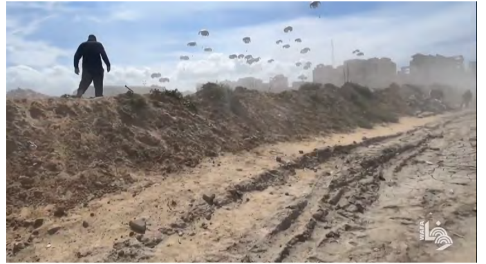
הצנחת סיוע בצפון הרצועה והסתערות התושבים על הסיוע (ערוץ היוטיוב של ופא, 9 במרץ 2024)