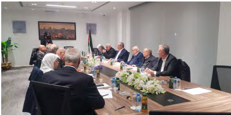
כינוס הוועדה המצומצמת במשרדו של חסין אלשיח' בראמאללה (ופא, 9 במרץ 2024)

◀ חסין אלשיח', מזכיר הוועד הפועל של אש"ף , כינס במשרדו בראמאללה את הוועדה המצומצמת של חברי הוועד הפועל וחברי הוועד המרכזי של פתח, אשר על הקמתה הוחלט לאחרונה בכינוס ההנהגה הפלסטינית. בישיבה דנו חברי הוועדה בדרכים להפסקת המלחמה ברצועת עזה, דרכי הסיוע לתושבי הרצועה ומניעת הגירתם. הוועדה החליטה להגביר את הפעילות בזירה הבינלאומית כדי להפסיק את המלחמה ברצועה ולהכניס סיוע לתושביה (ופא, 9 במרץ 2024).