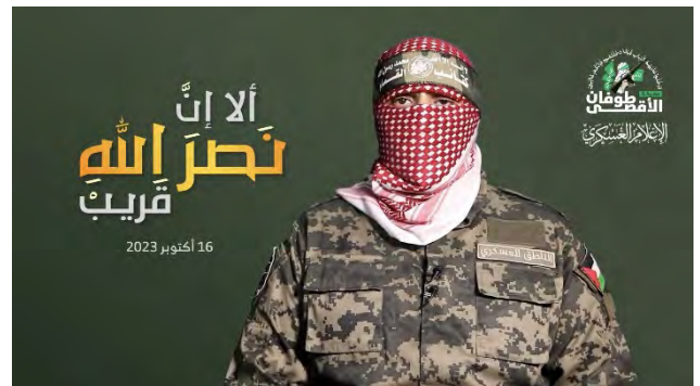
מימין: אבו עבידה בנאומו ב-16 באוקטובר 2023. משמאל: בנאומו ב-8 במרץ 2024