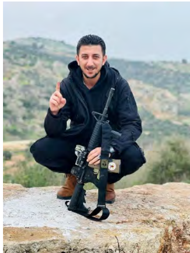
מחמד אלשלבי (חשבון X של פאלינפו, 8 במרץ 2024)

◀ בליל 9-10 במרץ 2024 פעלו כוחות הביטחון בסילת אלט'הר ואלפנדקומיה (צפונית-מערבית לשכם) שם הופעל ב-8 במרץ מטען נגד כוח צה"ל. עוד פעלו הכוחות באלבירה וביר זית (צפונית לראמאללה) שם עצרו שלושה מבוקשים (חשבון X של דובר צה"ל, 10 במרץ 2024). ב-8 במרץ 2024, לפנות בוקר, פעלו הכוחות באלסילה אלחארת'יה, צפונית-מערבית לג'נין, שם הרגו את מחמד עאדל מחמד אלשלבי, פעיל הג'האד האסלאמי בפלסטין, אשר היה מעורב בתכנון וביצוע פיגועים ביניהם פיגועי ירי, הפעלת מטעני נפץ והעברת כספים למימון פעילות טרור (חשבון X של דובר צה"ל, 8 במרץ 2024). בכלי תקשורת פלסטינים דווח, כי מחמד אלשלבי היה מבוקש ע"י ישראל וכי הוא נהרג לאחר כיתור ביתו וחילופי אש עם הכוחות במקום (חשבון X של פאלינפו, 8 במרץ 2024).