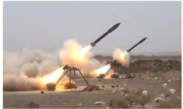
שיגור רקטות ושימוש ברחפני נפץ