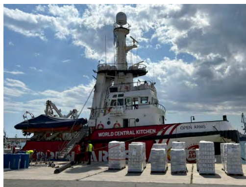
העמסת הסיוע על הספינה (חשבון X באנגלית של ארגון Open Arms, 8 במרץ 2024)

◀ מטוסים של חיל האוויר הירדני הצניחו סיוע הומניטרי במספר אתרים בצפון הרצועה, בשיתוף מטוסים אמריקאים, צרפתים, בלגים ומצרים (ערוץ אלג'ז'יד, 9 במרץ 2024).