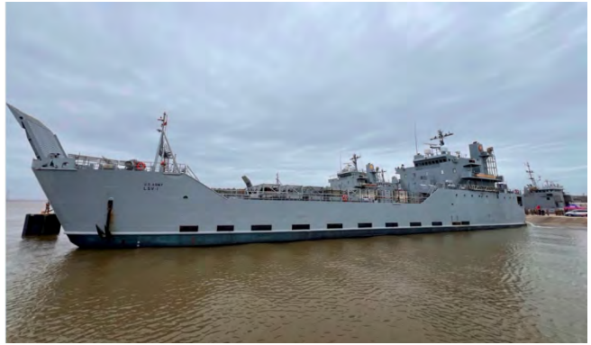
ספינת הלוגיסטיקה Besson עושה דרכה למזרח הים התיכון

◀ בתגובה לדיווחים על כוונת בידן, אמר סטפן דוז'ריק, דובר מזכ"ל האו"ם , כי הקהילה הבינלאומית צריכה להתמקד בהגדלת הסיוע ההומניטרי לרצועה דרך היבשה אך כמובן שכל דרך להכנסת סיוע לאזור מבורכת. הוא הדגיש כי כניסת סיוע דרך היבשה חסכונית בעלויות ובנפח וכי מה שנדרש הוא נקודות כניסה יבשתיות נוספות בשטח (רויטרס, 7 במרץ 2024). דיוויד קמרון, שר החוץ הבריטי , אמר כי התוכנית תיקח זמן ולכן לטענתו, על ישראל לפתוח את נמל אשדוד (רויטרס, 8 במרץ 2024).