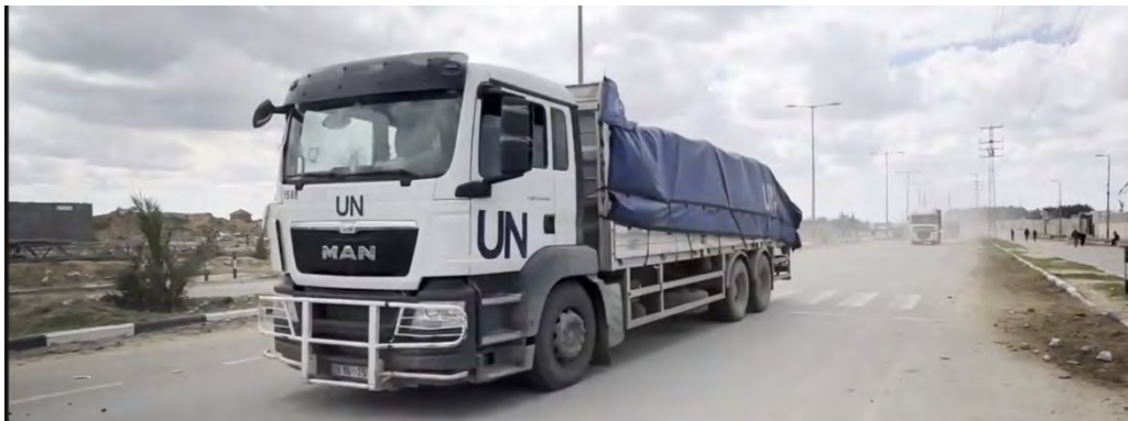
משאיות סיוע עושות דרכן לצפון הרצועה