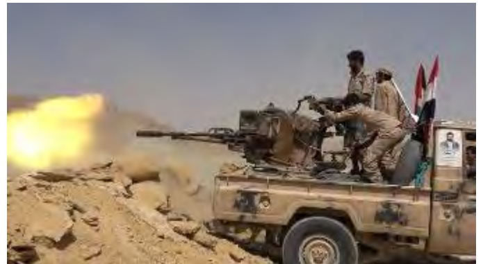
מימין: ירי ממקלע הניצב על כלי רכב שטח. משמאל: תירגול השתלטות על מוצב אמריקני. (חשבון X של ההסברה הקרבית של החות'ים, 9 במרץ 2024; אתר האינטרנט, 26 בספטמבר, 9 במרץ 2024)