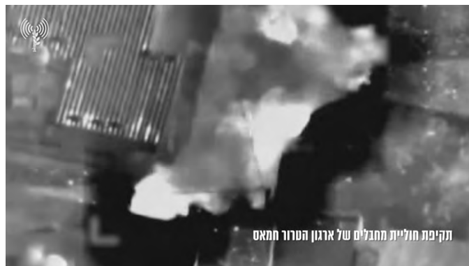
תקיפת חוליית מחבלים של ארגון הטרור חמאס