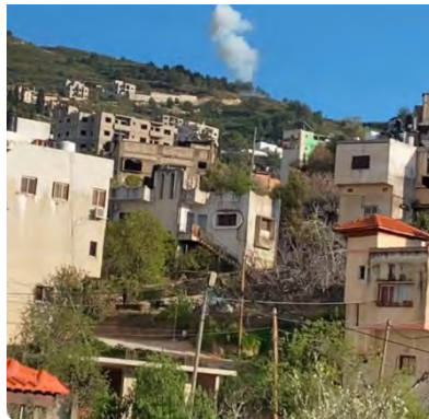
פיצוץ מטען הנפץ נגד כוח צה"ל בסילת אלט'הר

◀ ב-8 במרץ 2024, בשעות הצהריים, בוצע ירי לעבר מחסום צה"ל סמוך לחומש (צפונית-מערבית לשכם). כוח צה"ל, שהיה במקום, החל במרדף אחר מבצעי הירי ונכנס לכפר סילת אלט'הר הסמוך. עם כניסת הכוח הופעל לעברו מטען ושבעה לוחמים נפצעו, שלושה באורח בינוני ושלושה באורח קל (תקשורת ישראלית, 8 במרץ 2024).