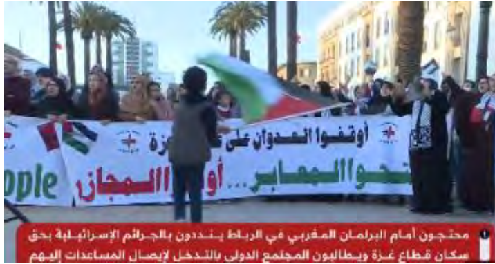
הפגנת תמיכה בעזה מול בנין הפרלמנט המרוקאי (ערוץ אלערבי, 9 במרץ 2024)