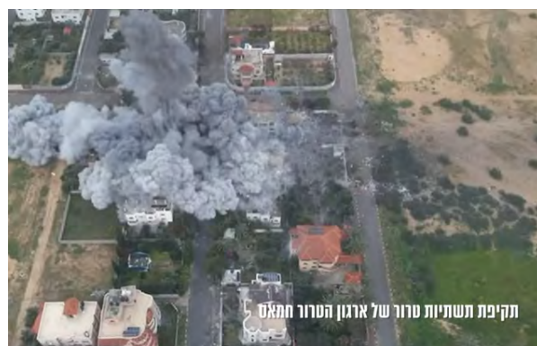
תקיפת תשתיות טרור של ארגון הטרור חמאס