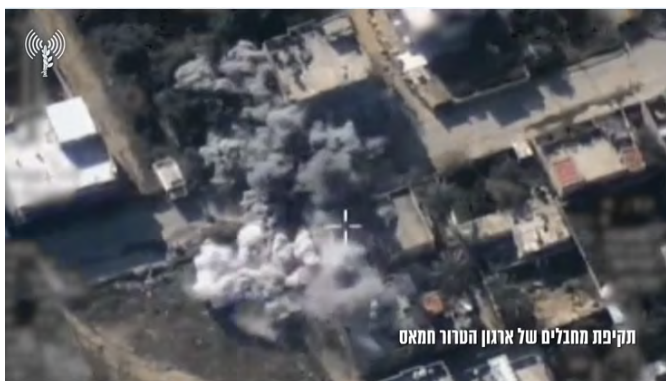
תקיפת מחבלים של ארגון הטרור חמאס