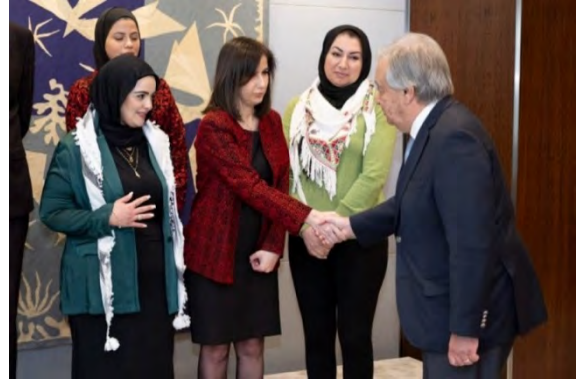
המשלחת הפלסטינית בפגישה עם מזכ"ל האו"ם ובמסיבת עיתונאים בתום הביקור (אלקדס אלערבי, 7 במרץ 2024)