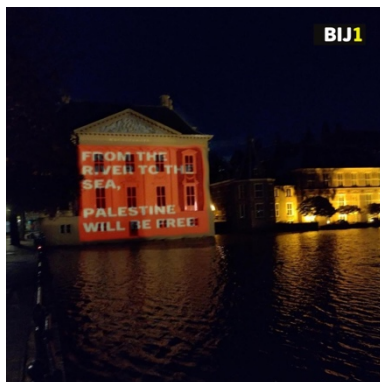
הקרנת הסיסמה "מהנהר ועד הים" בהאג (1 בנובמבר 2023)