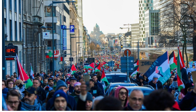
הפגנה בבריסל (חשבון X של ABP, 18 בדצמבר 2023)

◀ מאמר שפורסם במגזין של ABP התנגד לסיווג של מתקפת ה-7 באוקטובר כ"טרור" ודחה את זכותה של ישראל להגנה עצמית. לפי המאמר, ההתמקדות בסוגיית הטרור היא "דרך להפוך את חמאס לאב טיפוס של האויב ולהפוך את הכובש הישראלי לדמות מכובדת". עוד נטען כי "קשה לישראל לטעון שהיא פועלת מתוך הגנה עצמית כאשר היא עצמה מזינה תוקפנית" וכי "על אף שישראל הסיגה את ההתנחלויות שלה מעזה ב-2005, היא ממשיכה לשלוט צבאית על השטח הזה. כתוצאה מכך, לפי החוק הבינלאומי, היא הכוח הכובש בעזה" (אתר ABP, 12 בינואר 2024).