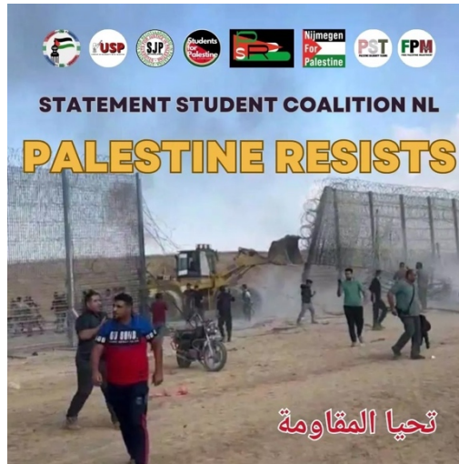
הצהרת ארגוני הסטודנטים לאחר ה-7 באוקטובר (חשבון הפייסבוק של סטודנטים למען פלסטין, 10 באוקטובר 2023)

בסולידריות נגד הדיכוי הברוטלי, המתמשך מצד המשטר הציוני" (חשבון הפייסבוק של סטודנטים למען פלסטין, 10 באוקטובר 2023).