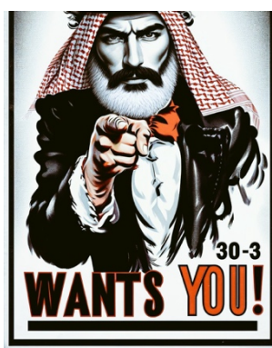
כרזת גיוס לתנועת 30 במרץ (חשבון X של התנועה, 12 בפברואר 2024)

◀ "בריסל נגד רצח עם" הוא קולקטיב פעולה שהוקם באוקטובר 2023 ואשר כולל "אנשים מוטרדים ופעילים אנטי קולוניאליסטים שרצו לשלב כוחות ומשאבים כדי לתמוך בתושבי עזה ופלסטין". הקבוצה הקימה קרן מיוחדת שנועדה לסייע לפעולות וליוזמות שיוצאות נגד "משטר האפרטהייד של ישראל בכל פלסטין" ואשר מקדמות את החרם והסנקציות על ישראל ולממן פעילויות של פלסטינים בבריסל ושל קולקטיבים פלסטינים שפועלים בעזה (13 בנובמבר 2023, Stued.info).