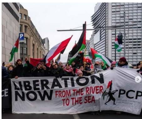
הפגנה של הוועדה העממית של פלסטין (חשבון האינסטגרם של PCP, 8 בפברואר 2024)

(חשבון אינסטגרם של PCP, 12 בפברואר 2024). הארגון משתמש בסיסמאות של "תחי ההתנגדות הפלסטינית", "מהים ועד נהר הירדן" ו"אינתיפאדה עד הניצחון" (חשבון האינסטגרם של PCP, תאריכים שונים בינואר-פברואר 2024).