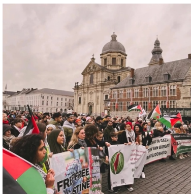
הפגנה בגנט