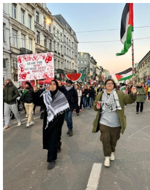
הפגנה באנטוורפן

◀ במסגרת ההפגנות שקיים הסניף באנטוורפן, הוא קרא לממשלת בלגיה ולאיחוד האירופי לפעול להשגת הפסקת אש קבועה ולהסיר את המצור מעל רצועת עזה, ובמקביל לשחרר "אסירים פוליטיים" מבלי להתייחס לחטופים, לחקור פשעי מלחמה והבאת פושעי מלחמה לבית הדין הפלילי הבינלאומי, לאסור על ייצוא ציוד צבאי לישראל ולנקוט ב"צעדים מחייבים נגד ישראל כדי לסיים את המדיניות של כיבוש, קולוניאליזציה ואפרטהייד" (דף הפייסבוק של הסניף, 29 בנובמבר 2023).