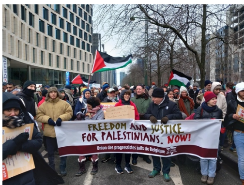
מפגינים של UPJB (דף הפייסבוק של EAJ, 21 בינואר 2024)

◀ תנועת חיי נשים, יחד עם עשרות ארגונים פמיניסטיים וארגונים של החברה האזרחית ועשרות פעילות, שפרסמו מכתב משותף לציון יום האישה הבינלאומי ובו הביעו תמיכה "בנשות עזה שסובלות מדיכוי", מבלי להתייחס כלל למעשי האונס והאלימות המינית שביצעו מחבלי חמאס ב-7 באוקטובר ולחטופות שעדיין מוחזקות בעזה (RTBF, במרץ 2024).