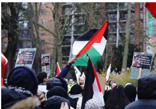
הפגנה של שרלורואה למען פלסטין (אתר הפלטפורמה, 22 בדצמבר 2023)

◀ מאז ה-7 באוקטובר, הובילה הפלטפורמה הפגנות בשרלורואה, בשיתוף עם הקהילה הפלסטינית המקומית, שבהן נישאו שלטים שעליהם נכתב "תחי ההתנגדות". כמו כן, התקיימו פעולות מחאה נגד מפעלים המזוהים עם חברת אלביט מערכות הישראלית. הפלטפורמה גם דרשה "להסיר את חמאס, הג'האד האסלאמי בפלסטין, חזבאללה, החזית העממית לשחרור פלסטין וארגוני התנגדות אחרים מהרשימה האירופית של ארגוני הטרור" (אתר הפלטפורמה, 3 בדצמבר 2023).