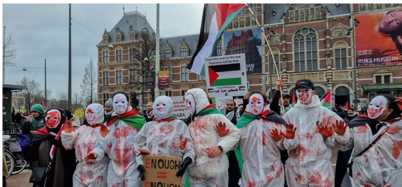
הפגנה של הקהילה הפלסטינית באמסטרדם (דף הפייסבוק של PGNL, 13 בינואר 2024)

◀ הוועדה הפלסטינית של הולנד (NPK) הוקמה בשנת 1969 במטרה "לחזק את הסולידריות עם הפלסטינים". הארגון משתתף בתנועת ה-BDS ופועל על בסיס חזון של מדינה דו-לאומית פלסטינית-יהודית עם זכות השיבה ופיצוי לפליטים הפלסטינים. הוועדה גם מביעה תמיכה "במאבק הפלסטינים נגד הפרויקט הציוני בפלסטין" (אתר הוועדה הפלסטינית של הולנד, ללא תאריך).