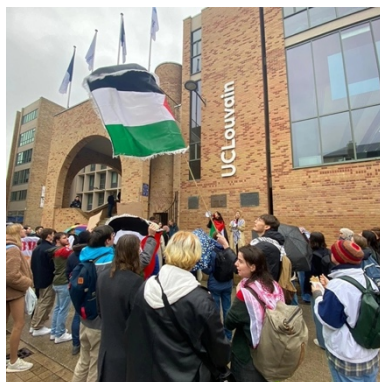
הפגנת סטודנטים באוניברסיטת לון (דף הפייסבוק של Comac, 14 בפברואר 2024)

◀ ארגון בולט נוסף שפועל תחת מטריית ה-ECCP בבליגיה הוא המרכז הלאומי לשיתוף פעולה בפיתוח (CNCD-11.11.11), ארגון גג שהוקם בשנת 1966 ואשר מונה יותר משבעים ארגוני סולידריות בלתי ממשלתיים ותנועות סולידריות אזרחיות, בהם ההתאחדות הבלגית-פלסטינית. הפעילות של הארגון מתקדמת בשלושה תחומים: תיאום קמפיינים שנועדו להעלות את המודעות לסוגיות של "אזרחות גלובלית ומאוחדת", כדוגמת צדק אקלימי, שוויון מגדרי, ביטחון תזונתי והגירה; הצבת אתגר בפני המנהיגות הפוליטית במטרה לקדם "עולם צודק ובר קיימא"; וסיוע לתוכנית פיתוח במדינות העניות (אתר CNCD, ללא תאריך).