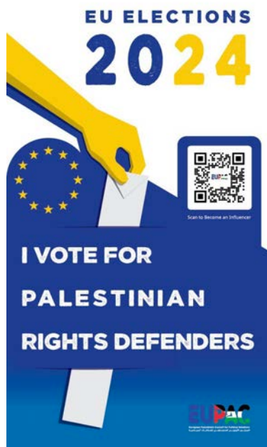
מודעה של EUPAC לקראת הבחירות לפרלמנט האירופי