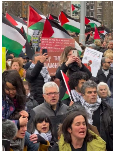
הפגנה נגד הנשיא הרצוג באמסטרדם (חשבון האינסטגרם של PGNL, 11 במרץ 2024)

ארגון הגג של הקהילה הפלסטינית בהולנד (PGNL), בהנהגתו של איאד עטא אללה (إياد عطا الله), הוקם בוועידה שהתקיימה באמסטרדם במאי 2016 כמסגרת שנועדה "להגן על זכויות הפלסטינים בהולנד" (פורטל הפליטים הפלסטינים, 13 בפברואר 2017). מלבד אירועים קהילתיים עבור הפלסטינים בהולנד, הארגון עומד מאחורי פעילויות במסגרת תנועת ה-BDS לחרם על ישראל ומארגן הפגנות ועצרות אנטי ישראליות. ב-9 באוקטובר 2023, פרסם PGNL הודעה שלא התייחסה כלל למתקפת חמאס על ישראל, אולם גינה את "התוקפנות הישראלית נגד רצועת עזה" וקראה "לפלסטינים בהולנד וביבשת אירופה להשתתף בהפגנות שנועדו להעביר את המסר של העם שלנו" (חשבון הפייסבוק של PGNL, 9 באוקטובר 2023). במרץ 2024, ארגן PGNL, יחד עם ארגונים פרו פלסטיניים ואנטי ציוניים נוספים, הפגנה גדולה נגד נשיא המדינה, יצחק הרצוג, בעת שהגיע לחנוך את מוזיאון השואה הלאומי של הולנד באמסטרדם. המפגינים הניפו שלטים שעליהם נכתב "הפסקת אש עכשיו" ו"לעולם לא שוב זה עכשיו" וקראו סיסמאות כדוגמת "שחררו את פלסטין" ו"מהנהר ועד הים, פלסטין תהיה חופשית" (Het Parool, 10 במרץ 2024).