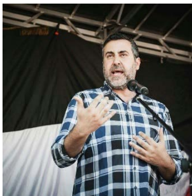
דיאב אבו ג'ה'ה (חשבון X של התנועה, 1 במרץ 2024)