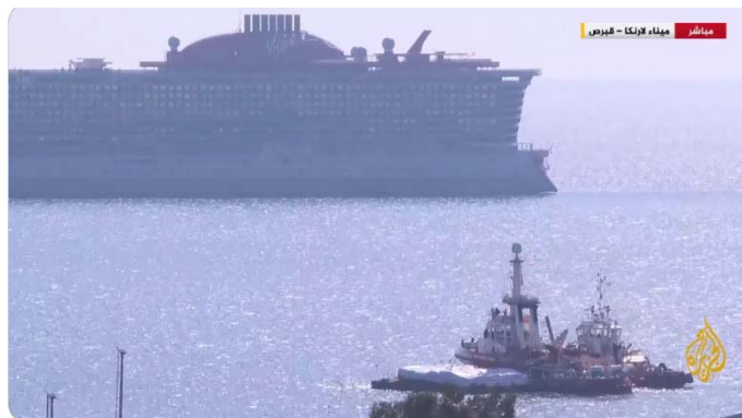
ספינת סיוע ספרדית עושה דרכה מנמל לרנקה לכיוון עזה (חשבון X של ערוץ אלג'זירה, 12 במרץ 2024)