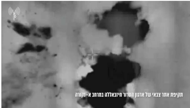
תקיפת אתר צבאי של ארגון הטרור חיזבאללה במרחב א-נקורה

◀ בנוסף, תקפו מטוסי קרב יעדי טרור של חזבאללה באזור עיתא אלשעב ואלנאקורה, ג'בין, אלטיבה שבדרום לבנון. כמו כן בוצעו תקיפות ארטילריה וירי טנקים לעבר עיתא אלשעב (דובר צה"ל, 11 במרץ 2024).