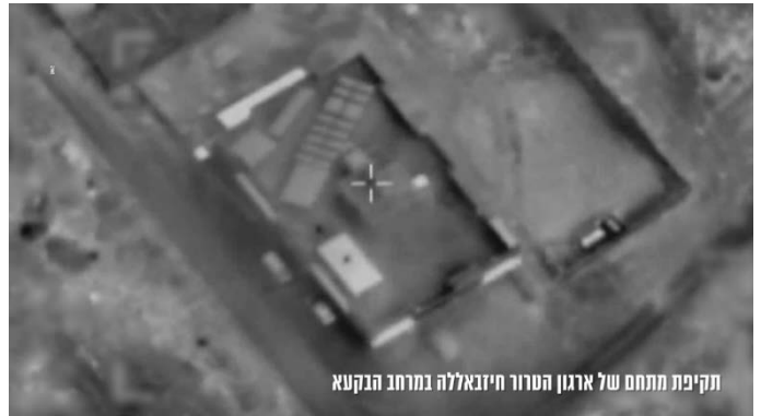
תקיפת מתחם של ארגון הטרור חיזבאללה במרחב הבקעא