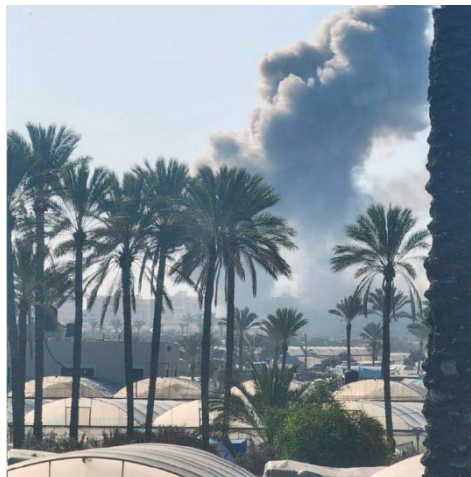
תיעוד פלסטיני של פיצוץ מבוקר שביצעו כוחות צה"ל בח'אן יונס (חשבון X של שהאב, 12 במרץ 2024)

◀ צפון ומרכז הרצועה: כוחות צה"ל המשיכו לפעול באזור. ביממה האחרונה אותרו, בהכוונה מודיעינית, מספר משגרי רקטות מהם בוצעו שיגורים לעבר ישראל. כוח צה"ל השמיד את המשגרים. באירוע נוסף, שוגרו שתי רקטות לעבר הלוחמים. הכוחות איתרו את חברי חולית השיגור וכלי טיס תקף אותם (דובר צה"ל, 12 במרץ 2024).