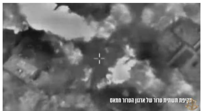
מימין: תקיפת תשתית טרור של חמאס. משמאל: תקיפת מחסן אמצעי לחימה (12 במרץ 2024)