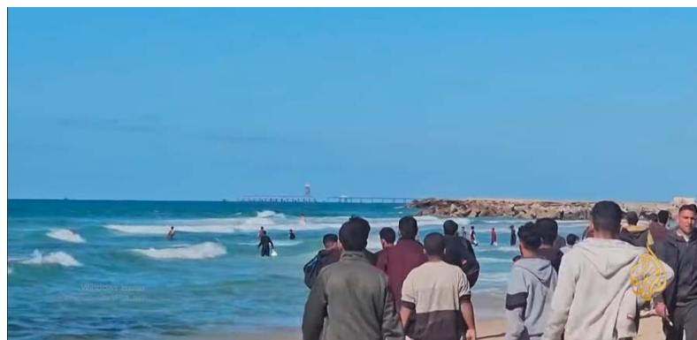
מימין: תושבי בית לאהיא נכנסים לחוף הים כדי לאתר סיוע שהוצנח בצפון הרצועה. משמאל: תושבים ממתינים על החוף לאיתור חבילות הסיוע (ערוץ היוטיוב של אלג'זירה, 11 במרץ 2024)

◀ מחמד בן זאיד, נשיא מאע"מ, שוחח עם אורסולה פון דר ליין, נשיאת הנציבות האירופית. בפגישה הדגישו השניים את חשיבות הקמת הנמל הימי כדי להעביר סיוע הומניטרי לרצועת עזה. בן זאיד מסר כי הם מעוניינים לשתף פעולה עם האיחוד האירופאי, כדי לסייע לפלסטינים. והוסיף כי יש להגיע להפסקת אש באופן מיידי ולהימנע מהרחבת הסכסוך (סוכנות הידיעות המאע"מית, 12 במרץ 2024). בשיחה עם ניקוס כריסטודולידיס, שר החוץ של קפריסין, אמר מחמד בן זאיד, כי יש לפתוח מעברים הומניטריים באופן מיידי ביבשה, בים ובאוויר, כדי לסייע לפלסטינים ולספק להם את ההגנה הנדרשת ולהבטיח שסבל הפלסטינים לא יחמיר (סוכנות הידיעות של מאע"מ, 11 במרץ 2024).