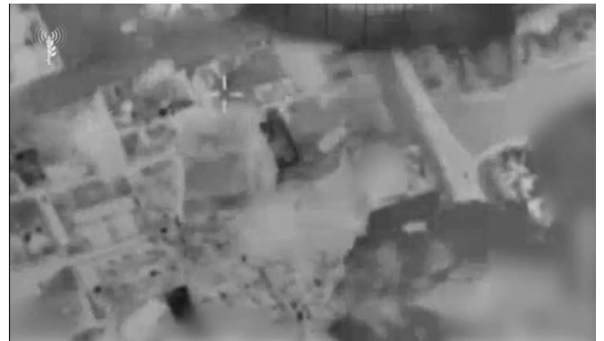
תקיפות צה"ל באזור חמד(דובר צה"ל, 11 במרץ 2024)