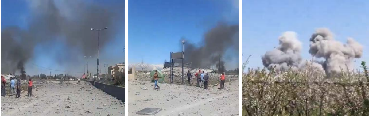
תקיפה על האוטוסטרדה במקטע ריאק - בעלבכ (חשבון X של Fouad Khreiss, 12 במרץ 2024)