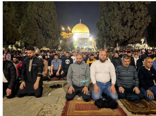
התפילה במסגד אלאקצא (מימין: קדס פרס, 11 במרץ 2024; משמאל: אתר FIMED, 12 במרץ 2024)

◀ דווח כי במסגרת צעדי האבטחה שנוקטת ישראל, לראשונה מאז 1967 הונחה גדר תיל על החומה הסמוכה למסגד אלאקצא באזור שער השבטים 1 (דף הפייסבוק של מחוז ירושלים ברשות, 11 במרץ 2024).