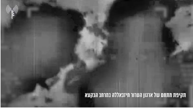
תקיפת מתחם של ארגון הטרור חיזבאללה במרחב הבקעא