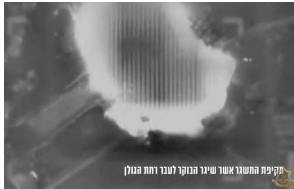
תקיפת המשגר אשר שיגר הבוקר לעבר רמת הגולן

◆ ב-12 במרץ 2024 בשעות הבוקר שוגר מטח של כשבעים רקטות לעבר רמת הגולן והגליל העליון. חזבאללה דיווח כי הם שיגרו מאה רקטות מסוג קטיושה (מטח חריג) לעבר מפקדת הגנ"א במחנה קלע, בסיס ארטיילרי ביואב ומספר פריסות ארטיילריות. זאת, כסיוע לעם הפלסטיני וכתגובה לתקיפות הישראליות כשהאחרונה שבהן הייתה באזור העיר בעלבכ בה נהרג אזרח (ערוץ הטלגרם של זרוע ההסברה הקרבית, 12 במרץ 2024). בתגובה, תקפו מטוסי קרב שלושה משגרים מהם בוצעו השיגורים (דובר צה"ל, 12 במרץ 2024). בלבנון מסרו כי צה"ל תקף בחאצביא ובכפר חולא.