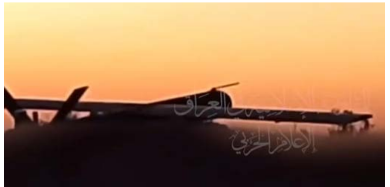
תיעוד שיגור כלי טיס בלתי מאויש לעבר נמל התעופה בן גוריון (ערוץ הטלגרם של ההתנגדות האסלאמית, 12 במרץ 2024).