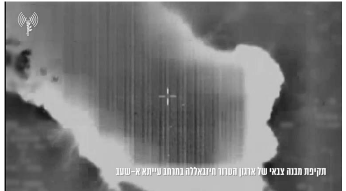
תקיפת מבנה צבאי של ארגון הטרור חיזבאללה במרחב עייתא א-שעב

מימין: תקיפה באזור עיתא אלשעב. משמאל: תקיפה באזור אלנאקורה (דובר צה"ל, 11 במרץ 2024)