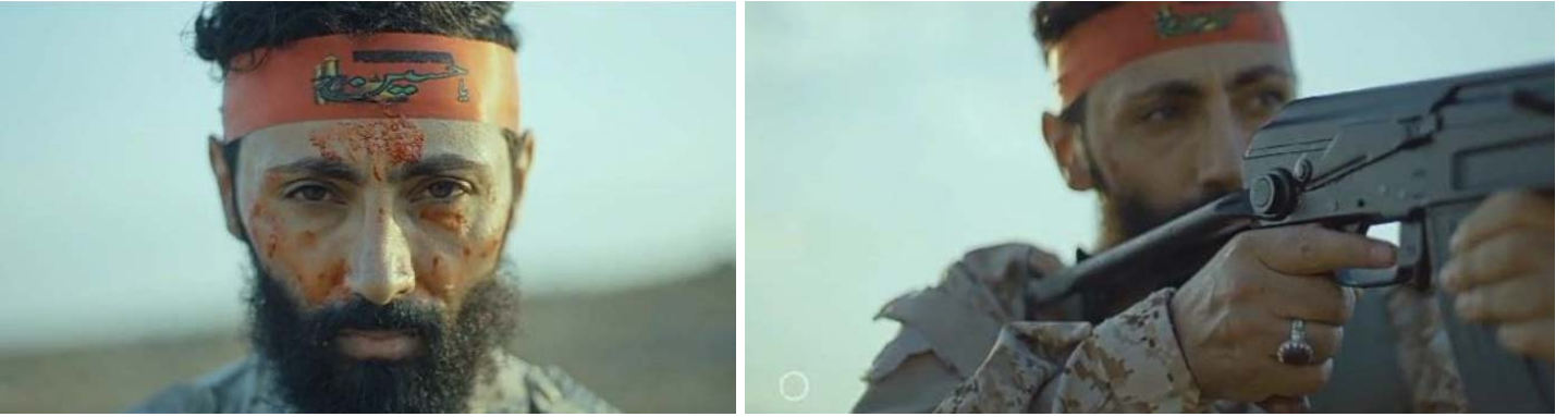
מצטפא עלי ע'ריב בעת ששיחק פעיל חזבאללה פצוע בסרטון תעמולה של הארגון (מרכז נסים, 12 במרץ 2024)