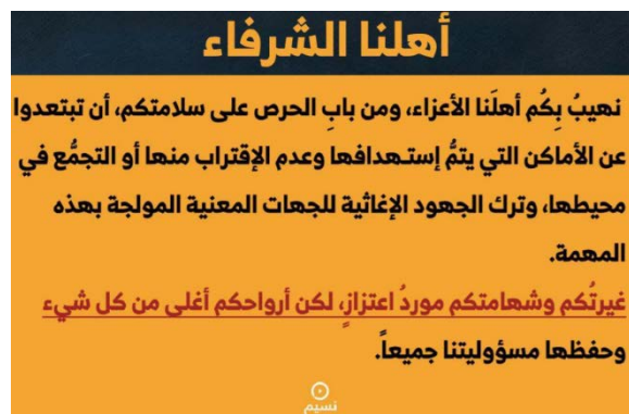
נוסח ההודעה שפורסמה (מרכז נסים, 12 במרץ 2024)

◀ בעקבות תקיפות צה"ל פרסמו ערוצי חזבאללה קריאה לכלל הציבור הלבנוני בזו הלשון: "אנשינו המכובדים, אנו מפצירים בכם, אנשינו המכובדים, מתוך שמירה על שלומכם, אנא התרחקו מהמקומות שהותקפו ואל תקרבו אליהם ואל תתקבצו בסביבתם. אנא, השאירו את המאמצים לגורמים הרלוונטיים, האמונים על משימה זו. האצילות שלכם היא מקור לגאווה, אבל חייכם חשובים מכל דבר והאחריות של כולנו היא לשמור עליהם" (מרכז נסים, 12 במרץ 2024).