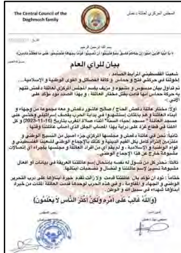
הודעת חמולת דע'מש (דף הפייסבוק של המועצה המרכזית של חמולת דע'מש, 15 במרץ 2024)