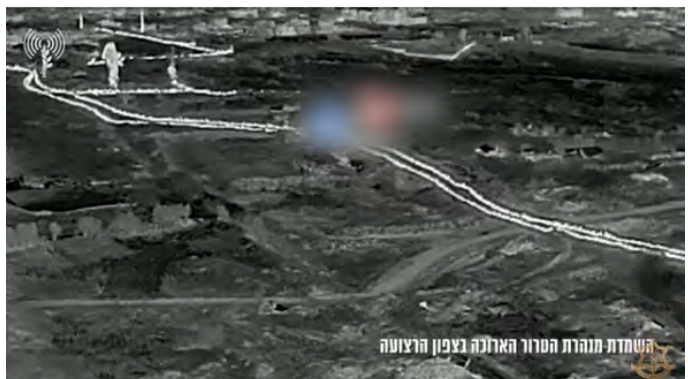
השמדת מנהרת הטרור הארוכה בצפון הרצועה

מימין: השמדת מנהרת הטרור. משמאל: תיעוד מתוך מנהרת הטרור (דובר צה"ל, 17 במרץ 2024)