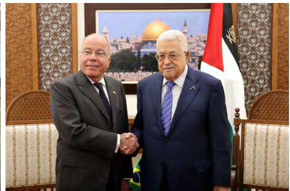
מימין: פגישת אבו מאזן עם מאורו ויירה. משמאל: פגישת אשתיה עם מאורו ויירה (ופא, 17 במרץ 2024)