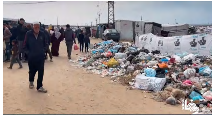
אשפה נערמת במחנה אוהלים של תושבים מפונים ברפיח

◀ על פי דו"ח של האו"ם צפוי להיות רעב בצפון הרצועה מאמצע חודש מרץ עד מאי אם לא יגיע סיוע נוסף. עוד נמסר כי מאמצע מרץ עד אמצע יולי, בתרחיש הסביר ביותר ובהנחה שהסכסוך יסלים כולל מתקפה קרקעית ברפיח, מחצית מאוכלוסיית הרצועה (1.11 מיליון איש) צפויה להתמודד עם "תנאים קטסטרופליים". בדו"ח נטען כי כדי למנוע את הרעב יש להגיע להפסקת אש ולהגדיל משמעותית את הסיוע. אנטוניו גוטרש, מזכ"ל האו"ם , אמר בתגובה לדו"ח האו"ם כי זוהי אינדיקציה מזעזעת לתנאים בשטחי הרצועה. הוא הדגיש כי המצב