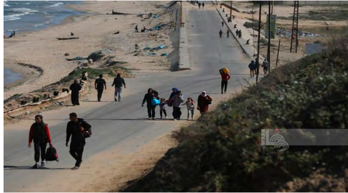
משפחות מצפון הרצועה והעיר עזה מתפנות למרכז הרצועה ולדרומה (ופא, 15 במרץ 2024)

◀ סוכנות הידיעות ופא דיווחה על משפחות מצפון הרצועה והעיר עזה, המתפנות למרכז הרצועה ולדרומה, זאת בשל המחסור במזון ומצרכי יסוד באזורים אלה (ופא, 15 במרץ 2024).