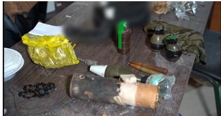
אמצעי לחימה וכספים שאותרו בלשכת מנהל בית החולים אלשפאא' בעזה (דובר צה"ל, 18 במרץ 2024)