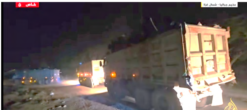
משאיות סיוע נכנסות בפעם הראשונה לצפון הרצועה