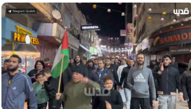
התהלוכה בטולכרם (מימין) וההפגנה בראמאללה