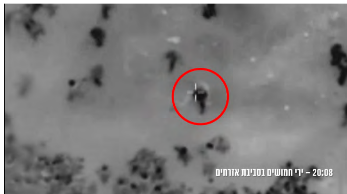
תיעוד חמושים פלסטינים יורים בסביבת האזרחים (ערוץ הטלגרם של צה"ל, 15 במרץ 2024)

◀ דובר צה"ל מסר בתגובה כי צה"ל אפשר מעבר שיירה שמנתה 31 משאיות סיוע שהכילו מזון ואספקה שיועדו לחלוקה לתושבי צפון רצועת עזה. לדברי הדובר, כשעה לפני הגעת שיירת הסיוע למסדרון ההומניטרי, זוהו חמושים פלסטיניים יורים בסביבת אזרחים שהמתינו לשיירה. עם כניסת המשאיות, החמושים ירו בזמן שההמון החל לבזוז את המשאיות. כמו כן, זוהו אזרחים שנפגעו מדריסה. הודגש, על בסיס תחקיר מעמיק שצה"ל ביצע, כי לא בוצע ירי מסוג שהוא לעבר התושבים באזור שיירת הסיוע בכיכר כווית (ערוץ הטלגרם של צה"ל, 15 במרץ 2024).