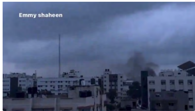
מימין: עשן מיתמר ממתחם בית החולים אלשפאא' בעזה בעקבות פעילות כוחות צה"ל (חשבון X של QUDSN, 19 במרץ 2024). משמאל: מתחם בית החולים אלשפאא' בשעות הלילה (חשבון X של שהאב, 19 במרץ 2024)