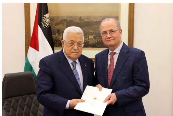
אבו מאזן מגיש לד"ר מחמד מצטפא את הצו להרכבת הממשלה (ופא, 14 במרץ 2024)

אבו מאזן, יו"ר הרשות הפלסטינית, הודיע כי מינה את ד"ר מחמד מצטפא לתפקיד ראש הממשלה הפלסטינית. זאת, במקום מחמד אשתיה (הטלוויזיה הפלסטינית, 14 במרץ 2024) בעקבות זאת, מסר לו אבו מאזן צו נשיאותי רשמי המטיל עליו את מלאכת הרכבת ממשלת הרשות הפלסטינית ה-19, זאת בהתאם לחוק יסוד הרשות המתוקן לשנת 2003 (ופא, 14 במרץ 2024). יצוין, כי חוק יסוד הרשות המתוקן לשנת 2003, סעיף מספר 65, מעניק לראש הממשלה הנבחר שלושה שבועות להרכבת הממשלה החדשה וארכה נוספת בת שבועיים במידה ולא הצליח. במידה וגם אז לא יצליח להרכיב ממשלה חדשה, אזי על יו"ר הרשות למצוא מועמד אחר תוך שבועיים (אתר maqam.najah.edu, 17 במרץ 2024).