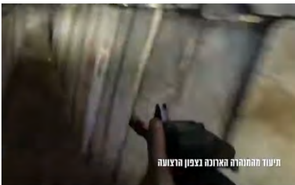
תיעוד מהמנהרה הארוכה בצפון הרצועה

◀ השמדת מנהרה בצפון הרצועה: ב-17 במרץ 2024, השמידו כוחות צה"ל מנהרת טרור של חמאס שהייתה המנהרה הארוכה ביותר שנמצאה באזור צפון הרצועה. המנהרה, שהייתה באורך של 2.5 ק"מ, חיברה את אזור הצפון עם דרום הרצועה (דובר צה"ל, 17 במרץ 2024).