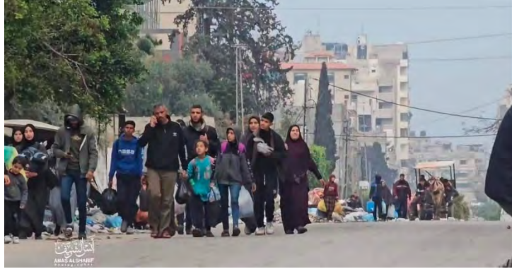
תושבים מתפנים ממתחם בית החולים אלשפאא' (חשבון X של QUDSN, 19 במרץ 2024)

◀ משרד הבריאות ברצועת עזה (הנשלט ע"י חמאס) גינה את פעילות כוחות צה"ל בבית החולים והגדיר אותה כ"פשע מלחמה", וכפעילות הנוגדת את החוק הבינלאומי. המשרד הטיל על ישראל את האחריות לחייהם של החולים ואנשי צוות רפואי השוהים במקום (דף הפייסבוק של משרד הבריאות בעזה, 18 במרץ 2024).