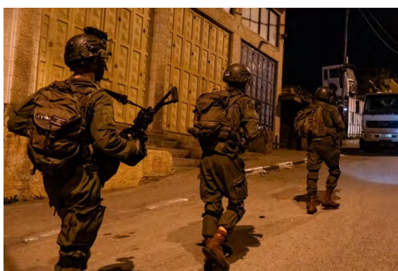
תיעוד פעילות כוחות צה"ל ביהודה ושומרון (דובר צה"ל, 17 במרץ 2024)

כוחות הביטחון המשיכו בפעילות סיכול ומנע ברחבי יהודה ושומרון. מאז תחילת המלחמה נעצרו כ-3,500 מבוקשים, מהם מעל ל-1,500 פעילי חמאס. במהלך השבוע דווח על מעצר עשרות מבוקשים והחרמת ואמצעי לחימה. מוקדי הפעילות היו חברון, יעבד, מחנה הפליטים אלדהישה בבית לחם, טולכרם ועראבה. במעבר צופים (סמוך לקלקיליה), עצרו כוחות הביטחון כלי רכב חשוד ובו ארבעה נוסעים. בחיפוש בכלי רכב נמצא באחת הדלתות מטען חבלה (חשבון X של דובר צה"ל, 15, 16, 17 במרץ 2024).