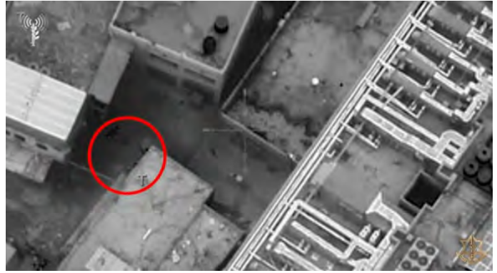
מימין: ירי לעבר כוחות צה"ל מבית החולים אלשפאא'. משמאל: הפעלת המטען לעבר הכוחות (דובר צה"ל, 18 במרץ 2024)