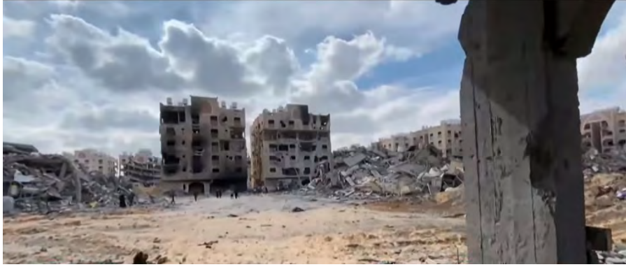
תיעוד ההרס בשכונת חמד בח'אן יונס (ערוץ היוטיוב של אלערבי, 17 במרץ 2024)

◀ ב-14 במרץ 2024, בשעות הערב, החלו דיווחים בכלי תקשורת פלסטינים לפיהם כוחות צה"ל תקפו פלסטינים שהתקבצו סמוך לכיכר אלכוית בדרום העיר עזה בהמתנה להגעת סיוע, והושמעו טענות על "טבח" שנעשה בקרב הפלסטינים. משרד הבריאות ברצועה דיווח על עשרים הרוגים ו-155 פצועים באירוע (ערוץ הטלגרם של משרד הבריאות ברצועה, 15 במרץ 2024). לשכת ההסברה הממשלתית של חמאס טענה, כי באירוע היו יותר משלושים הרוגים ויותר ממאה הרוגים ופצועים (ערוץ הטלגרם של לשכת ההסברה הממשלתית, 15 במרץ 2024). חמאס מיהרה לגנות את "הטבח" הישראלי, והאשימה את הקהילה הבינלאומית באוזלת יד ואת ארה"ב בסיוע לישראל, המאפשרים לישראל להמשיך ב"מעשי הטבח" (ערוץ הטלגרם של חמאס ביהודה ושומרון, 15 במרץ 2024).