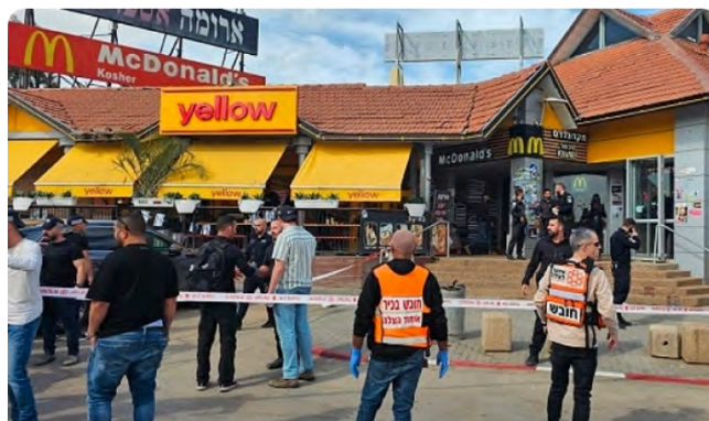
זירת הפיגוע בצומת בית קמה (אתר ערבי, 14 במרץ 2024)

הג'האד האסלאמי בפלסטין בירך על ביצוע הפיגוע, והוסיף בהודעה כי הוא תולה את יהבו בבני העם הפלסטיני בירושלים, יהודה, שומרון ובשטחי ישראל, וכי הוא בטוח שהם מחויבים למלא את חובתם הלאומית והמוסרית למרות כל ההפחדות וההתנכלויות מצד ישראל (ערוץ הטלגרם של לשכת ההסברה של הג'האד האסלאמי, 14 במרץ 2024).