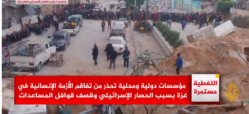
תושבים ממתינים בתור לחלוקת קמח