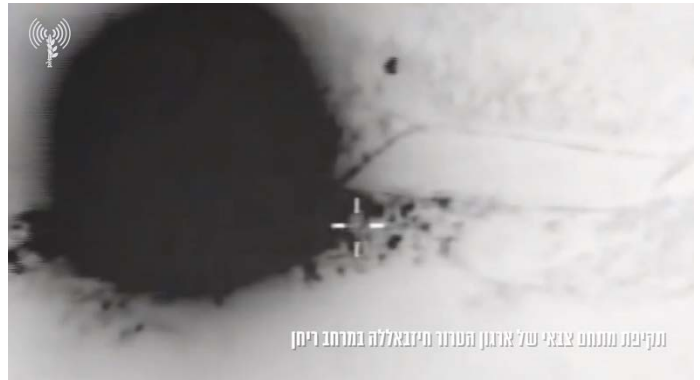
תקיפה בריחאן (דובר צה"ל, 13 באפריל 2024)

◆ 14 באפריל 2024: מבנים צבאיים באור אלח'יאם וכפרכלא. מספר מבנים במחנה השייך לכוח רצ'ואן של חזבאללה, באזור ג'בע (Jaba') שבדרום לבנון. אתר ליצור אמצעי לחימה בעיירה אלנבי שית (Al-Nabi Sheet), כ-15 ק"מ מדרום-מערב לבעלבכ. בלבנון ציינו כי בתקיפה נהרס כליל הבניין שהותקף (סוכנות הידיעות הלבנונית, 14 באפריל 2024). על-פי מקור בחזבאללה, בתקיפה נהרס אחד מהמבנים השייכים לארגון במזרח לבנון, סמוך לגבול עם סוריה. לא היו נפגעים (סוכנות הידיעות הצרפתית, 14 באפריל 2024).