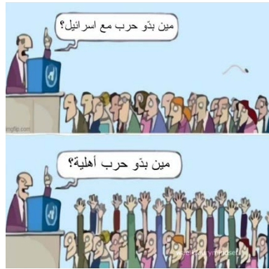
קריקטורה המתארת את ההתנגדות של הלבנונים למלחמה עם ישראל (חשבון X של Carmen Joukhadar, 9 באפריל 2024)

◀ חברת הפרלמנט ע'אדה איוב אמרה כי חזבאללה אינו מעוניין במלחמה ואינו רוצה להפסיד בה, וכי הארגון מאבד את התמיכה הנוצרית והלאומית בנושא "ההתנגדות" (חשבון X של LBCI, 8 באפריל 2024).