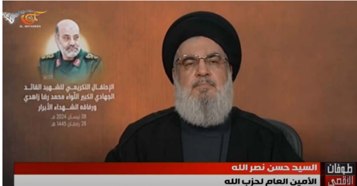
נצראללה נואם לזכרו של זאהדי (אלמיאדין, 8 באפריל 2024)

◆ הפלת כלי טיס בלתי מאויש ישראלי: חזבאללה הפיל כלי טיס ישראלי מסוג הרמס 900. ישראל ראתה בפעולה זו כחציית קווים אדומים, וחזבאללה משיב לה "מי אמר שאנחנו לא חוצים קווים אדומים?!!"