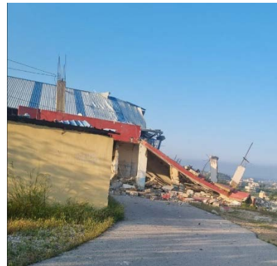
ההרס בחדר האצטדיון (חשבון X של עיתון אלאח'באר, 15 באפריל 2024)