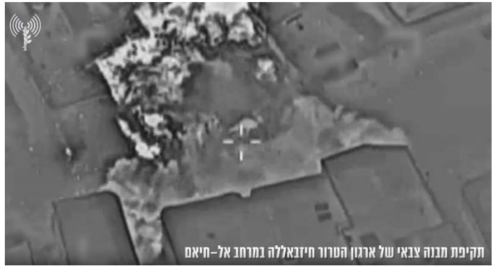
תקיפה באלח'יאם. (מימין: דובר צה"ל, 14 באפריל 2024. משמאל: חשבון X של Fouad Khreiss, 14 באפריל 2024)