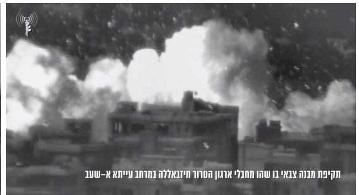
תקיפת מבנה צבאי בו שהו מחבלי ארגון הטרור חזבאללה במרחב עייתא א-שעב

מימין: תקיפה בעיתא אלשעב. משמאל: תקיפה באלח'יאם (דובר צה"ל, 10 באפריל 2024)