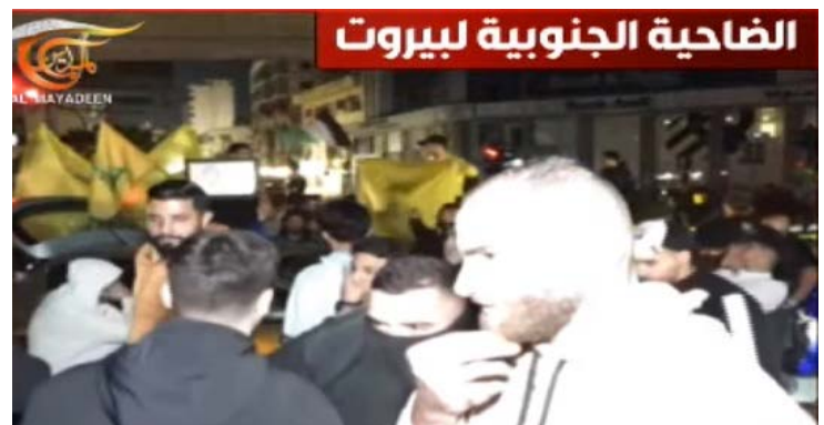
בפרבר הדרומי של בירות חוגגים את התקיפה האיראנית נגד ישראל (אלמיאדין, 14 באפריל 2024)

◀ לאחר התקיפה, פרסם חזבאללה הודעה בה בירך על "ההחלטה האמיצה של איראן להגיב לתוקפנות הציונית נגד הקונסוליה בדמשק" והדגיש כי זו זכותה הטבעית של איראן. לדברי ההודעה, המבצע השיג את מטרתו והצבאיות למרות ההתערבות ארה"ב ובעלות בריתה וכי הפעולה האיראנית תקבע שלב חדש בסוגיה הפלסטינית בדרך לניצחון הבלתי נמנע (ערוץ הטלגרם של זרוע ההסברה הקרבית, 14 באפריל 2024). ◀ משרד החוץ הלבנוני פרסם, כי הוא עוקב בדאגה רבה אחר האירועים וההתפתחויות האחרונות במזרח התיכון לאחר שהגיעו לסף תהום, זאת, לאחר יותר מחצי שנה של מלחמה ברצועת עזה וכישלון ביישום החלטה 2728 להפסקת הלחימה באזור (חשבון X של שר החוץ, 15 באפריל 2024). ◀ נמסר מפי "מקורות" כי מספר דיפלומטיים מערביים ביקשו לקיים פגישות דחופות עם בכירים לבנוניים לדיון בהשלכות התקיפה האיראנית ובאפשרות להפעלת מאמצים לקיום בחירות לנשיאות בקרוב. "המקורות" הוסיפו כי נציגויות דיפלומטיות זרות בלבנון, בעיקר אירופאיות, ניהלו מגעים נרחבים בעקבות המצב הביטחוני והדגישו את הצורך להרחיק את לבנון מכל הסלמה אזורית שעלולה להתרחש (אלאח'באר, 15 באפריל 2024).