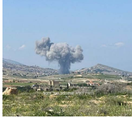
תקיפה בנבי שית (מימין חשבון X של mostaghelnevis7, 14 באפריל 2024. משמאל: סוכנות הידיעות הלבנונית, 14 באפריל 2024)

◀ כלי תקשורת בלבנון דיווחו על תקיפה מהאוויר שבוצעה בליל 14-15 באפריל 2024, נגד בית בעיירה צדיקין (Saddiqin), שבדרום לבנון וכי הבית נהרס כליל ונגרם נזק כבד לעשרות בתים סמוכים. בתקיפה נפצעו תשעה בני אדם אשר פונו לטיפול בבתי חולים בעיר צור, על ידי כוחות ההגנה האזרחית של אגודת "צופי המסר האסלאמי" (תנועת הנוער של תנועת אמל) ורשות הבריאות האסלאמית. עוד נמסר כי מטוסי קרב ביצעו תקיפות דמה בקרבת כפרים במחוז צור ובאזור החוף (דף הפייסבוק El Metn Online, 15 באפריל 2024). מאוחר יותר דווח כי התקיפה בצדיקין כוונה נגד חדר הממוקם באצטדיון הכדורגל בשכונת אלמצבח (Al-Masbah) (דף הפייסבוק Seddiqine, 15 באפריל 2024).