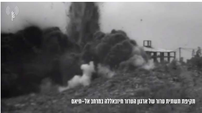
תקיפת תשתית טרור של ארגון הטרור חזבאללה במרחב אל-חיאם

◆ 10 באפריל 2024: מבנה צבאי באזור עיתא אלשעב, בו שהו פעילי חזבאללה ותשתית טרור נוספת באזור אלח'יאם.