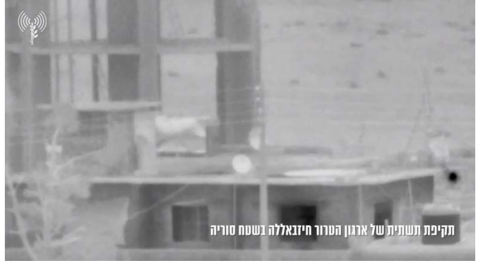
תקיפה בסוריה במרחב אלקניטרה (דובר צה"ל, 9 באפריל 2024)