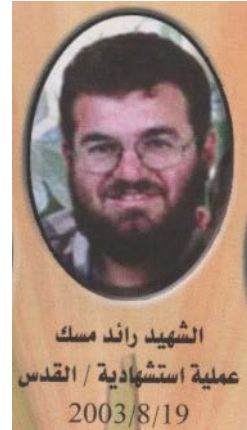
רא"ד מסכ, הטרוריסט שביצע את פיגוע קו 2, מוצג ע"י ה-"חמא"ס" כגיבור בעל תכונות נעלות.

צילום הטרוריסט שביצע את הפיגוע באוטובוס קו 2 וצילום האוטובוס לאחר הפיצוץ כפי שהופיעו בבטאון ה-"חמא"ס" "פלסטין אלמסלמה" (ספטמבר 2003). בגיליון ספטמבר הופיעו כתבות המעלות על נס את פיגוע ההתאבדות בירושלים ומהללות את הטרוריסט המתאבד שביצע את הפיגוע. בתודעה הפלסטינית הפך פיגוע טרור זה לסמל לגבורה ולהצלחה ולמופת לחיקוי.