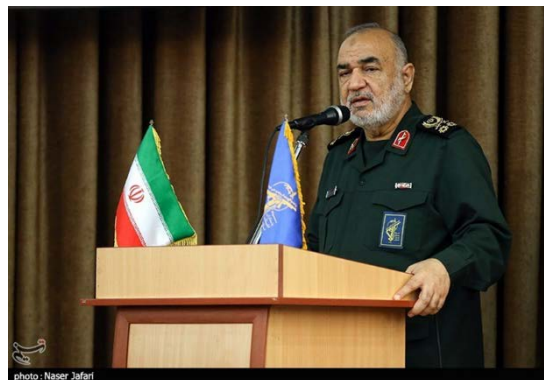
מפקד משמרות המהפכה סלאמי (תסנים, 1 במאי 2024)

◀ חסין סלאמי, מפקד משמרות המהפכה, אמר בכנס במטה משמרות המהפכה בטהראן, כי "המשטר הציוני" נחל תבוסה מודיעינית ב"מבול אלאקצא" ב-7 באוקטובר 2023 ותבוסה הרתעתית בתקיפה האיראנית על ישראל ב-13-14 באפריל 2024. הוא ציין, כי התקיפה הוכיחה שאיראן אינה חוששת מתגובות ישראל וכי ההחלטה לתקוף את ישראל התבססה על אומץ רב ועל חוכמה עמוקה והיתה החלטה חריגה ביותר, שאף משטר אחר בעולם לא היה יכול לקבל. סלאמי הוסיף, כי אילו היתה איראן מבצעת גל תקיפות נוסף, יכולתן של מערכות ההגנה האווירית של ישראל היתה פוחתת ב-50% לפחות. עוד ציין סלאמי, כי הרצון לשגר טילים לישראל יכול לחזור על עצמו וכי זו עוצמה חסרת תקדים (תסנים, 1 במאי 2024).