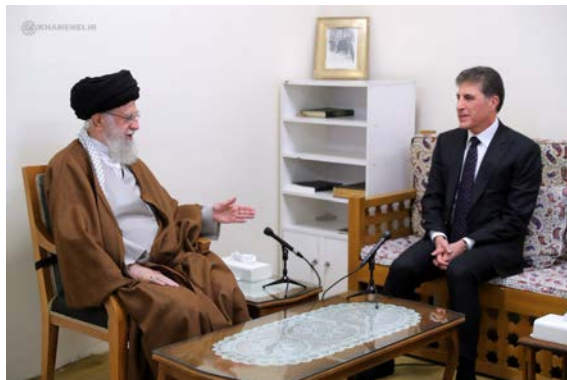
פגישת נשיא החבל הכורדי עם מנהיג איראן (אתר המנהיג, 6 במאי 2024)