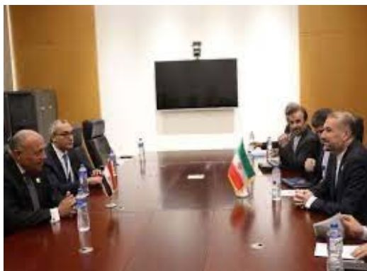
פגישת שרי החוץ של איראן ומצרים (תסנים, 4 במאי 2024)

◀ שר החוץ האיראני עבדאללהיאן שוחח עם ראש הלשכה המדינית של חמאס, אסמאעיל הניה, שעדכן אותו אודות פרטי הצעת הפסקת האש בעזה. בציוץ בחשבון ה-X שלו כתב עבדאללהיאן, כי הניה הביע את הערכתו על תמיכת איראן בפלסטין ובעזה, עדכן אותו על הסכמת חמאס להצעת הפסקת האש של מצרים וקטר וציין בפניו, כי הכדור נמצא כעת במגרשה של ישראל (חשבון X של שר החוץ, 6 במאי 2024).