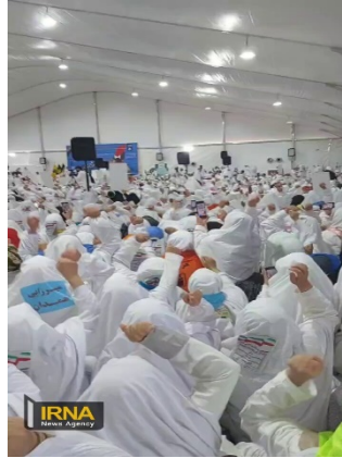
עולי רגל איראנים קוראים סיסמאות בגנות ישראל וארה"ב (אירנ"א, 15 ביוני 2024)