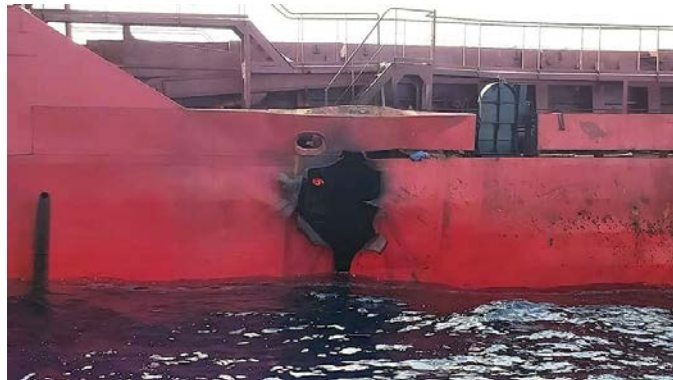
נזקי הפגיעה ב-M/V Verbena (חשבון X של אחמד פאוזי, 17 ביוני 2024)

◆ 13 ביוני: תקיפה באמצעות טילים נגד האונייה M/V Verbena בים הערבי. זוהתה פגיעה מדויקת שגרמה לדליקה על האונייה. ב-15 ביוני, מסר סריע כי האונייה טובעת במפרץ עדן. פיקוד המרכז של צבא ארה"ב (CENTCOM) אישר כי אוניית המטען M/V Verbena, בבעלות אוקראינית ונושאת דגל פלאו, נפגעה משני טילי שיוט נגד ספינות במפרץ עדן. הצוות דיווח על נזק ועל דליקה שפרצה על הסיפון. אחד מאנשי הצוות נפצע קשה ופונה באמצעות כלי מספינת הצי האמריקאי USS Philippine Sea לטיפול רפואי (חשבון X של פיקוד המרכז 13 ביוני 2024). ב-16 ביוני, דיווח פיקוד המרכז כי הצוות שלח הודעת מצוקה על נטישת האונייה אחרי שהמלחים לא הצליחו להשתלט על השריפות. אוניית מטען שהגיעה למקום פינתה את כל אנשי הצוות. פיקוד המרכז ציין כי פריגטה של חיל הים האיראני שהייתה בקרבת מקום התעלמה מקריאת המצוקה וכינה זאת "התנהגות זדונית וחסרת אחריות" (חשבון X של פיקוד המרכז, 16 ביוני 2024); ב-18 ביוני, עדכן ארגון הסחר הימי של בריטניה כי האונייה טבעה וזוהו שברים ודלק במקום שבו נראתה לאחרונה (חשבון X של ארגון הסחר הימי של בריטניה, 18 ביוני 2024).