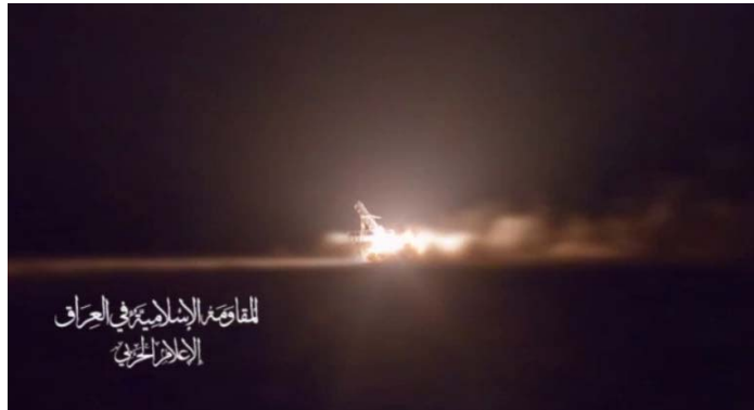
שיגור טיל שיוט לעבר "מטרה" בחיפה (ערוץ הטלגרם של ההתנגדות האסלאמית בעיראק, 15 ביוני 2024)