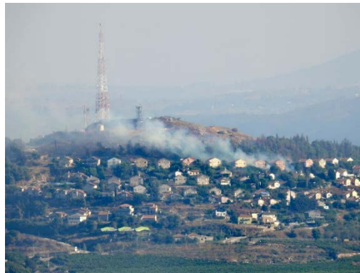
פגיעות במטולה מירי נ"ט (אלמנאר, 22 ביוני 2024)

◆ 22 ביוני: בוצעו חמש תקיפות . טילי נ"ט פגעו בבתיים במטולה ובשטח חקלאי במנרה. לא היו נפגעים (תקשורת ישראלית, 21 ביוני 2024).