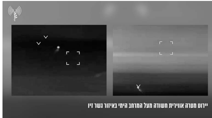
יירוט מטרה אווירית באזור גשר הזיו (ערוץ הטלגרם של דובר צה"ל, 18 ביוני 2024)

◆ 18 ביוני 2024: בוצעו שבע תקיפות . פגיעת נ"ט בשטח פתוח במטולה; נפילת רקטות בשטחים פתוחים במנרה; יורטה מטרה אווירית חשודה מעל הים מול גשר הזיו. לא היו נפגעים בכל המקרים (ערוץ הטלגרם של דובר צה"ל ותקשורת ישראלית, 18 ביוני 2024).