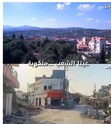
מימין: עיתא אלשעב, לפני ואחרי; משמאל: עיתרון, לפני ואחרי (חשבון X של אביחי אדרעי, 24 ביוני 2024).