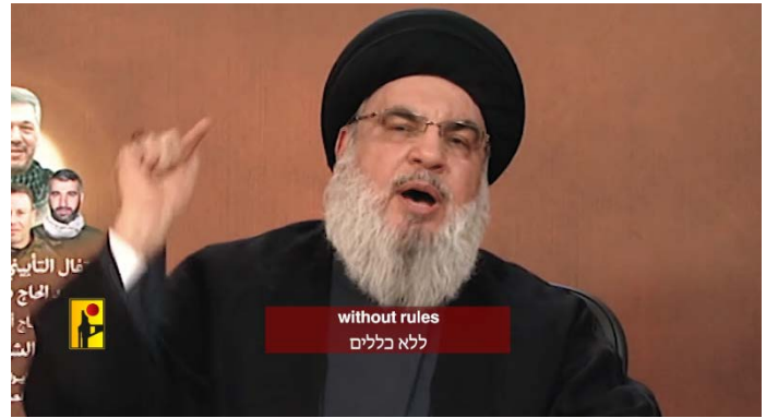
מתוך סרטון האיום (ערוץ הטלגרם של זרוע ההסברה הקרבית של חזבאללה, 22 ביוני 2024)