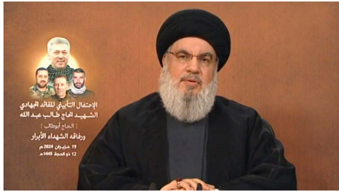
נצראללה בנאום (אלמנאר, 19 ביוני 2024)