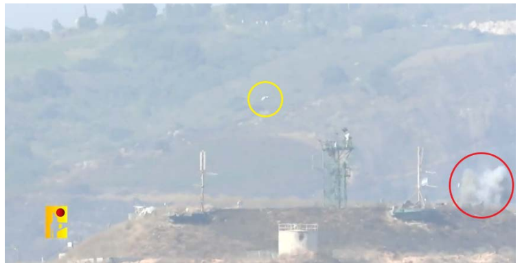
מימין: פגיעת רחפן FPV וכלי טיס בלתי מאויש של חזבאללה בקרבת מוצב נרקיס; משמאל: מערכת "Drone Dome" שהייתה היעד לתקיפה (ערוץ הטלגרם של זרוע ההסברה הקרבית של חזבאללה, 21 ביוני 2024)