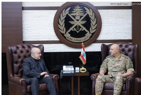
עון עם שגריר איראן (חשבון X של צבא לבנון, 19 ביוני 2024)

מפקד צבא לבנון, גנרל ג'וזף עון, נועד עם שגריר איראן בלבנון, מג'תדא אמאני, ועם הנספח הצבאי האיראני, באלא זאדה, ודן עמם במצב בלבנון ובאזור (חשבון X של צבא לבנון, 19 ביוני 2024).