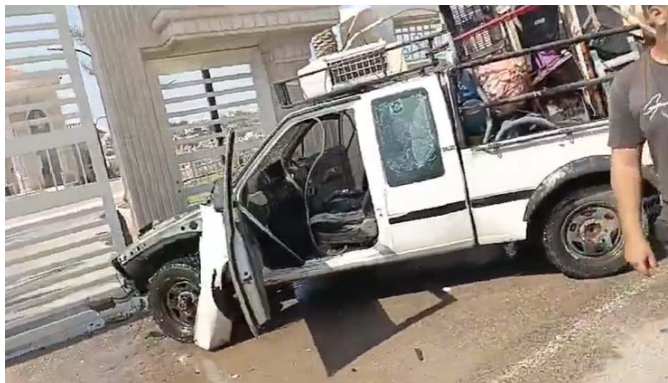
הטנדר שהותקף (אלאח'באר, 20 ביוני 2024)

◀ ב-20 ביוני, דיווחו כלי תקשורת בלבנון כי כלי טיס ישראלי תקף טנדר שנסע באזור העיירה חאנויה (Hanaouay) שבאזור צור. שני בני אדם שהיו בכלי הרכב נפצעו קל. נמסר שאחד מהם הוא סוחר ירקות (סוכנות הידיעות הלאומית ואלאח'באר, 20 ביוני 2024).