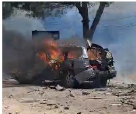
מימין: כלי הרכב עולה באש (אלאח'באר, 22 ביוני 2024). משמאל: אימן האשם ע'טמה (ערוץ הטלגרם של אלג'מאעה אלאסלאמיה בלבנון, 22 ביוני 2024)