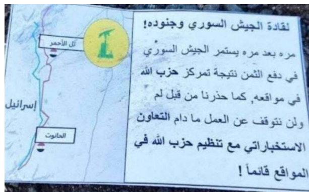
אחד מכרוזי צה"ל שפורזו במרחבים הכפריים באזור דרעא ואלקניטרה (חשבון X של Aknaf, 19 ביוני 2024)

◀ "מקורות מקומיים" במרחב הכפרי שממערב לדמשק מסרו כי חזבאללה הורה לפעיליו שלא להפעיל טלפונים ניידים כאשר הם בנסיעה ולצמצם את השימוש בהם לפרקי זמן קצרים, רק במקרים שהדבר הכרחי ביותר על-פי מרכז המעקב הסורי לזכויות אדם, אחרי הכוננות הגבוהה באזור, פריסה מחדש והסרת סממנים המעידים על נוכחות הארגון והחלפת מפקדות צבאיות, נקט חזבאללה במספר צעדים, בהם: המשך ההסתתרות, הנפת דגלים סורים מעל מספר מפקדות צבאיות והטלת איסור על מפקדיו לנוע באופן גלוי. "מקורות בלתי ממשלתיים" באזור חמץ ציינו כי האוכלוסייה האזרחית באזורים שבהם נמצאים פעילי חזבאללה מודאגת מאחר שכלי רכב חוצים במהירות גבוהה את השטחים החקלאיים מחשש לתקיפה אווירית (אלשרק אלאוסט, 19 ביוני 2024).