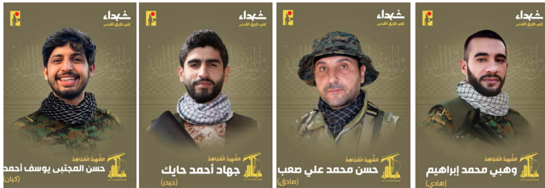
הרוגי חזבאללה (ערוץ הטלגרם של זרוע ההסברה הקרבית של חזבאללה, 17-20 ביוני 2024)