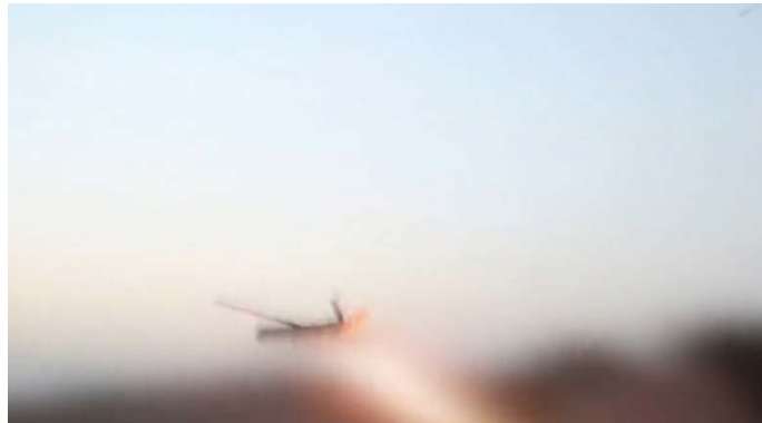
שיגור כטב"ם לעבר אילת

◆ 26 ביוני 2024 (לפנות בוקר): "מטרה חיונית" באילת באמצעות כטב"מ. דובר צה"ל מסר כי כטב"ם שהתקרב לשטח ישראל מכיוון הים האדום נפל בים ליד אילת. כוחות צה"ל עקבו אחרי הכטב"ם ושיגרו לעברו מיירט והוא לא נכנס לתחומי ישראל (דובר צה"ל, 26 ביוני 2024).