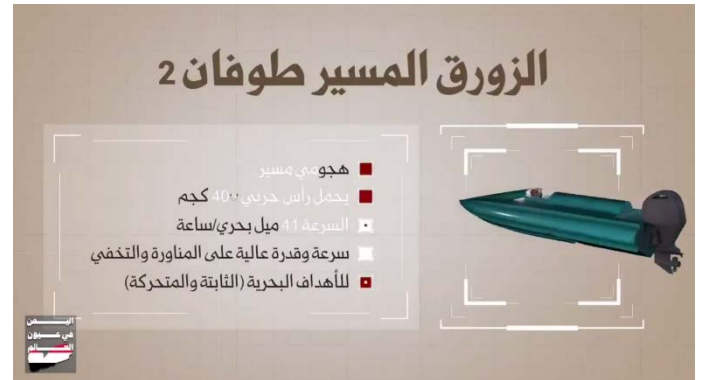
מימין: נתוני "טופאן 2"; משמאל: נתוני "עטצף 3" (ערוץ הטלגרם של הכוחות החות'יים, 21 ביוני 2024)