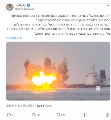
פרסומים בעברית של חזאם אלאסד (חשבון X של חזאם אלאסד 19-24 ביוני 2024)