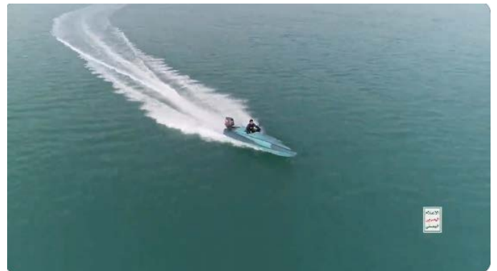
מימין: מפעיל משיט את ה"טופאן 1"; משמאל: נתוני ה"טופאן 1" (חשבון X של יחיא סריע, 21 ביוני 2024)