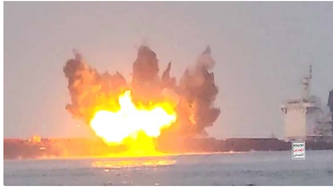
תיעוד פגיעה באונייה M/V Tutor (חשבון X של הכוחות החות'ים, 19 ביוני 2024)

• מנהיג החות'ים, עבד אלמלכ אלחות'י, אמר בנאומו השבועי כי הכוחות החות'ים פגעו באונייה באמצעות כשב"מ. לאחר מכן, הצליחו הכוחות לעלות על האונייה, מלכדו אותה ופוצצו אותה (חשבון X של הכוחות החות'ים, 20 ביוני 2024).