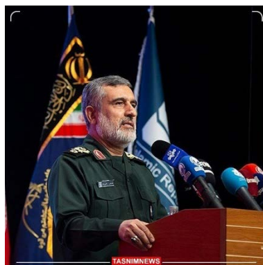
אמיר-עלי חאג'יזאדה (תסנים, 22 ביוני 2024)

• מפקד זרוע האוויר והחלל במשמרות המהפכה, אמיר-עלי חאג'יזאדה, אמר בכנס שעסק בתקיפה האיראנית נגד ישראל ב-13 באפריל 2024, כי במהלך תשעת החודשים האחרונים ישראל הצליחה רק להרוג נשים וילדים ברצועת עזה ולהשיג ניצחון טקטי, שאינו מכפר על כישלונה האסטרטגי, ולפיכך קיומה נתון בסכנה. הוא ציין כי ישראל ניסתה לכפר על כישלונה האסטרטגי בתקיפה על הקונסוליה האיראנית בדמשק, אך היא שגתה בחישוביה ובהערכתה שאיראן לא תגיב על כך (תסנים, 22 ביוני 2024).