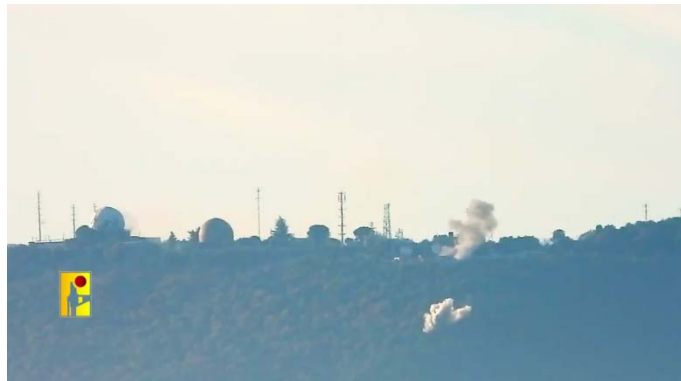
התקיפה נגד בסיס הבקרה האווירית בהר מירון בתגובה להריגת אלעארורי ערוץ הטלגרם של זרוע ההסברה הקרבית של חזבאללה, 6 בינואר 2024