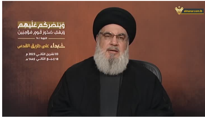
נצראללה בנאום הראשון מאז תחילת הלחימה (אלמנאר, 3 בנובמבר 2023)

◆ בנאום ב-3 בינואר 2024, ציין נצראללה כי תקיפות חזבאללה התנהלו בהתאם לאינטרסים הלאומיים הלבנוניים, אולם התריע כי כל המגבלות יוסרו אם ישראל תפתח במלחמה נרחבת בלבנון. הוא הוסיף כי הריגתו של סגן ראש הלשכה המדינית של חמאס, צלאח אלעארורי, 8 בתקיפה בפרבר הדרומי של בירות ב-2 בינואר, אשר מיוחסת לישראל, היוותה הפרה מסוכנת שלא תעבור ללא תגובה וללא עונש (אלמנאר, 4 בינואר 2024). 9 בעקבות הנאום, ציין אברהים אלאמין במאמר פרשנות כי כללי העימות שהיו בתוקף עד ה-7 באוקטובר התפרקו וכי ישראל מנסה לקבוע כללים חדשים בשטח. בהתייחסו לאמירת נצראללה כי מלחמה כוללת תתקיים ללא מגבלות, ציין אלאמין כי המשוואה "לא תהיה בניין נגד בניין, אלא עשרות אלפי הרוגים אצל ישות האויב מול אלפי מתים בלבנון". הוא הוסיף כי נאום נצראללה נועד לשלוח מסר ברור כי "ההתנגדות" בלבנון לא תקבל את הכללים החדשים וכי הריגת אלעארורי מצריכה תגובה שתשיב את ההרתעה למקומה (אלאח'באר, 4 בינואר 2024).