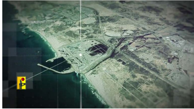
מתוך הסרטון "הומבין יבין" (ערוץ הטלגרם של זרוע ההסברה הקרבית של חזבאללה, 22 ביוני 2024)

◀ בהקשר זה, יש לציין כי גם איראן והארגונים המשתייכים ל"חזית ההתנגדות" בהובלת איראן הציגו מסרים שנועדו לסייע לשמור על "משוואת ההרתעה" לנוכח האפשרות של מלחמה בין ישראל לבין חזבאללה. משלחת איראן לאו"ם ציינה כי אם ישראל תחל ב"תוקפנות" צבאית רחבת היקף נגד לבנון, זה יביא ל"מלחמת השמדה", וכי "כל האפשרויות, כולל מעורבות מלאה של כל חזיתות ההתנגדות, נמצאות על השולחן" (חשבון X של משלחת איראן באו"ם, 29 ביוני 2024); מזכ"ל המיליציה העיראקית כתאא'ב סיד אלשהדאא', אבו אלאא' אלולאא', הזהיר כי אם ישראל תנקוט בצעד "טיפשי" ותפתח במלחמה נגד לבנון, ההתנגדות האסלאמית בעיראק תעבור ללחימה "מטווח אפס" נגד ישראל. הוא ציין כי כעת ההתנגדות האסלאמית בעיראק משתתפת בקרב "מבול אלאקצא" ממרחק של יותר מ-800 ק"מ, אולם המרחק הגיאוגרפי יתבטל וההתנגדות תשתמש בכל הארסנל הצבאי שלה ותפגע בדיוק רב יותר (חשבון X של אבו אלאא' אלולאא', 25 ביוני 2024).