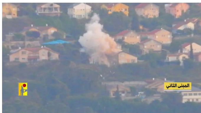
תקיפה נגד מבנה אזרחי במטולה (ערוץ הטלגרם של זרוע ההסברה הקרבית של חזבאללה, 9 במאי 2024)

◆ ב-5 במרץ 2024, קיבל חזבאללה אחריות על ירי לעבר בניין בקריית שמונה, וזאת בתגובה "לתקיפות הישראליות על הכפרים ובתי האזרחים האיתנים בדרום, ובמיוחד הפגיעה בבית אזרחי ומותם של אישה, בעלה ובנם בעיירה חולא" (ערוץ הטלגרם של זרוע ההסברה הקרבית של חזבאללה, 5 במרץ 2024).