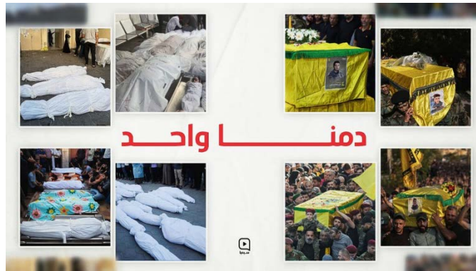
כרזה של קמפיין "אחדות הזירות והדם" תחת הכותרת "דמנא אחד" (סימא, 7 בנובמבר 2023)