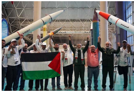
פגישת חאג'יזאדה עם משפחות הרוגי המלחמה בעזה (snn.ir, 1 ביולי 2024)

• ב-1 ביולי 2024, הגיעה משלחת של משפחות הרוגים פלסטינים מהמלחמה ברצועה עזה לביקור באיראן. מפקד זרוע האוויר של משמרות המהפכה, אמיר-עלי חאג'יזאדה, אמר במפגש עמן כי איראן מצפה להזדמנות להוציא לפועל תקיפה נוספת נגד ישראל, כשם שעשתה ב-13 באפריל 2024. הוא ציין כי אין ספק בניצחונו הסופי של העם הפלסטיני, וכי איראן תמשיך לעמוד לצד "ההתנגדות" והעם הפלסטיני ותעשה ככל שביכולתה כדי לתמוך בפלסטינים. הוא הוסיף כי התנאים אינם מאפשרים לאיראן לפעול ישירות נגד ישראל (snn.ir, 1 ביולי 2024).