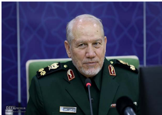
יועצו הצבאי הבכיר של מנהיג איראן, יחיא רחים צפוי (defapress.ir, 30 ביוני 2024)

המדינות משלימות זו את זו מבחינה גיאוגרפית, גיאואסטרטגית, גיאוא-כלכלית וגיאוא-תרבותית, וכי שתיהן חולקות אסטרטגיה משותפת של תמיכה בתושבי עזה. צפוי הוסיף כי למעלה מ-80 אלף סטודנטים עיראקיים לומדים כיום באוניברסיטאות באיראן, וכי איראן מוכנה להעמיד לרשות עיראק ידע וניסיון בתחומי מדע שונים, ובהם טכנולוגיה, כלכלה והגנה, וכן לסייע לה בתחום הטכנולוגיה הגרעינית לצרכי שלום (defapress.ir, 30 ביוני 2024).