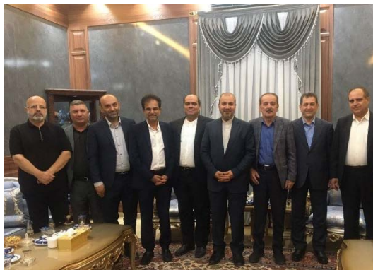
פגישת אנשי תקשורת ועיתונאים עיראקים עם שגריר איראן בבגדאד (אירנ"א, 1 ביולי 2024)

◆ ב-1 ביולי 2024, נפגשה משלחת של אנשי תקשורת ועיתונות עיראקים עם שגריר איראן בבגדאד, מחמד כאט'ם אאל צאדק, ודנה עימו בהרחבת שיתוף הפעולה התרבותי והתקשורתי בין שתי המדינות (אירנ"א, 1 ביולי 2024).