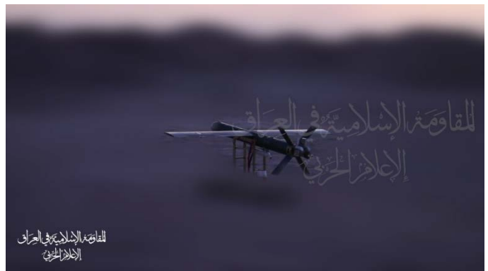
שיגור כטב"ם לעבר אילת (ערוץ הטלגרם של ההתנגדות האסלאמית בעיראק, 1 ביולי 2024)