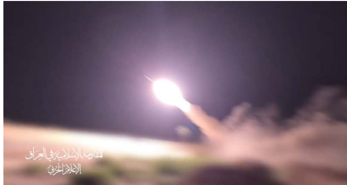
שיגור טיל שיוט לעבר "מטרה חיונית" בחיפה (ערוץ הטלגרם של ההתנגדות האסלאמית בעיראק, 27 ביוני 2024)

◆ 2 ביולי 2024: תקיפה נגד "מטרה חיונית" בחיפה באמצעות מספר טילי שיוט. נטען שהמבצע השיג את יעדיו בהצלחה.