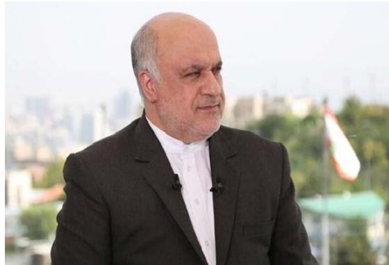
שגריר איראן בבירות (מהר, 5 ביולי 2024)

• שגריר איראן בלבנון, מג'תבא אמאני, אמר בתום הצבעתו בבחירות לנשיאות איראן בשגרירות איראן בבירות, כי איראן תמשיך לתמוך ב”התנגדות” וב”פלסטין” בכל מצב, כשם שעשתה במהלך 45 השנים האחרונות. הוא הדגיש, כי התמיכה בהן מהווה עקרון בסיסי במדיניות האיראנית ומעוגנת בחוקת הרפובליקה האסלאמית וכי היא אינה מושפעת מדבר (מהר, 5 ביולי 2024).