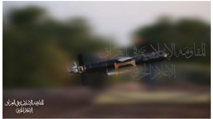
שיגור כטב"ם לעבר "מטרה חיונית" באילת (ערוץ הטלגרם של ההתנגדות האסלאמית בעיראק, 9 ביולי 2024)