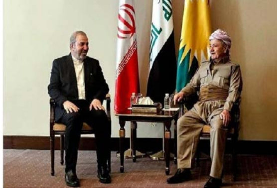
פגישת שגריר איראן בעיראק עם מסעוד בארזאני

בהסכמת הממשלה העיראקית. אולם הוא הוסיף כי "ההתנגדות" השיגה את העצמאות שלה ופועלת בהתאם לנסיבות ואיראן לא מכתובה לה דבר (דף הפייסבוק של ערוץ הטלוויזיה אלאולא, 4 ביולי 2024). • ב-4 ביולי 2024, נועד יו"ר המפלגה הדמוקרטית של כורדיסטאן, מסעוד בארזאני, בבגדאד עם שגריר איראן בעיראק, מחמד כאט'ם אאל צאדק. השניים דנו בסוגיות אזרחיות, במצב הפנימי בעיראק וביחסים הביטורליים בין המדינות (אירנ"א, 4 ביולי 2024).