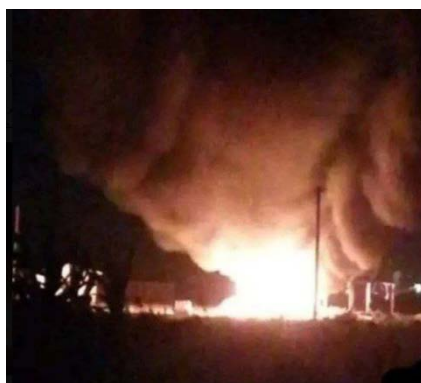
זירת התקיפה באזור באניאס (חשבון X של Alaa Al Diab, 9 ביולי 2024)

◀ "מקור צבאי סורי" דיווח כי בלילה שבין 8-9 ביולי 2024, שיגרו כלי טיס ישראליים טילים מכיוון הים התיכון לעבר יעד באזור העיר באניאס, בדרום-מערב סוריה ולחופי הים התיכון. כתוצאה מכך, נגרם נזק (משרד ההגנה הסורי, 9 ביולי 2024). ברשתות החברתיות צוין כי יעד התקיפה היה גדוד הגנה אווירית באזור ערב אלמלכ (Arab al-Mulk), כשבעה ק"מ מצפון לעיר באניאס (חשבון X של Alaa Al Diab, 9 ביולי 2024).