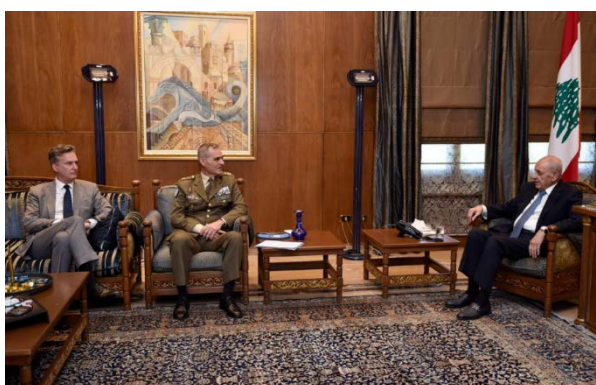
פגישת מפקד יוניפי"ל עם נביה ברי (NBN, 9 ביולי 2024)

◀ "מקורות דיפלומטיים" מסרו כי הושלמה הכנת הטייטה להארכת מנדט יוניפי"ל, שיסתיים ב-30 ביולי 2024, וכי היא תועבר ללשכת מזכ"ל האו"ם. לפי "המקורות", הטייטה דומה לנוסח ההצעה שאושרה בשנה שעברה וכי לא הוגשה שום בקשה ממדינה כלשהי לתיקון הנוסח או להכנסת שינויים בסמכויות יוניפי"ל. עוד נמסר כי הדיון במועצת הביטחון של האו"ם על החלטה 1701 צפוי להתקיים ב-24 ביולי 2024 (אלמדן, 11 ביולי 2024). ◀ ראש ממשלת המעבר בלבנון, נג'יב מיקאטי, נועד עם מפקד יוניפי"ל, ארולדו לזארו, ודן עמו במצב בקו הכחול, בשיתוף הפעולה בין צבא לבנון וכוחות יוניפי"ל ובהחלטה 1701 (אלנשרה, 9 ביולי 2024). ◀ מפקד יוניפי"ל, ארולדו לזארו, נועד עם יו"ר הפרלמנט הלבנוני, נביה ברי, ודן עמו במצב בדרום לבנון (NBN, 9 ביולי 2024).