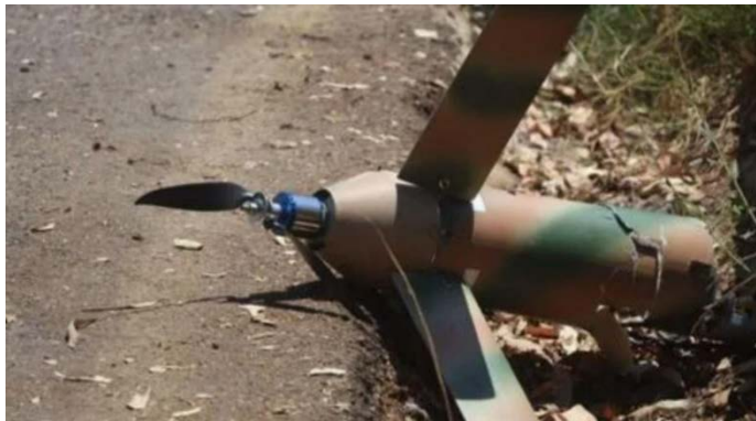
שרידי כטב"ם שאהד 101 שנפל בקיבוץ כברי (משטרת ישראל, 11 ביולי 2024)

◆ שימוש בכטב"ם בעל מנוע חשמלי: ב-11 ביולי 2024, ביצע חזבאללה תקיפה באמצעות נחיל כטב"מים לעבר הגליל המערבי. מבדיקת השרידים של אחד הכטב"מים שנפלו באזור כברי עולה כי מדובר בכטב"ם מדגם שאהד 101, מתוצרת איראן, בעל מנוע חשמלי שקט במקום מנוע רועש המבוסס על בנזין, המקשה על איתורו בשלב מוקדם (תקשורת ישראלית, 13 ביולי 2024).