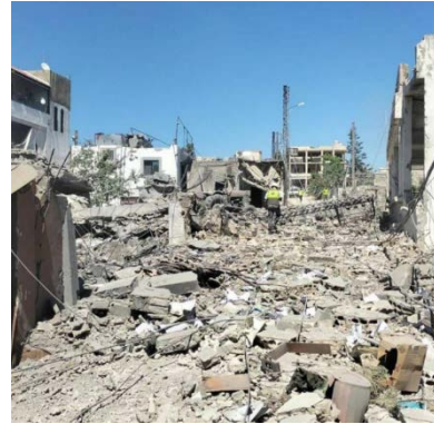
מימין: הריסות מבנה בטירחופא; משמאל: הריסות מבנה בכפרכלא (חשבון X של Fouad Khreiss, 11 ביולי 2024)