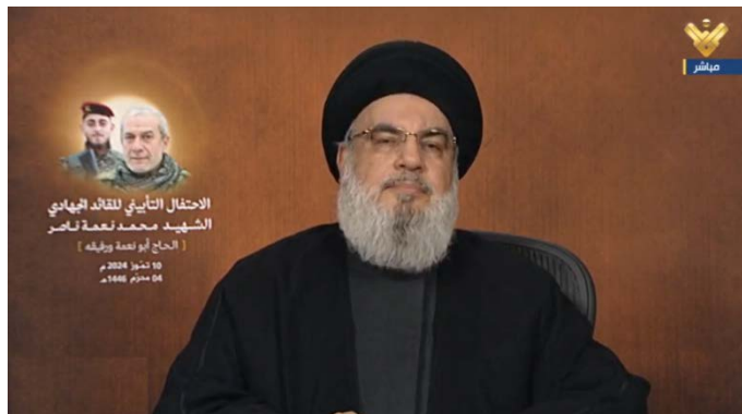
נצראללה בנאום לציון מותו של מפקד יחידת עזיז (אלמנאר, 10 ביולי 2024)

◆ הרחקת חזבאללה מהגבול: הרחקת חזבאללה למרחק של שמונה עד עשרה ק"מ מגבול ישראל-לבנון, כמו שישראל רוצה, לא תפתור את בעיותיה.