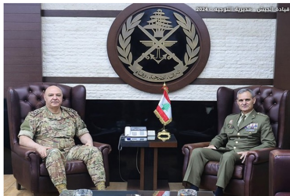
מפקד צבא לבנון עם מפקד יוניפי"ל (חשבון X של הצבא הלבנוני, 9 ביולי 2024)

מפקד צבא לבנון, גנרל ג'וזף עון, נועד עם מפקד יוניפי"ל, ארולדו לזארו. הם דנו במצב בלבנון ובאזור ובהתפתחויות בגבול בדרום לבנון (חשבון X של הצבא הלבנוני, 9 ביולי 2024).