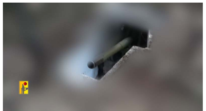
מימין: התותח בעמדה התת-קרקעית; משמאל: בית בשתולה עולה באש לאחר הפגיעה ב-11 ביולי 2024