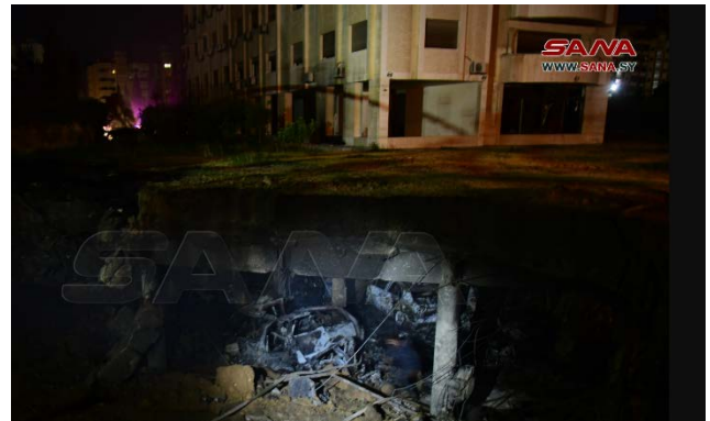
חניון תת-קרקעי שהותקף בכפר סוסה (סאנא, 14 ביולי 2024)

◀ משרד החוץ הסורי גינה את התקיפה באזור דמשק. בהודעה שפרסם המשרד, הוא מחה על המשך השתיקה הבינלאומית כלפי "הזלזול הישראלי בחוקים ובאמנות הבינלאומיים ופשעי העם ברצועת עזה". משרד החוץ