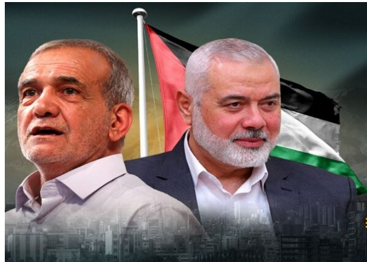
פ'זשכיאן והניה (מהר, 14 ביולי 2024)

• ב-14 ביולי 2024, שוחח פ'זשכיאן בטלפון עם הניה, ודן עימו בהתפתחויות האחרונות ברצועת עזה, ובכלל זה תקיפת צה"ל נגד ראש הזרוע הצבאית של חמאס, מחמד אלצ'יף, בח'אן יונס ב-13 ביולי. פ'זשכיאן גינה את התקיפה ואמר כי "פשע זה הוא סימן לרצונו של המשטר הציוני להמשיך ברצח העם של העם הפלסטיני ולשבור את רצון ההתנגדות". הוא הדגיש, כי איראן לעולם לא תעזוב את העם הפלסטיני לבדו בתנאים הקשים הללו, וכי ממשלתו תציב את הסוגייה הפלסטינית בראש סדר העדיפויות שלה. פ'זשכיאן הוסיף כי איראן תקדיש את כל מאמציה להפסקת המלחמה ו"רצח העם". הניה, מצדו, הודה לנשיא הנבחר על תמיכת איראן בפלסטינים וביקש ממנו להמשיך במאמצים המדיניים והדיפלומטיים ל"הפסקת מעשי התוקפנות של ישראל" (מהר, 14 ביולי 2024).