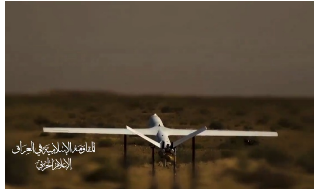
מימין: שיגור אחד הכטב"מים בתקיפה לעבר אילת ונמל חיפה; משמאל: שיגור טיל השיוט בתקיפה (ערוץ הטלגרם של ההתנגדות האסלאמית בעיראק, 15 ביולי 2024)

• "מקור מיוחד" ציין כי ההתנגדות האסלאמית בעיראק החליטה להסלים את פעולותיה הצבאיות בתגובה ל"טבח שביצעה ישראל" באלמואצי שבח'אן יונס, במהלך ניסיון הסיכול של ראש הזרוע הצבאית של חמאס, מחמד אלצ'יף. בגדודי חזבאללה ציינו כי אחרי "הטבח" בח'אן יונס, ישראל "אינה מבינה דבר מלבד שפת כלי הנשק, וזה דורש הגברת קצב הפעולות של ציר ההתנגדות נגד הישות הזו". הודעת הגדודים הוסיפה כי ארה"ב "משתתפת בהרג פלסטינים באמצעות תמיכה בציונים ואספקת אלפי טונות של פצצות" (אלמיאדין, 15 ביולי 2024).