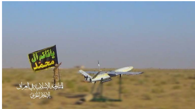
שיגור אחד הכטב"מים בתקיפה המשותפת (ערוץ הטלגרם של ההתנגדות האסלאמית בעיראק, 16 ביולי 2024)

• ב-15 ביולי 2024, קיבלו החות'ים בתימן וההתנגדות האסלאמית בעיראק אחריות על תקיפה משותפת נגד האונייה Olvia בים התיכון (ערוץ הטלגרם של יחיא סריע, 15 ביולי 2024; ערוץ הטלגרם של ההתנגדות האסלאמית בעיראק, 16 ביולי 2024). ההתנגדות האסלאמית בעיראק פרסמה תיעוד לכאורה של שיגור כלי טיס בלתי מאוישים (כטב"מים) במסגרת התקיפה המשותפת (ערוץ הטלגרם של ההתנגדות האסלאמית בעיראק, 16 ביולי 2024). אין אימות לטענה על התקיפה.