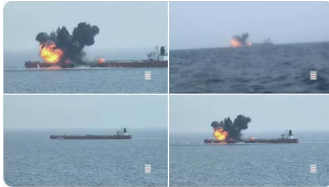
התיעוד לכאורה של תקיפת מכלית הנפט Chois Lion באמצעות כשב"ם (חשבון X של זרוע התקשורת הצבאית של החות"ים, 16 ביולי 2024)