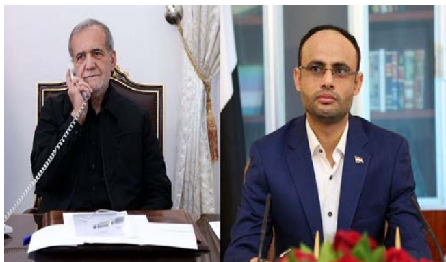
פ'זשכיאן ואלמשאט (אלעאלם, 15 ביולי 2024)

◀ ב-14 ביולי 2024, שוחח פ'זשכיאן עם ראש המועצה המדינית העליונה של החות'ים, מהדי אלמשאט, שבירך אותו על ניצחונו בבחירות והודה לאיראן על תמיכתה בעם הפלסטיני. הנשיא הנבחר שיבח את החלטת הנהגת החות'ים לתמוך בעם הפלסטיני בנסיבות הקשות הנוכחיות, וציין כי מספר מדינות מוסלמיות פועלות בהתאם לאינטרסים שלהן ומסתפקות בהצהרות. הוא הוסיף כי העמים החופשיים יעמידו לדין את השליטים שלא פעלו להפסקת "פשעי המשטר הציוני נגד העם הפלסטיני". כמו כן, הביע פ'זשכיאן את תקוותו להסרת המצור מעל תימן (אלעאלם, 15 ביולי 2024).