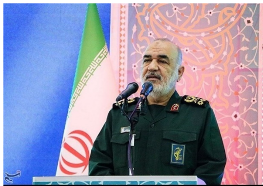
מפקד משמרות המהפכה (תסנים, 10 ביולי 2024)