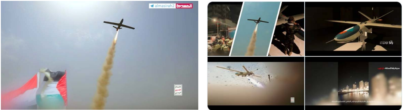
מימין: סרטון החשיפה של הכטב"ם "יאפא". משמאל: השיגור לכאורה לתל אביב (חשבון X של זרוע התקשורת הצבאית של החות'ים, 23 ביולי 2024)

ב- 23 ביולי 2024, הציגו הכוחות החות'ים את הכטב"ם "יאפא" (יפו), שלטענתם שימש לביצוע התקיפה בתל אביב. לפי החות'ים, הכטב"ם יוצר בתימן והוא בעל טווח פעולה ארוך, רב-משימתי, נושא ראש קרבי נפיץ ובעל יכולת לחמוק ממכ"ם וממערכות הגנה אווירית. בסרטון גם הוצג תיעוד לכאורה של שיגור הכטב"ם לעבר תל אביב (חשבון X של זרוע התקשורת הצבאית של החות'ים, 23 ביולי 2024).