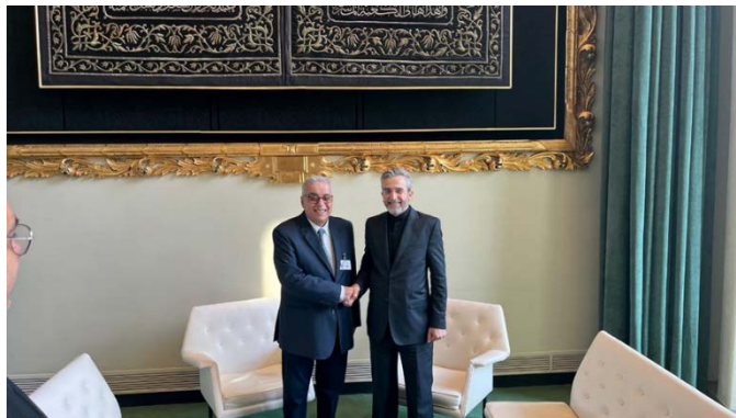
פגישת מ"מ שר החוץ האיראני עם שר החוץ הלבנוני בניו יורק (אתר משרד החוץ האיראני, 18 ביולי 2024)

• במהלך ביקורו בניו יורק, נועד באקרי עם שר החוץ הלבנוני, עבדאללה בו חביב, ודן עימו בהתפתחויות באזור וביחסים בין המדינות. באקרי הדגיש את תמיכת איראן ביציבות ובביטחון בלבנון וכן ב"התנגדות בפלסטין". הוא ציין כי איראן חותרת להפסקת התקיפות הישראליות על רצועת עזה כדי למנוע את התרחבות המלחמה באזור. באקרי הדגיש כי על המדינות המוסלמיות לגרום לישראל להתחרט על איומיה נגד לבנון (אתר משרד החוץ האיראני, 18 ביולי 2024).