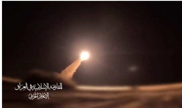
שיגור טיל שיוט לעבר חיפה

◆ 24 ביולי 2024: "מטרה חיונית" מצפון לאילת באמצעות כטב"מים. דובר צה"ל מסר כי מטוסי קרב יירוטו בהצלחה שני כטב"מים שהיו בדרכם לשטח ישראל מכיוון מזרח. הכטב"מים לא חדרו לארץ ולא היו בפגעים (ערוץ הטלגרם של דובר צה"ל, 24 ביולי 2024).