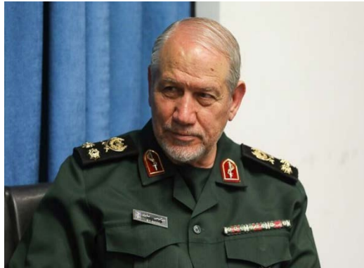
יחיא רחים צפוי (איסנ"א, 18 ביולי 2024)

איראן ח'אמנהאי, כי "המשטר הציוני לא יזכה לראות את 25 השנים הבאות וכי בעזרת האל נתפלל יחד בירושלים" (איסנ"א, 18 ביולי 2024).