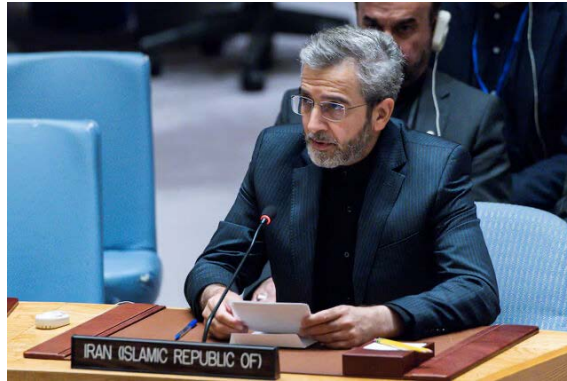
מ"מ שר החוץ האיראני באקרי (איסנ"א, 17 ביולי 2024)

נרחבת נגד לבנון תיענה בתגובה נחרצת ומעוררת חרטה מצד הקהילה הבינלאומית, עמי האזור וקבוצות "ההתנגדו"ת. הוא הטיל על ארה"ב את האחריות לכל "תוקפנות אפשרית מצד המשטר הציוני" נגד לבנון (איסנ"א, 17 ביולי 2024).