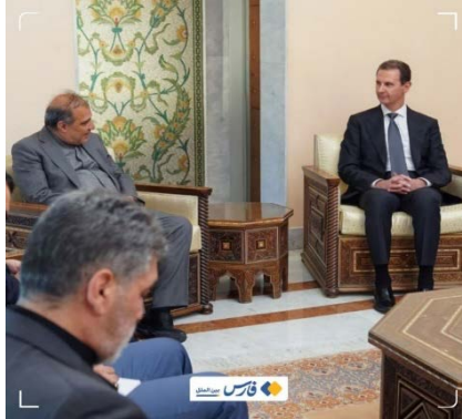
פגישת יועץ שר החוץ האיראני עם נשיא סוריה (פארס, 22 ביולי 2024)

• יועצו הבכיר של שר החוץ האיראני, עלי אצע'ר ח'אג'י, נועד עם נשיא סוריה, בשאר אסד, ועם שר החוץ הסורי, פיצל מקדאד, ודן עימם ביחסים בין המדינות, בשיתוף הפעולה בתחומים שונים ובהתפתחויות האזוריות (פארס, 22 ביולי 2024).