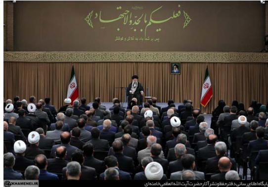
מנהיג איראן במפגש עם חברי מג'לס (אתר מנהיג איראן, 21 ביולי 2024)

”המשטר הציוני”. לטענתו, מאחר שארה"ב וישראל לא הצליחו להוריד את חמאס ו”ההתנגדות” על ברכיהן, הן משליכות פצצות על בתי חולים, בתי ספר ועל ראשי הילדים, הנשים והאזרחים (אתר מנהיג איראן, 21 ביולי 2024).