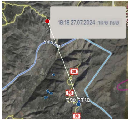
מימין: מסלול הרקטה שפגעה במג'דל שמש (דובר צה"ל, 28 ביולי 2024). משמאל: זירת הפגיעה במגרש הכדורגל (דובר צה"ל, 27 ביולי 2024)

◀ בלילה שבין 27-28 ביולי 2024, ביצע חיל האוויר סדרת תקיפות נגד יעדי חזבאללה בשבעה אזורים בדרום לבנון ובעומק לבנון, בהם מחסני אמצעי לחימה (דובר צה"ל, 28 ביולי 2024). בכירים ישראלים איימו בתגובה "חזקה" נגד חזבאללה, ובשעות הערב של ה-28 ביולי 2024, התכנס הקבינט המדיני-ביטחוני לדין באפשרויות התגובה. הקבינט הסמיך את ראש הממשלה ושר הביטחון לבחור את התגובה של ישראל לאירוע (תקשורת ישראלית, 28-27 ביולי 2024).