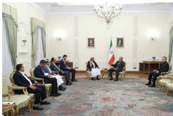
פגישת נשיא איראן ודובר החות'ים (אירנ"א, 30 ביולי 2024)

ב-29 ביולי 2024, נועד נשיא איראן פ'זשכיאן עם דובר החות'ים בתימן, מחמד עבד אלסלאם, ושיבח את החות'ים על תמיכתם בפלסטינים. הוא הדגיש כי על כל מדינות האסלאם לשתף פעולה כדי למנוע פגיעה במוסלמים וכי שיתוף הפעולה בין איראן ותימן ימשך ויתחזק (אירנ"א, 30 ביולי 2024). אלסלאם מסר כי הם דנו ביחסים בין תימן החות'ית ואיראן ובדרכים לפתח אותם לטובת שני העמים. כמו כן, הם שוחחו על רצועת עזה ו"פלסטין" ועל האחריות של כלל המוסלמים לתמוך ברצועת עזה בכל האמצעים האפשריים כדי לסייע לה להתמודד עם ישראל, ארה"ב והמערב (חשבון X של מחמד עבד אלסלאם, 30 ביולי 2024). ב-30 ביולי 2024, נפגש דובר החות'ים עם מנהיג איראן, עלי ח'אמנהאי (פארס, 30 ביולי 2024).