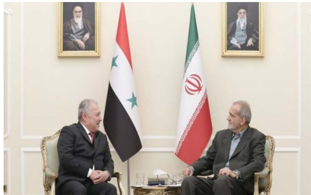
פגישת נשיא איראן וראש ממשלת סוריה (איסנ"א, 29 ביולי 2024)

• ב-29 ביולי 2024, נועד נשיא איראן פ'זשכיאן עם ראש ממשלת סוריה, חסין ערנוס, שהגיע לטהראן כדי להשתתף בטקס השבעתו. פ'זשכיאן הדגיש את הצורך בחיזוק הקשרים הכלכליים, המסחריים, התרבותיים והחברתיים בין שתי המדינות וציין, כי ממשלתו תנקוט בצעדים הדרושים כדי להאיץ את מימוש ההסכמים, שנחתמו בין המדינות (איסנ"א, 29 ביולי 2024).