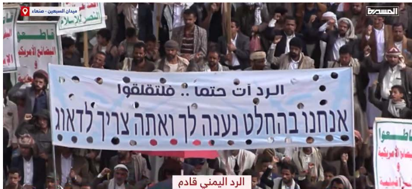
משתתפים בהפגנה בצנעא' (חשבון X של אלמסירה, 26 ביולי 2024)