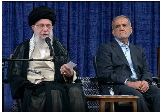
מנהיג איראן ונשיא איראן בטקס השבעת הנשיא (תסנים, 28 ביולי 2024)

האמריקאי לשבת ולהאזין לנאומו של "הפושע" נתניהו. לדבריו, הסוגייה הפלסטינית הפכה לסוגייה עולמית והיא התרחבה מהאו"ם ועד לאולימפיאדה בפריז. ח'אמנהאי הדגיש כי העולם חייב לקבל החלטות רציניות לנוכח ההתפתחויות ברצועת עזה ו"פשעי המשטר הציוני". הוא הוסיף כי כוחה של "ההתנגדות" ניכר יותר מיום ליום, וכי "המשטר הציוני" לא הצליח להכניע את "כוחות ההתנגדות" ואת חמאס חרף הסיוע מצד ארה"ב וכמה "מדינות בוגדניות" (אתר מנהיג איראן, 28 ביולי 2024).