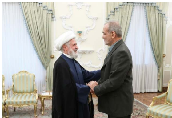
פגישת נשיא איראן עם סגן מזכ"ל חזבאללה (פארס, 29 ביולי 2024)

(פארס, 29 ביולי 2024). ב-30 ביולי 2024, נועד קאסם עם מנהיג איראן, עלי ח'אמנהאי, ששייב את התנהלות חזבאללה מאז תחילת המלחמה ברצועת עזה (תסנים, 30 ביולי 2024).