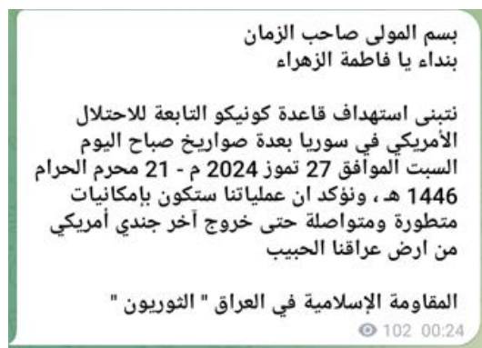
הודעת קבלת האחריות על התקיפה בקוניקו (ערוץ הטלגרם של ההתנגדות האסלאמית בעיראק - אלת'וריון, 27 ביולי 2024)

• ארגון שהזדהה בשם ההתנגדות האסלאמית בעיראק - אלת'וריון (המהפכנים) קיבל אחריות על התקיפות בעין אלאסד ובקוניקו. בהודעת קבלת האחריות צוין כי הארגון ימשיך את פעילותו עד שאחרון החיילים האמריקאים יעזוב את עיראק. ההערכה היא כי מדובר בשם כיסוי לצורך "חתימה נמוכה", כפי שנוהגים המשטר האיראני ושלוחיו לעשות לעיתים קרובות במקרים של תקיפות נגד יעדים אמריקאיים בעיראק ובסוריה (NEWS1-IQ, 27 ביולי 2024).