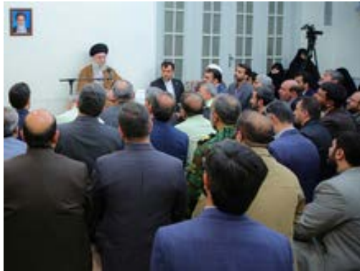
מנהיג איראן במפגש בטהראן (אתר המנהיג, 25 ביולי 2024)

• מנהיג איראן, עלי ח'אמנהאי, אמר במפגש בטהראן כי התנועה הפרו-פלסטינית ברחבי העולם נובעת מרוח המהפכה האסלאמית. הוא ציין כי הפגנות הסטודנטים הפרו-פלסטיניים בארה"ב הן "תופעה חסרת תקדים בהיסטוריה בת זמננו". לדבריו, זרם התמיכה ב"פלסטין" מצד סטודנטים בארה"ב התרחב עד כדי כך שהממשל האמריקאי מפר את כל טענותיו וסיסמאותיו בנוגע לזכויות אדם והמשטרה מכה ועוצרת את הסטודנטים והמרצים (אתר מנהיג איראן, 25 ביולי 2024).