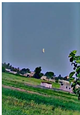
בלון התצפית האמריקאי נופל לקרקע אחרי הפגיעה (חשבון X של נהר מדיה, 3 באוגוסט 2024)

• באופוזיציה הסורית דיווחו כי מיליציות איראניות פגעו בבלון תצפית אמריקאי שטס מעל האזור המזרחי של דיר אלזור במזרח סוריה. לפי הדיווח, הבלון נפל בעיר דיבאן (חשבון X של נהר מדיה, 3 באוגוסט 2024).