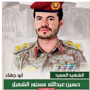
הקצין החות'י, חסין מסתור, שנהרג בתקיפה בעיראק (תסנים, 4 באוגוסט 2024)

• "גורמי ביטחון אמריקאיים" מסרו כי בתקיפה האמריקאית נגד בסיס של המיליציות בעיראק ב-30 ביולי 2024, נהרגו מפקד ושלושה פעילים של גדודי חזבאללה, נהרג גם הקצין החות'י הבכיר, חסין מסתור, שהיה מומחה בתחום הכטב"מים. לפי הדיווח, מסתור שהה בעיראק כדי לאמן לוחמים וכי הוא נהרג יחד עם פעילי ההתנגדות האסלאמית בעיראק בעת שנערכו לתקוף כוחות אמריקאיים באזור. בדיווח צוין כי הבכיר החות'י ממחיש את שיתוף הפעולה המתחזק בין ארגונים המשתייכים ל"חזית ההתנגדות" בהובלת איראן (ווישינגטון פוסט, 5 באוגוסט 2024).