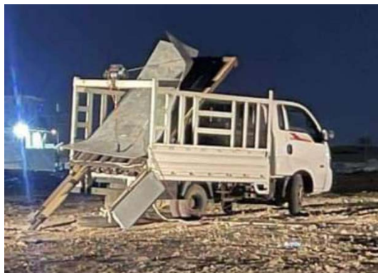
המשאית ממנה שוגרו הרקטות לעבר בסיס עין אלסד

• מחלקת ההסברה המדינית של עיראק מסרה כי התקיפה נגד בסיס עין אלסד בוצעה באמצעות שתי רקטות ששוגרו מאזור חדית'ה וכי כוחות הביטחון העיראקיים תפסו כלי רכב ובו שמונה מתוך עשר הרקטות שהוכנו לשיגור. בהודעה נאמר כי הכוחות העיראקיים לא יאפשרו "שאדמת עיראק תהפוך לזירה של סגירת חשבונות ושהיא תיגרר למצוקות של מלחמות ולהשלכות של סכסוכים" (חשבון X של מחלקת ההסברה המדינית של עיראק, 6 באוגוסט 2024). דווח כי שלושה חשודים נעצרו במערב אלנבאר בעיראק בחשד למעורבות בתקיפה נגד בסיס עין אלסד (חשבון X של אלערביה, 6 באוגוסט 2024).