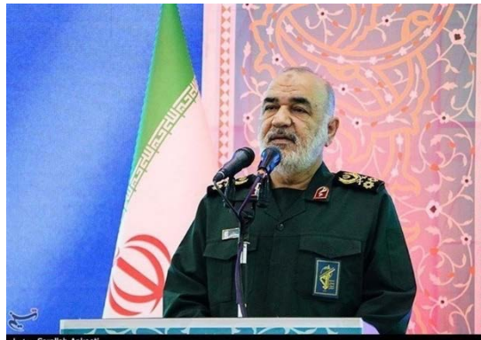
מפקד משמרות המהפכה (תסנים, 5 באוגוסט 2024)