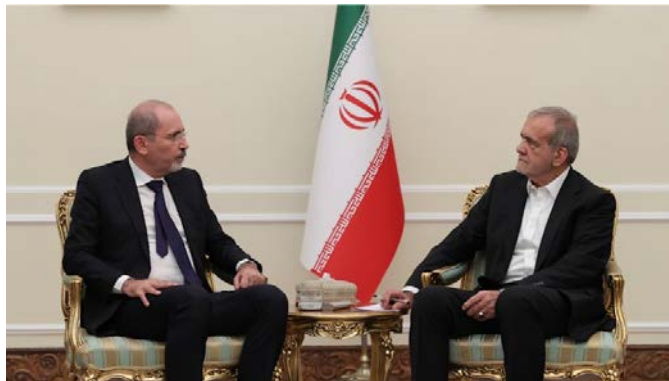
פגישת נשיא איראן עם שר החוץ הירדני (אתר נשיא איראן, 4 באוגוסט 2024)