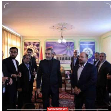
ביקור מ"מ שר החוץ האיראני בלשכת חמאס בטהראן (5 באוגוסט 2024)

• ממלא מקום שר החוץ האיראני, עלי באקרי, ביקר בלשכת חמאס בטהראן ונועד עם נציג חמאס, ח'אלד קדומי, ומסר את תנחומיו על מותו של אסמאעיל הניה. הוא ציין כי מותו של הניה חיזק את "חזית ההתנגדות" ב"פלסטין" ובאזור ואת הקשר בין העם הפלסטיני ואיראן. באקרי הוסיף כי הפגיעה בהניה היא הפרה של החוקים הבינלאומיים, והדגיש כי לאיראן יש את הזכות להגיב כראוי מתוך הגנה על ביטחונה וריבונותה וכי היא תגיב באופן נחרץ על "פעולה הנפשעת של המשטר הציוני" (ערוך הטלגרם של משרד החוץ האיראני, 6 באוגוסט 2024).