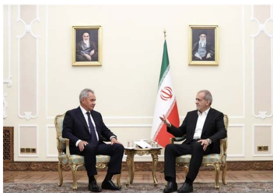
פגישת פ'זשכיאן ושויגו (תסנים, 5 באוגוסט 2024)

• על רקע האיומים האיראניים בתגובה נגד ישראל, ב-5 באוגוסט 2024 הגיע מזכיר המועצה לביטחון לאומי של רוסיה, סרגיי שויגו, לביקור באיראן. שויגו, ששימש שר ההגנה של רוסיה במשך עשרים שנה עד מאי 2024, נועד עם הנשיא מסעוד פ'זשכיאן, עם מזכיר המועצה לביטחון לאומי עלי-אכבר אחמדיאן ועם ראש המטה הכללי של הכוחות המזוינים האיראנים, מחמד באקרי (אירנ"א, 5 באוגוסט 2024). • פ'זשכיאן ציין בפגישה עם שויגו כי רוסיה הייתה אחת המדינות שניצבה לצד איראן "בימים הקשים שעוברים על העם האיראני" ושיבח אותה על "עמדותיה החיוביות" ביחס לפלסטינים. הנשיא האיראני מתח ביקורת על התמיכה של ארה"ב ושל חלק ממדינות המערב "בפשעי היישות הציונית", והוסיף כי איראן אינה מבקשת להרחיב את המשבר באזור, אולם "היישות הזו תקבל תגובה על פשעיה ועל היהירות שלה". שויגו הביע שביעות רצון מהמאמצים המשותפים של שתי המדינות ליצור עולם רב קוטבי ולהבטיח את הביטחון האזורי (תסנים, 5 באוגוסט 2024).