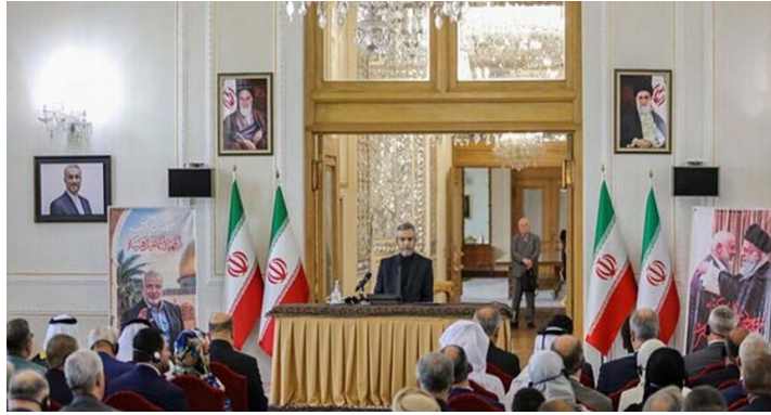
מפגש מ"מ שר החוץ האיראני עם נציגים זרים בטהראן (מהר, 5 באוגוסט 2024)

• ממלא מקום שר החוץ האיראני, עלי באקרי כני, מתח במפגש עם שגרירים ונציגים זרים במשרד החוץ בטהראן ביקורת על אדישות הקהילה הבינלאומית לנוכח "פשעיה" של ישראל, וציין כי על כולם מוטלת אחריות מוסרית לא לשתוק לנוכח אחד הפשעים החמורים ביותר במאה האחרונה: כיבוש "פלסטין", הגליה ו"רצח עם" מתמשך של אומה. הוא הוסיף, כי "הפשע" שביצעה ישראל בהתנקשות באסמאעיל הניה הוא חלק מתוכניתה של ישראל לבצע "רצח עם" של הפלסטינים, שמיושמת במישורים שונים (מהר, 5 באוגוסט 2024).