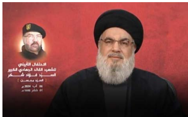
נצראללה במהלך הנאום (אלמנאר, 6 באוגוסט 2024)