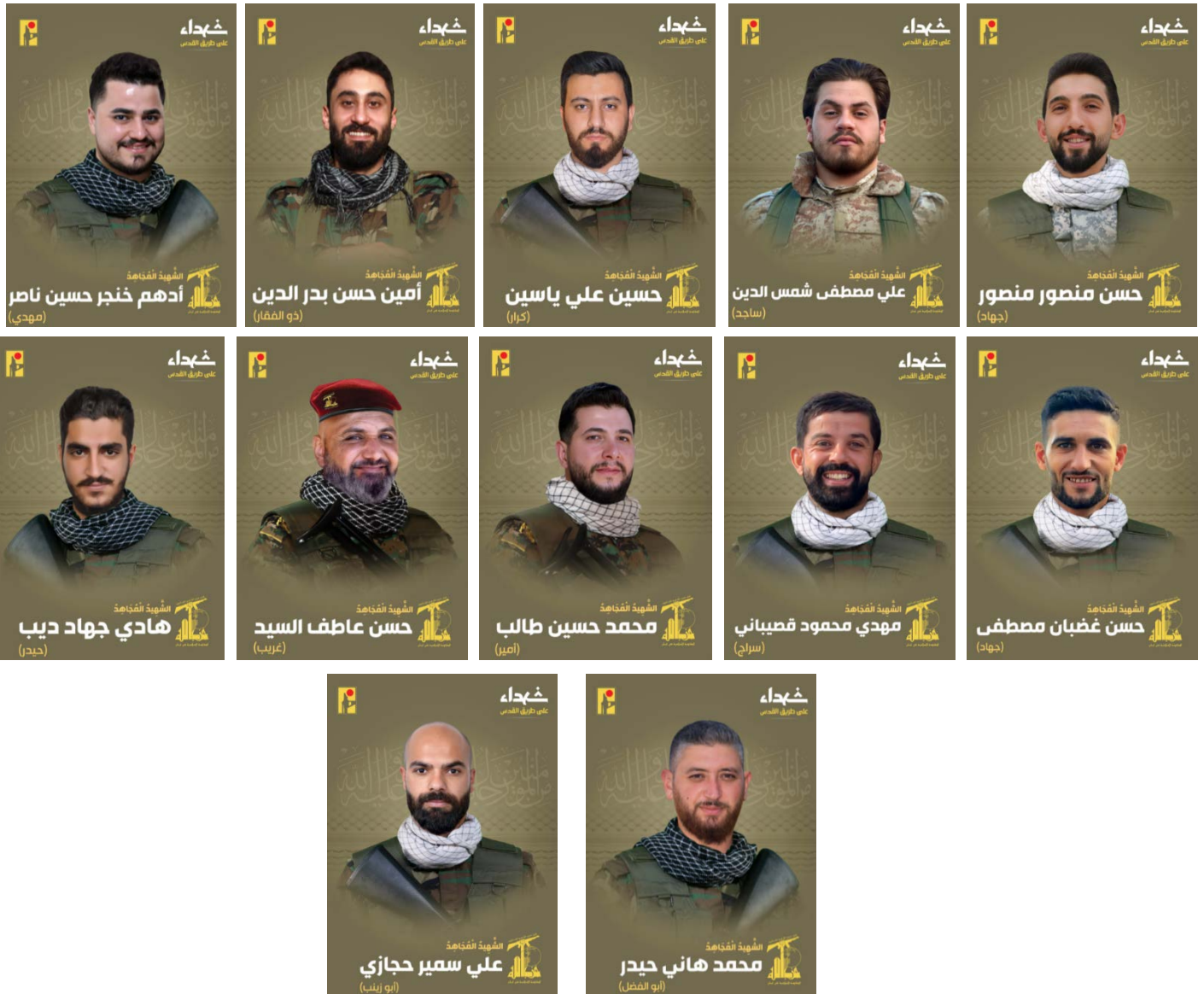
הרוגי חזבאללה