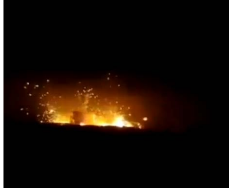
הפיצוצים בעקבות תקיפת מחסן אמצעי הלחימה (חשבון X של Athran, 9 באוגוסט 2024)