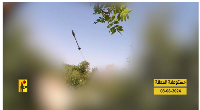
מימין: שיגור רקטת ברכאן IRAM לעבר מטולה ב-3 באוגוסט 2024; משמאל: פגיעת הרקטה במבנה (ערוץ הטלגרם של זרוע ההסברה הקרבית של חזבאללה, 8 באוגוסט 2024)

◀ להלן פירוט התקיפות (ערוץ הטלגרם של זרוע ההסברה הקרבית של חזבאללה, 5-12 באוגוסט 2024, עד השעה 13:00):