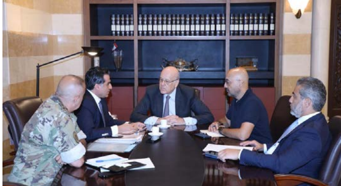
ישיבת היערכות בראשות מיקאטי

◀ ראש ממשלת המעבר בלבנון, נג'יב מיקאטי, כינס ישיבת חירום לדיון במצב מוכנות המדינה לחירום, לרבות מוכנות מקלטים ואספקת מזון לתושבים. (אלג'דיד, 7 באוגוסט 2024).