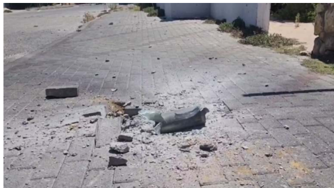
שרידי רקטה שנפלה בקריית שמונה (דוברות עיריית קריית שמונה, 9 באוגוסט 2024)

◆ 10 באוגוסט 2024: בוצעו עשר תקיפות. מספר כטב"מים שוגרו לצפון הארץ, אחד מהם יורט וחלקם נפלו וגרמו לנזק ולשריפות. לא היו נפגעים (דובר צה"ל ותקשורת ישראלית, 10 באוגוסט 2024). ◆ 9 באוגוסט 2024: בוצעו תשע תקיפות. רקטות נפלו בשטחים חקלאיים באזור מנרה, קריית שמונה, מטולה וכפר יובל, לא היו נפגעים; רקטות נפלו בקריית שמונה. לא היו נפגעים, נגרם נזק לרכוש; טילי נ"ט פגעו בבית ובספריית מנרה, לא היו נפגעים (דובר צה"ל ותקשורת ישראלית, 9 באוגוסט 2024).