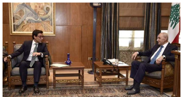
פגישות שר החוץ הצרפתי. מימין: עם ברי; משמאל: עם מיקאטי (אלנשרה, 15 באוגוסט 2024)