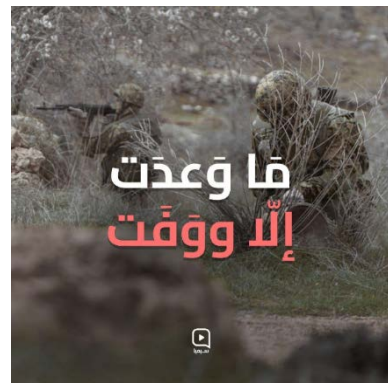
כרזות לציון יום "הניצחון. מימין: "אל תבטיח, אלא אם תקיים"; במרכז: "מעל האדמה ומתחתיה"; משמאל: "ההתנגדות מקיימת את הבטחתה" (סימא, 15 ו-17 באוגוסט 2024)