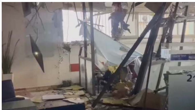
מימין: נזק במבנה בקריית שמונה (דוברות קריית שמונה, 14 באוגוסט 2024). משמאל: שריפות בגליל העליון בעקבות נפילות (דוברות כיבוי והצלה צפון, 17 באוגוסט 2024)