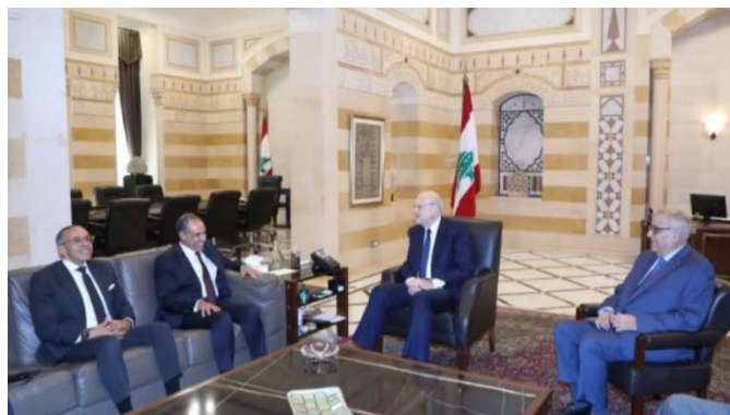
פגישת מיקאטי ובו חביב עם שר החוץ המצרי (סוכנות הידיעות הלבנונית, 16 באוגוסט 2024)

ראש ממשלת המעבר בלבנון, נגיב מיקאטי, ושר החוץ, עבדאללה בו חביב, נועדו בבירות עם שר החוץ המצרי, בדר עבד אלעאטי, ודנו עמו ביחסים בין המדינות ובמאמצים לעצירת המתרחבות באזור. נמסר כי מיקאטי הביע הערכה למאמצים הבינלאומיים, הערביים והמצריים בפרט להשגת הפסקת אש ברצועת עזה ולעצירת "התוקפנות" הישראלית נגד דרום לבנון. מיקאטי הוסיף כי לבנון מחויבת להחלטה 1701 באופן מלא. עבד אלעאטי הביע את תמיכת מצרים בלבנון ואת מחויבותה למאמצים להפסקת אש (סוכנות הידיעות הלבנונית, 16 באוגוסט 2024).