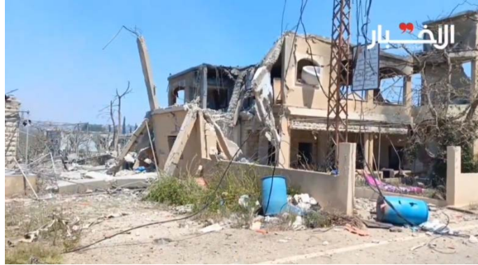
זירת התקיפה באלצ'הירה (אלאח'באר, 18 באוגוסט 2024)

◀ הודעת יוניפי"ל נמנעה מלהטיל ישירות את האשמה לפגיעה במשקיפים על ישראל, אולם "גורם" בכוח מסר כי הם בודקים כיצד תקיפה ישראלית פגעה בחיילים. ה"גורם" הדגיש כי פגיעה בכוחות בדרום לבנון היא בלתי מתקבלת על הדעת (אלחדת', 18 באוגוסט 2024).