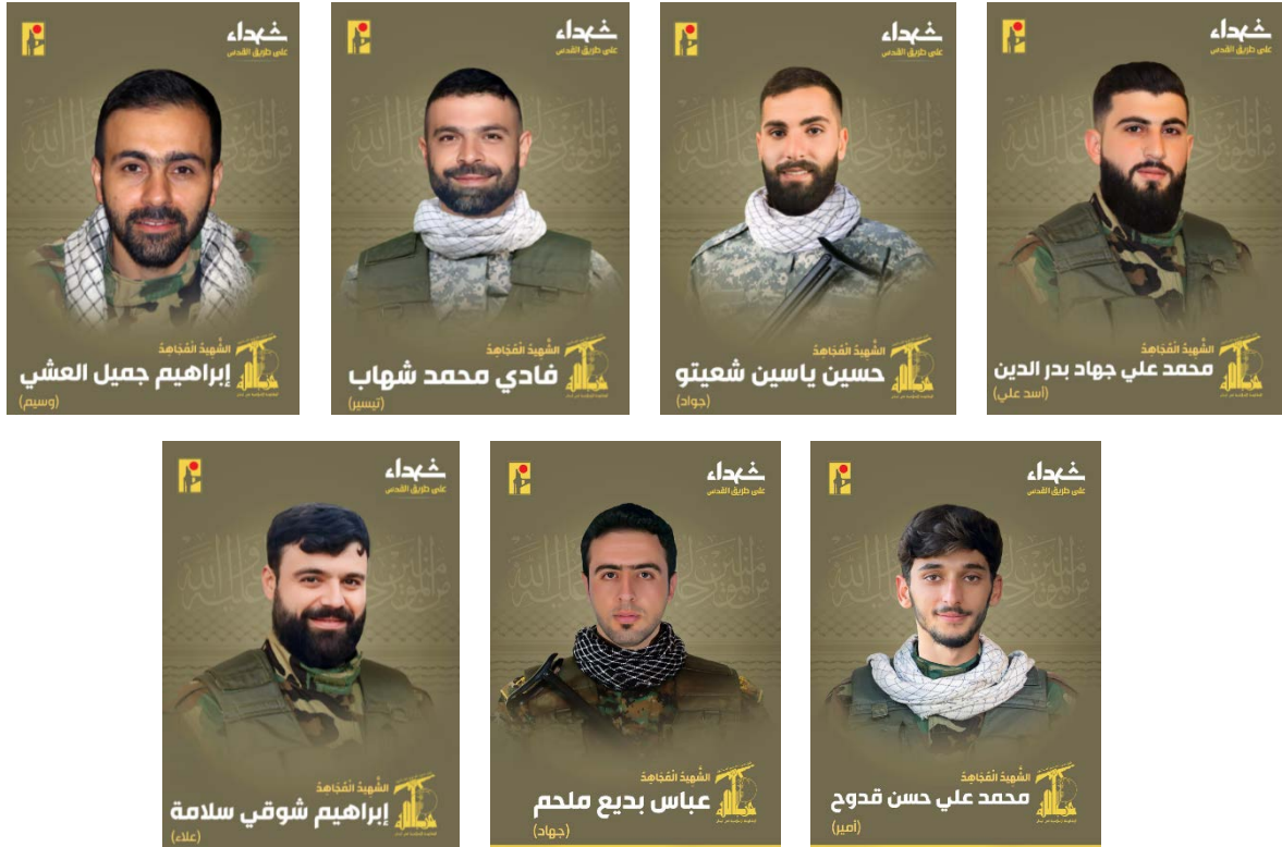
הרוגי חזבאללה (ערוץ הטלגרם של זרוע ההסברה הקרבית של חזבאללה, 13-19 באוגוסט 2024)