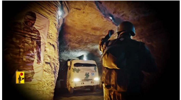
מימין: משאית נושאת טילים במנהרות של עמאד 4. משמאל, מתקן עמאד 4 (ערוץ הטלגרם של זרוע ההסברה הקרבית של חזבאללה, 16 באוגוסט 2024)

◀ תיק הרשתות החברתיות של חזבאללה, סימא, פרסם סרטון לוחמה פסיכולוגית בערבית, הכולל תרגום לעברית, שכותרתו: "ציוד שתזדקקו לו במלחמה הבאה". בסרטון הוצגו מספר פריטים היוצאים מתוך מזוודה: נעלי ריצה "כדי לברוח במהירות", מצופים כאשר "ספינות הקרב שלכם תטבענה", פנס חשמלי "כאשר לא תהיה לכם אספקת חשמל", דרכון כדי "שתחזרו להיכן שהגעתם" ותרופות הרגעה למצבי פאניקה (סימא, 14 באוגוסט 2024).