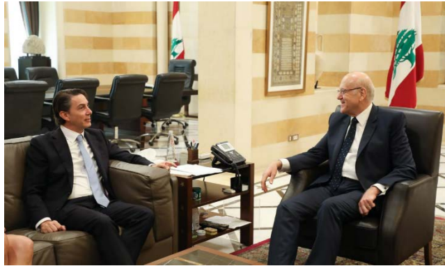
פגישת הוכשטיין ומיקאטי (חשבון X של ראש ממשלת לבנון, 14 באוגוסט 2024)

◆ הוכשטיין גם נועד עם מפקד צבא לבנון, גנרל ג'וזף עון (חשבון X של צבא לבנון, 14 באוגוסט 2024). "מקורות" מסרו כי הפגישה התמקדה במוכנות הצבא ובצרכיו לקראת השלב הבא. בהקשר זה, דווח כי הממשלה הלבנונית אישרה גיוס של 1,500 חיילים חדשים, כחלק מתוכניתו של הגנרל עון לגייס 6,000 חיילים נוספים (אלאח'באר, 15 באוגוסט 2024).